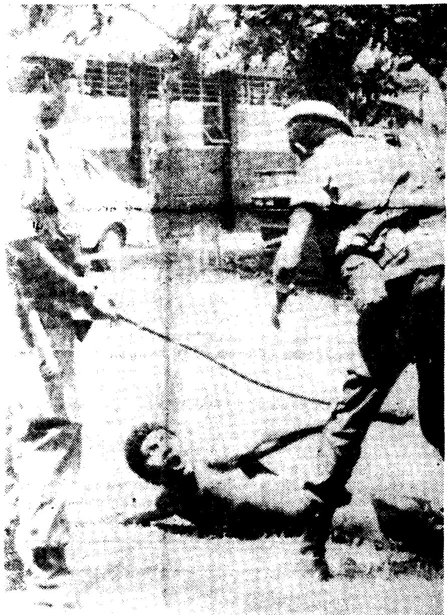
.....dieven, aanranders en plegers van andere misdrijven in Suriname worden sinds de militaire coup van het week geleden hard onder handen genomen door de nieuwe machthebbers. Op bijgaande foto uit het Surinaamse dagblad De Ware Tijd een beeld van een afranseling door militairen met een lange stok. Deze gruwelijke beelden zullen ook te zien zijn vanavond op TeleCuracao.....

In de reportage van vanavond is ook een vraaggesprek opgenomen met de negen leden van de Nationale Militaire Raad. De NOS- en ATM-vertegenwoordigers zijn gistermiddag op Curacao teruggekeerd.