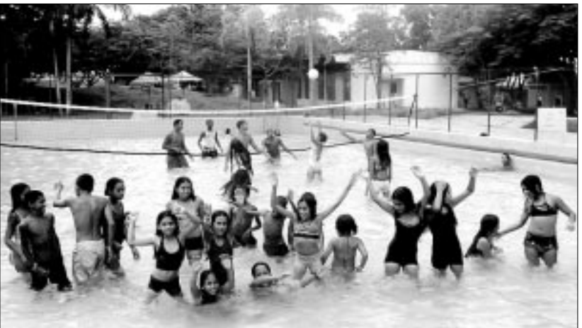
Baño, baile y voli acuático en este verano con los míos.