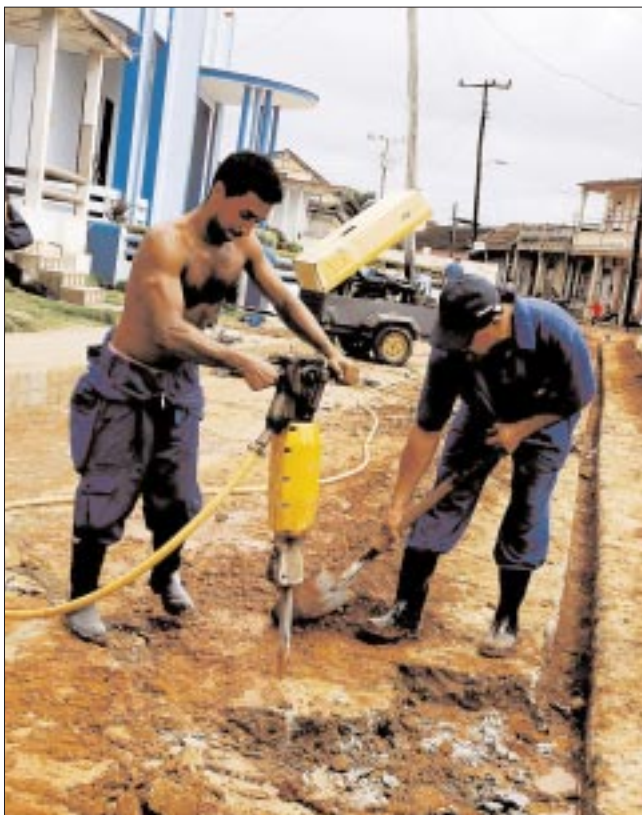
La rehabilitación de las redes dentro de la ciudad se complejiza por las características de las calles estrechas de la urbe.

Cuando finalicen esos trabajos, la bien llamada obra del siglo, y unos 45 mil habitantes de Baracoa, más de la mitad de la población del municipio, estará disfrutando en su casa de agua buena que ya entra en la Primada.