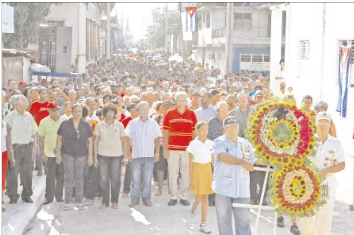
El pueblo guantanamero en marcha junto con los dirigentes del territorio llegó hasta el monumento dedicado a los mártires del 4 de Agosto para rendirles tributo.

ÓRGANO OFICIAL DEL COMITÉ PROVINCIAL DEL PARTIDO EN GUANTÁNAMO