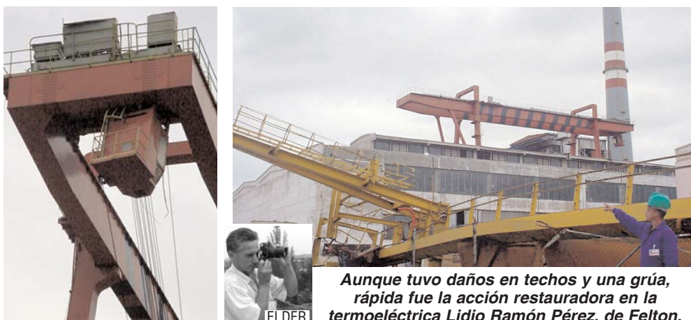
Aunque tuvo daños en techos y una grúa, rápida fue la acción restauradora en la termoelectricidad Lidio Ramón Pérez, de Felton.