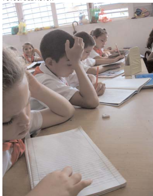
En la Fábrica de Sorbetos José Ramón Anglada funciona una de las aulas emergentes de la Escuela Primaria Julio Antonio Mella.

los de la escuela primaria rural Carlos Pérez, de Yaguajay. No obstante, trabajadores, padres, vecinos de la comunidad e integrantes de las organizaciones de masas, como ha sido en la generalidad del territorio, han contribuido a la limpieza y rehabilitación. Otro tanto ocurrió en la “Raúl Llanos”, de Samá, donde 62 educandos, de preescolar a sexto grado ya no tienen una de sus aulas a cielo abierto.