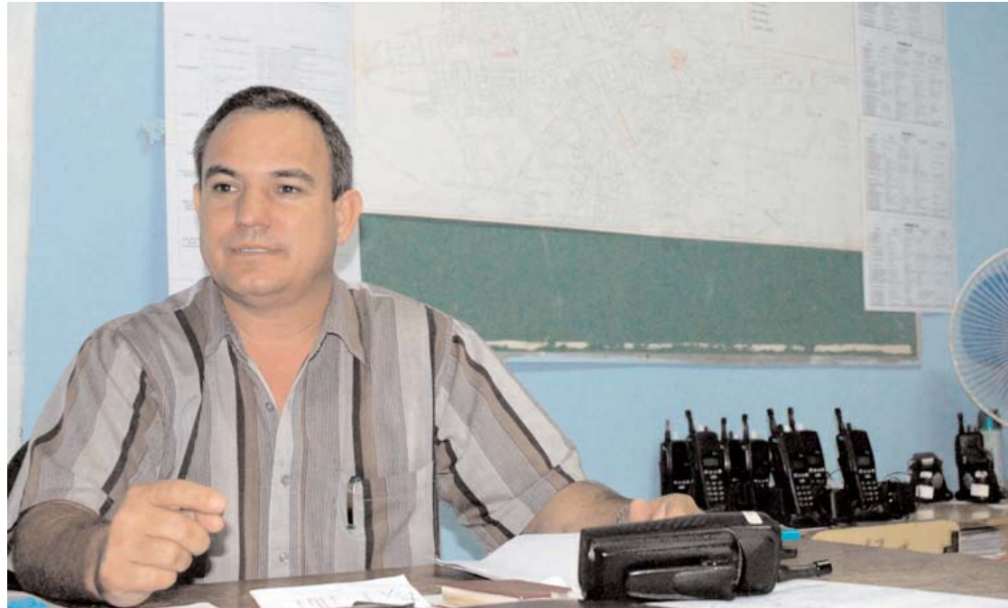
"El Partido y el Gobierno, tanto del municipio como de la provincia, ofrecieron apoyo total a esta Comisión del Carnaval".

La Comisión del Carnaval, compuesta por 15 subcomisiones, es un importante eslabón en el acontecimiento que la pasada semana juntó aproximadamente a medio millón de personas en 36 áreas cerradas y 16 abiertas. Alvaro Grass conversa sobre las interioridades del Carnaval-2010