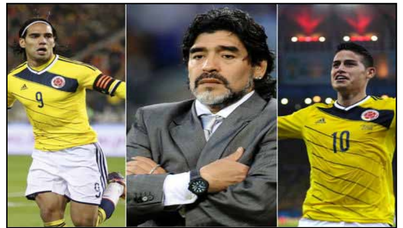
El alcalde de Bogotá, Gustavo Petro, informó que organiza un partido de fútbol por la paz para el próximo 10 de abril, en el que se prevé la participación de Diego Armando Maradona, James Rodríguez, Radamel Falcao y Carlos «El Pibe» Valderrama.

La Alcaldía de Bogotá está gestionando la asistencia de las estrellas del fútbol, con sus respectivos representantes, que hasta el momento no han confirmado.