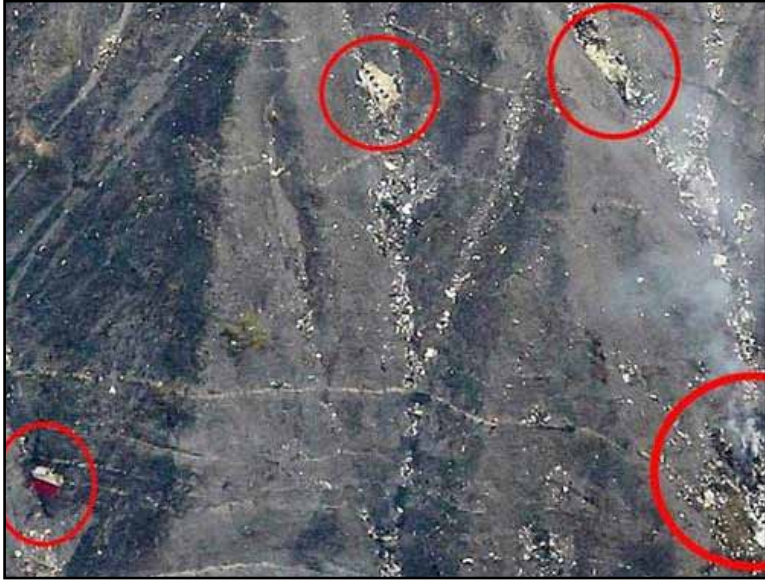
El presidente de Lufthansa, Carsten Spohr, avaló la teoría de la fiscalía de Marsella y admitió que la caída del avión de Germanwings se produjo por una acción deliberada del copiloto.

BERLIN, 26 de marzo.— El presidente de Lufthansa, Carsten Spohr, avaló la teoría de la fiscalía de Marsella y admitió que la caída del avión de Germanwings se produjo por una acción deliberada del copiloto, pero dijo que no había indicios para prever esta situación y se mostró “desconcertado” por la nueva hipótesis.