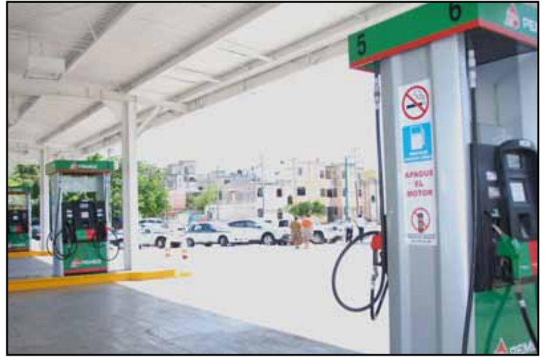
El Sindicato de Choferes, Taxistas y Similares del Caribe anunció oficialmente el cierre indefinido de su Estación de Servicios "Andrés Quintana Roo" S.A de C.V, con el giro de comercio al por menor de gasolina y diesel, debido a que se encuentra en una etapa de auditoría por evidentes malos manejos financieros.

Asimismo, cabe resaltar que la Dirección Jurídica de este gremio, está valorando la posibilidad de