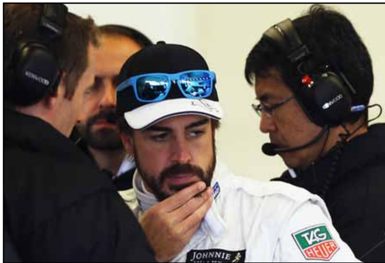
El español Fernando Alonso aseguró que no perdió el conocimiento por el impacto.

«Fue una conmoción cerebral más o menos normal. Sufrí esa conmoción y fui al hospital en buenas condiciones. Hay un momento en el que no recuerdo, de las dos a las seis de la tarde,