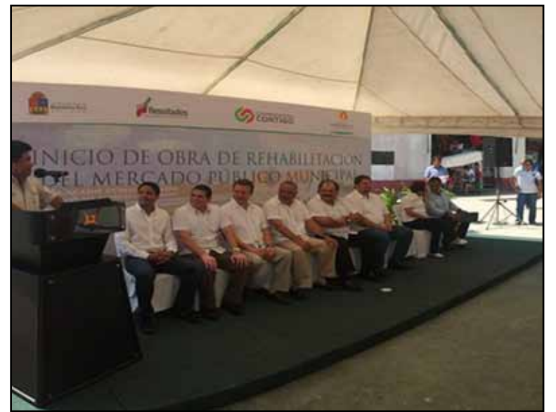
Se invertirán 6.7 millones de pesos para reconstruir y dar mantenimiento a este tradicional mercado de abasto de la capital del estado.

Las autoridades que dieron inicio a los trabajos, coincidieron en señalar que el nuevo proyecto para el mercado de abasto Altamirano, busca hacer más atractiva su estructura para mejorar el número de clientes, así como mejorar el consumo eléctrico para los locatarios, al tiempo de beneficiar con un nuevo diseño que facilite el mantenimiento.