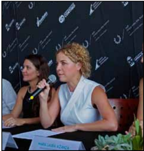
Playa del Carmen será la sede principal de este evento, aunque también está contemplada la proyección de filmes en Puerto Morelos, Cancún, Isla Mujeres y Tulum.

CANCÚN.— Con el fin de promover y difundir las producciones más sobresalientes de la industria cinematográfica mundial, del 23 al 29 de abril se realizará la cuarta edición del Riviera Maya Film Festival (RMFF) 2015, con sede principal en Playa del Carmen, para luego incluir un ciclo de proyecciones con lo más representativo de su programación en Puerto Morelos, Cancún, Isla Mujeres y Tulum.