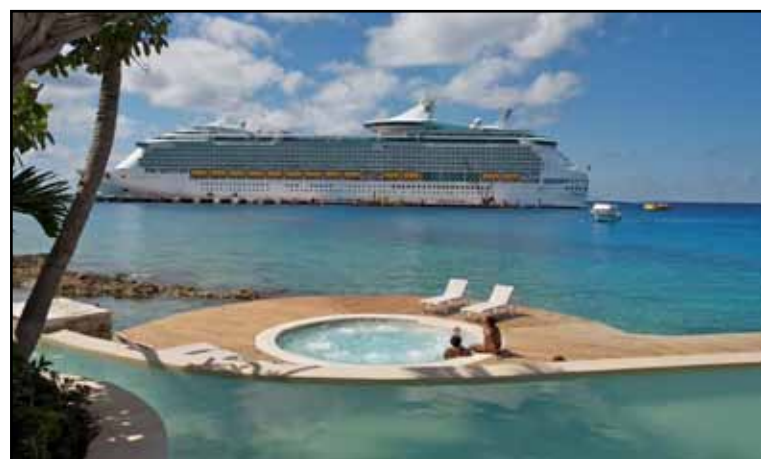
Se realizó en esta isla el «Primer Foro de Capacitación de Cruceros y Destinos», en el que se tuvo la participación de 40 agentes de viaje provenientes de la Ciudad de México; Mérida, Yucatán y Cancún, Quintana Roo.

Asimismo, el titular de Turismo, resaltó la sinergia entre el sector turística y el gobierno municipal para llevar a cabo con éxito acciones como éstas, por