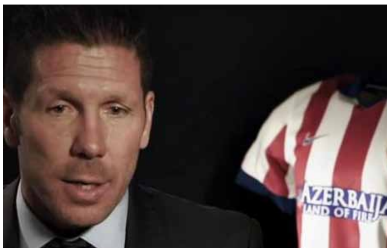
"Hasta 2020 será exigente para todos. Obviamente para nosotros (cuerpo técnico) en el desafío de seguir luchando, y para ellos por aguantarnos", indicó Diego Simeone sobre la renovación de su contrato con el Atlético de Madrid.

MADRID, 26 de marzo. — «Lo más difícil que hay en la vida es mantener una estabilidad, y el club ha confiado, ha apostado una vez más en mantener un proyecto estable, donde se ve un crecimiento muy fuerte por parte del club y una ilusión enorme en lo que va a venir: el estadio y seguir compitiendo de la