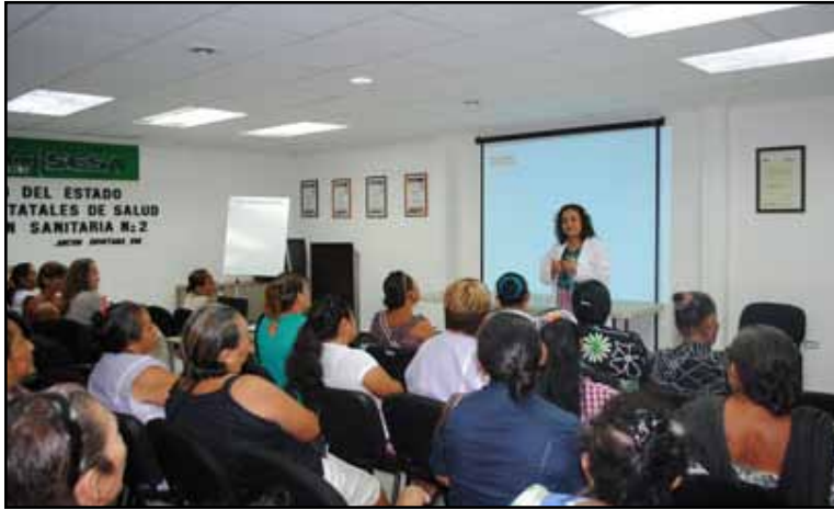
Durante la capacitación abordan temas sobre detección de embarazo de alto riesgo, cartilla de la mujer, vacunas en la mujer embarazada, revisión de peso y talla.

Hizo énfasis en la obligación que tienen las parteras registradas en el padrón de la Sesa, de asistir a los cursos de capacitación que mensualmente les brindan para actualizar y certificar sus conocimientos y de esa manera