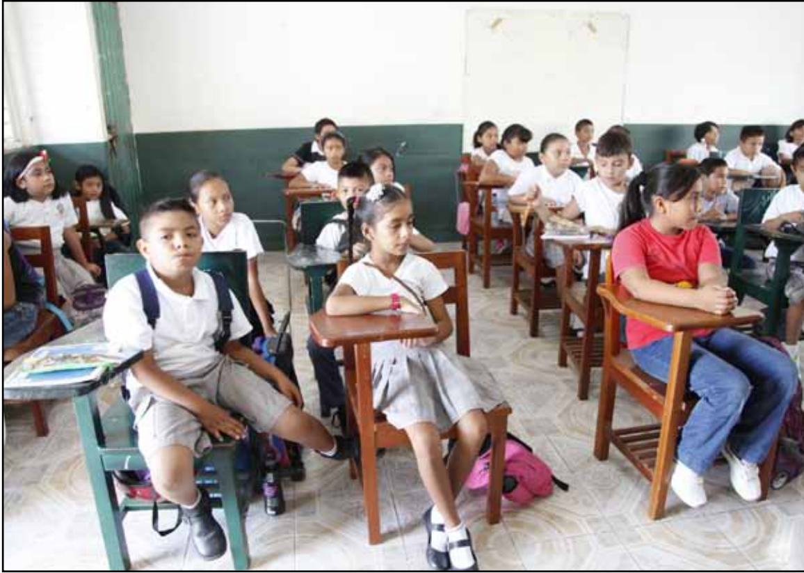
El lunes 30 de marzo comienzan las vacaciones de Semana Santa para 410 mil 617 alumnos y 21 mil 184 docentes de todos los niveles educativos, de 2 mil 309 escuelas públicas y particulares, las cuales concluirán el viernes 10 de abril.

CHETUMAL.— El lunes 30 de marzo comienzan las vacaciones de Semana Santa para 410 mil 617 alumnos y 21 mil 184 docentes de todos los niveles educativos, de 2 mil 309 escuelas públicas y particulares del estado, para concluir el viernes 10 de abril de 2015, de acuerdo al calendario Escolar Oficial 2014-2015 de la Secretaría de Educación Pública.