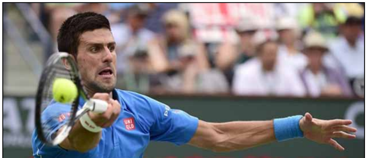
El tenista eslovaco Martin Klizan será el rival del número uno del mundo, el serbio Novak Djokovic, en la segunda ronda del Masters 1000 de Miami tras ganar al italiano Paolo Lorenzi por 6-3 y 6-4.

La tenista española, que ocupa el puesto 419 de la WTA y que fue invitada por el torneo, tenía que enfrentarse inicialmente a la china Shuai Peng, decimotercera favorita, que se retiró debido a una lesión.