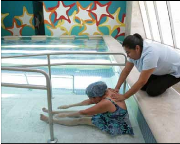
Detalló que entre los usuarios de los servicios de la dependencia se encuentran niñas, niños y jóvenes, adultos y adultos mayores con algún tipo de discapacidad o con tratamientos para prevenirla.

Puntualizó que a actualmente la dependencia atiende a 168 niños, 102 niñas, 60 jóvenes, 269 adultos