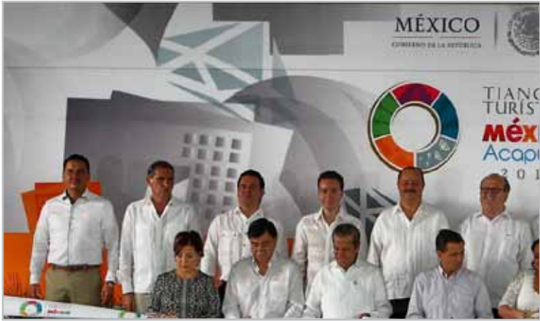
Al inaugurar el Tianguis Turístico el presidente Enrique Peña Nieto confirmó que 2014 fue el mejor año en la historia de la industria turística de México y destacó que no sólo están viniendo más visitantes, sino que también están gastando más.

ACAPULCO.— El gobernador de Quintana Roo y presidente de la Comisión de Turismo de la Conferencia Nacional de Gobernadores (Conago), Roberto Borge Angulo, acompañó al presidente Enrique Peña Nieto y a la secretaria federal de Turismo, Claudia Ruiz Massieu Salinas, en el corte del listón inaugural de la 40a edición del Tianguis Turístico de México "Acapulco 2015", que se lleva al cabo en el Foro Mundo Imperial.