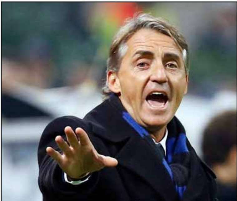
A Roberto Mancini, técnico del Inter de Milán, le disgusta que jugadores nacidos en otro país sean convocados a la selección italiana de fútbol, como es el caso del atacante del Sampdoria, Eder, nacido en Brasil, y el argentino del Palermo Franco Vázquez.

Decenas de jugadores nacidos en el extranjero, la mayoría brasileños y argentinos, han jugado para Italia a través de los años, entre los más importantes el argentino Omar Sivori y el brasileño Jose Altafini en la década de 1960 y el argentino Mauro Camoranesi, quien fue titular en el equipo que ganó la Copa del Mundo de 2006.