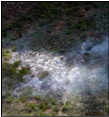
Un total de 11 conatos de incendios forestales han sido controlados y liquidados en las dos últimas semanas en la Zona Norte de Quintana Roo, gracias a los oportunos reportes ciudadanos y la movilización de elementos de los Comités Municipales de Prevención, Combate y Control de Incendios Forestales.

forestales abarca del 16 de enero al 16 de julio, sin embargo, la etapa álgida inicia en marzo con la elevación de la temperatura, baja humedad relativa, la intensificación de rachas de viento y sequía prolongada —refirió.