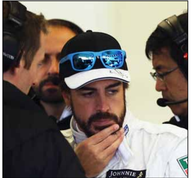
La escudería McLaren-Honda dio a conocer que Fernando Alonso regresará a la cabina de su MP430 para el Gran Premio de Malasia este fin de semana.