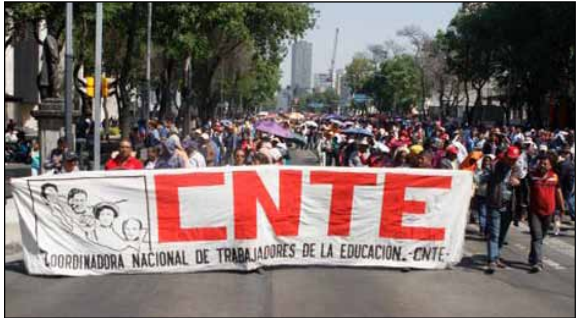
El amago de la Coordinadora Nacional de Trabajadores de la Educación para instalar un plantón en la sede del consejo local del INE en Oaxaca y en las 11 juntas distritales en el estado no pone en riesgo los comicios, aseguró el consejero electoral Ciro Murayama.

Ayer la asamblea plenaria de la sección 22 de la CNTE acordó realizar un boicot a los comicios en Oaxaca, para lo que anunció el traslado de su plantón a las sedes del consejo local del INE y de las 11 juntas distritales. Además advirtió que no permitirá la instalación de casillas en las 13 mil 500 escuelas que tiene bajo su control.