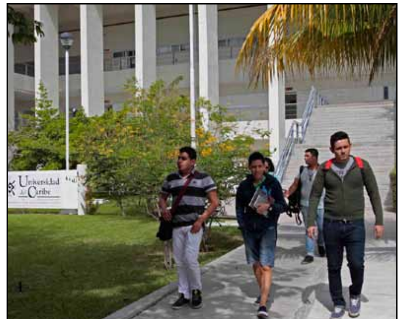
La Universidad del Caribe encabezará este proyecto de investigación, a través del cual se podrán definir regiones del país para conocer sus potencialidades y sugerir políticas de desarrollo orientadas a fortalecer la actividad turística.

Cabe recordar que en la Sectur solamente existían los Programas Regionales: México Norte, Mundo Maya, Ruta de los Dioses, Tesoros Coloniales en el Corazón de México, Mar de Cortés-Barrancas del Cobre y Centros de Playa, por lo que este nuevo estudio sentará las bases para la asignación de recursos del Programa para el Desarrollo Regional Turístico Sustentable (Proderetus).