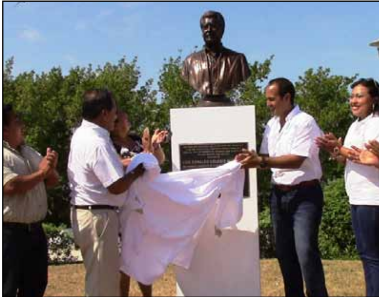
En el marco de un sentido y emotivo homenaje a Luis Donaldo Colosio Murrieta con motivo de su XXI aniversario luctuoso, se develó un busto en su recuerdo y memoria.

“En Isla Mujeres tenemos motivos para recordar a Luis Do-