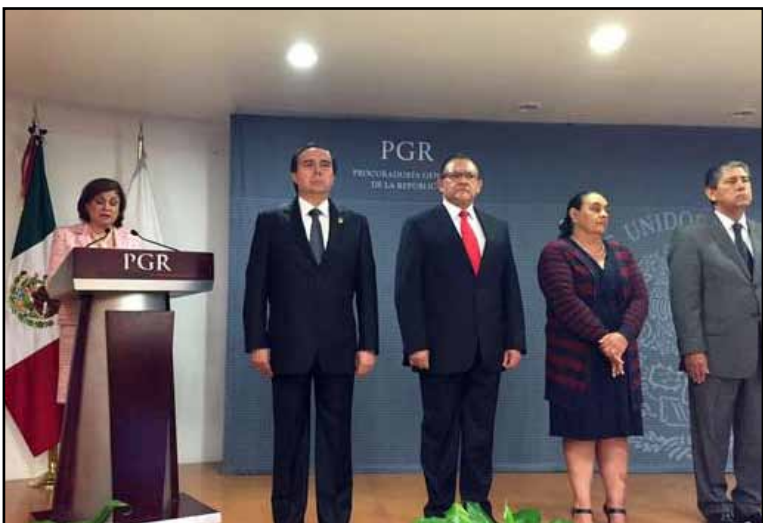
Con un llamado a trabajar por una mejor procuración de justicia, con una atención más efectiva a las víctimas del delito y transparencia, la procuradora general de la República, Aurely Gómez González, tomó protesta a tres nuevos subprocuradores de la dependencia.

MÉXICO, 23 de marzo.— Con un llamado a trabajar por una mejor procuración de justicia, con una atención más efectiva a las víctimas del delito y transparencia, la procuradora general de la República, Aurely Gómez González, tomó la protesta a tres nuevos subprocuradores de la dependencia.