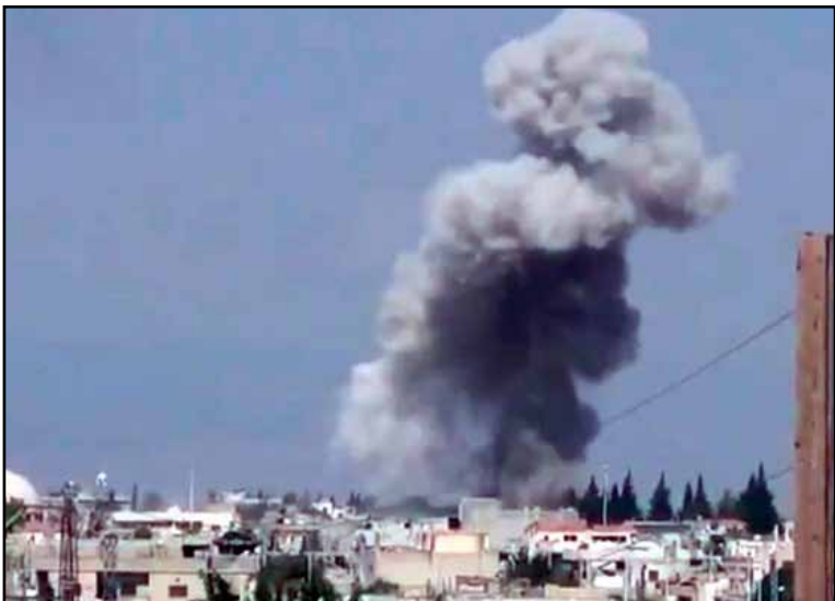
Rebeldes sirios dispararon proyectiles de mortero a la hora de mayor tráfico, contra zonas controladas por el gobierno en la norteña ciudad de Alepo, con un saldo de 13 muertos y decenas de heridos.

DAMASCO, 23 de marzo. — Rebeldes sirios dispararon proyectiles de mortero el lunes, a la hora de mayor tráfico, contra zonas controladas por el gobierno en la norteña ciudad de Alepo, con un saldo de 13 muertos y decenas de heridos, informaron la televisión estatal y un grupo de activistas.