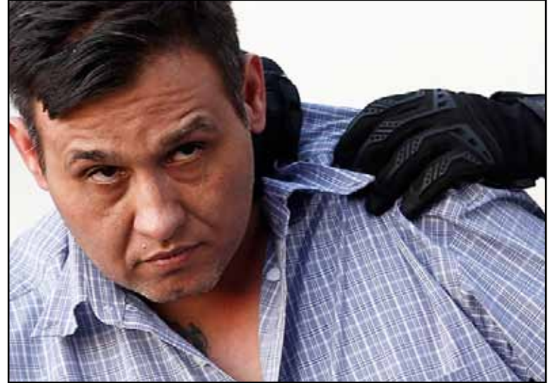
El Ministerio Público Federal de la SEIDO consignó al líder de Los Zetas como presunto responsable de los delitos de portación de arma de fuego de uso exclusivo del Ejército y el de operaciones con recursos de procedencia ilícita.