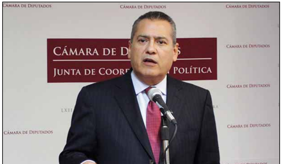
La iniciativa de la Ley General del Agua asegura el uso eficiente de los recursos hídricos con criterios de sustentabilidad, equidad y suficiencia, además de que une los esfuerzos de gobierno y sociedad, lo que de ninguna manera significa privatizar el agua, aseguró Manlio Fabio Beltrones Rivera.

MÉXICO, 8 de marzo.— La iniciativa de la Ley General del Agua asegura el uso eficiente de los recursos hídricos con criterios de sustentabilidad, equidad y suficiencia, además de que une los esfuerzos de gobierno y sociedad, lo que de ninguna manera significa privatizar el agua, aseguró Manlio Fabio Beltrones Rivera.