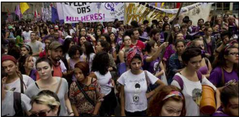
Cerca de tres mil personas mujeres la mayoría, bloquearon una de las avenidas del corazón financiero de Sao Paulo para reivindicar un Estado laico, la legalización del aborto, el fin de la violencia contra las mujeres y la igualdad de salarios.

SAO PAULO, 8 de marzo.— Cerca de tres mil personas, según la Policía, mujeres la mayoría, bloquearon el domingo una de las avenidas del corazón financiero de Sao Paulo para reivindicar un Estado laico, la legalización del aborto, el fin de la violencia contra las mujeres y la igualdad de salarios.