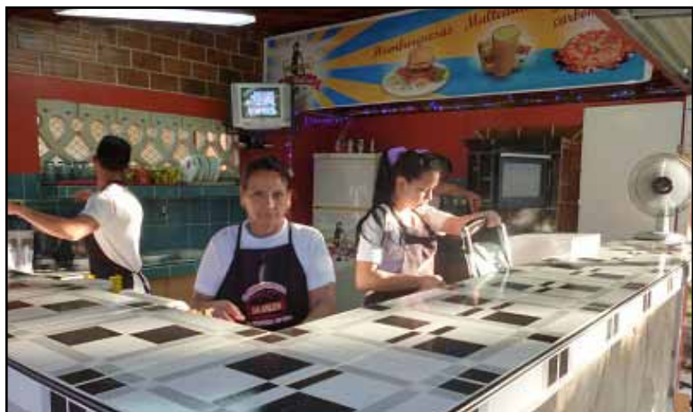
Vista interior de La Baliza.

Es una pregunta difícil de responder, sólo un par de cosas no definen el éxito. Los clientes reconocen nuestro esfuerzo, los que conocen La Baliza la re-