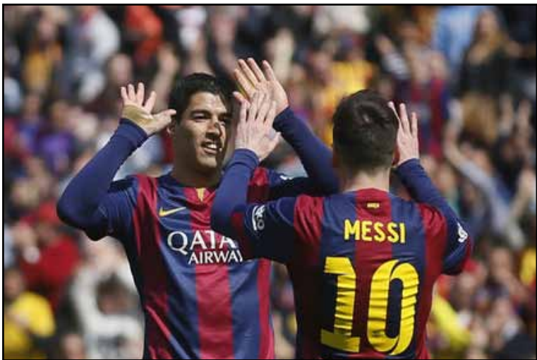
El Rayo Vallecano se plantó valientemente sobre el campo pero Barcelona no tuvo piedad y lo goleó 6-1.

BARCELONA, 8 de marzo.— Luis Enrique ya lo advirtió en la víspera: el Rayo es un equipo con personalidad y jamás te engaña. Va a buscarte arriba desde el primer minuto y a disputarte la posesión del balón.