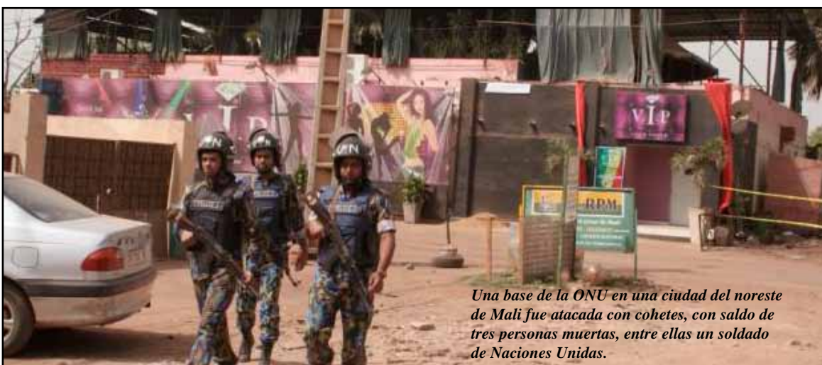
Una base de la ONU en una ciudad del noreste de Mali fue atacada con cohetes, con saldo de tres personas muertas, entre ellas un soldado de Naciones Unidas.

Los investigadores no dijeron para quién supuestamente trabajaban los hombres detenidos. El juez que presidió la audiencia explicó que los investigadores aún buscaban a otras personas que creían estaban involucradas en la muerte de Nemtsov.