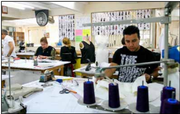
El organismo privado señala que mientras los ingresos se reducen, el gasto crece significativamente, lo cual implica la necesidad de mayores recursos para financiar el faltante.

Es fundamental la instrumentación del presupuesto base cero, que se refleje en una eficiente asignación de los recursos públicos, libre de corrupción e impunidad, que ha sido un factor importante en la mala canalización de los recursos, señala.