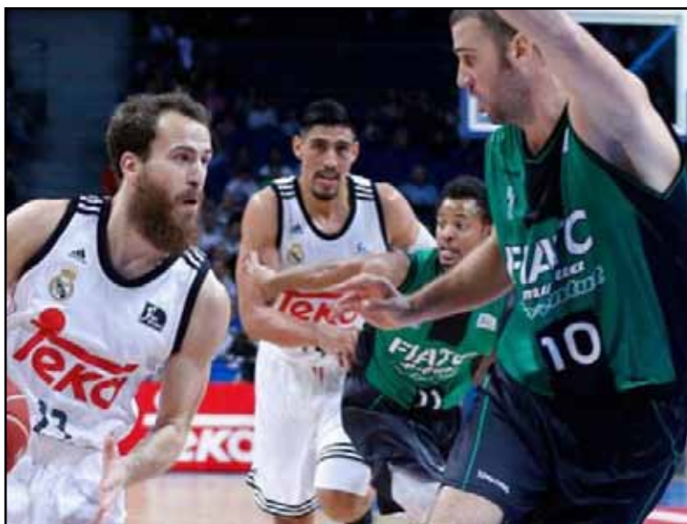
Real Madrid (19-4) revirtió una desventaja de 13 puntos al medio tiempo para ganar 81-80 a Fiatc Joventut (15-8) en la Liga Endesa.

"El Títán", junto al capitán Felipe Reyes, recuperaron sensaciones y volvieron a