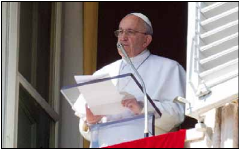
El papa Francisco dedicó un saludo especial a las mujeres, al recordar que este 8 de marzo se celebra su fiesta, y aseguró que marginarlas convierte al mundo en estéril.

CIUDAD DEL VATICANO, 8 de marzo.— El papa Francisco dedicó un saludo especial a las mujeres, al recordar que este 8 de marzo se celebra su fiesta, y aseguró que marginarlas convierte al mundo en estéril.