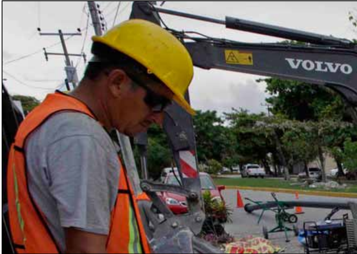
Con una inversión de 17.3 millones de pesos arrancaron las obras de rehabilitación de la red de agua potable de la parte antigua de Cancún, en las Supermanzanas 22 y 23 de esta ciudad, en beneficio de sus más de 3 mil habitantes.

El gobernador detalló que en esos trabajos se invirtieron 34.66 millones de pesos, para el cambio de 22 mil 800 metros de tuberías