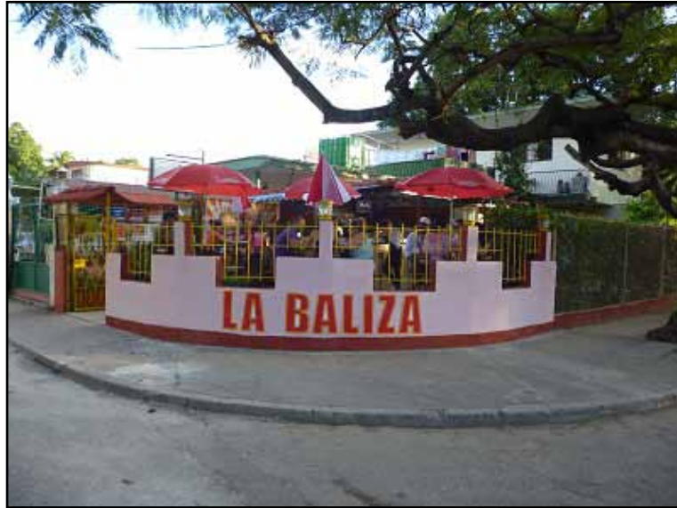
La cafetería La Baliza brinda servicio en el barrio conocido como Alturas de la Coronela, en La Habana.

Hoy podemos encontrar cafeterías y restaurantes para diferentes gustos y bolsillos, grupos que se insertan en el mundo de la informática desarrollando programas y otras prestaciones, relojeros y reparadores de celulares, pequeños talleres de reparación de equipos eléctricos y electrónicos, productores de elementos para la construcción, choferes de taxis colectivos que alivian la escasez de transporte público y, por no dejar de existir oportunidades, hasta vendedores de libros de uso o encargados de baños públicos. La cifra del total de trabajadores