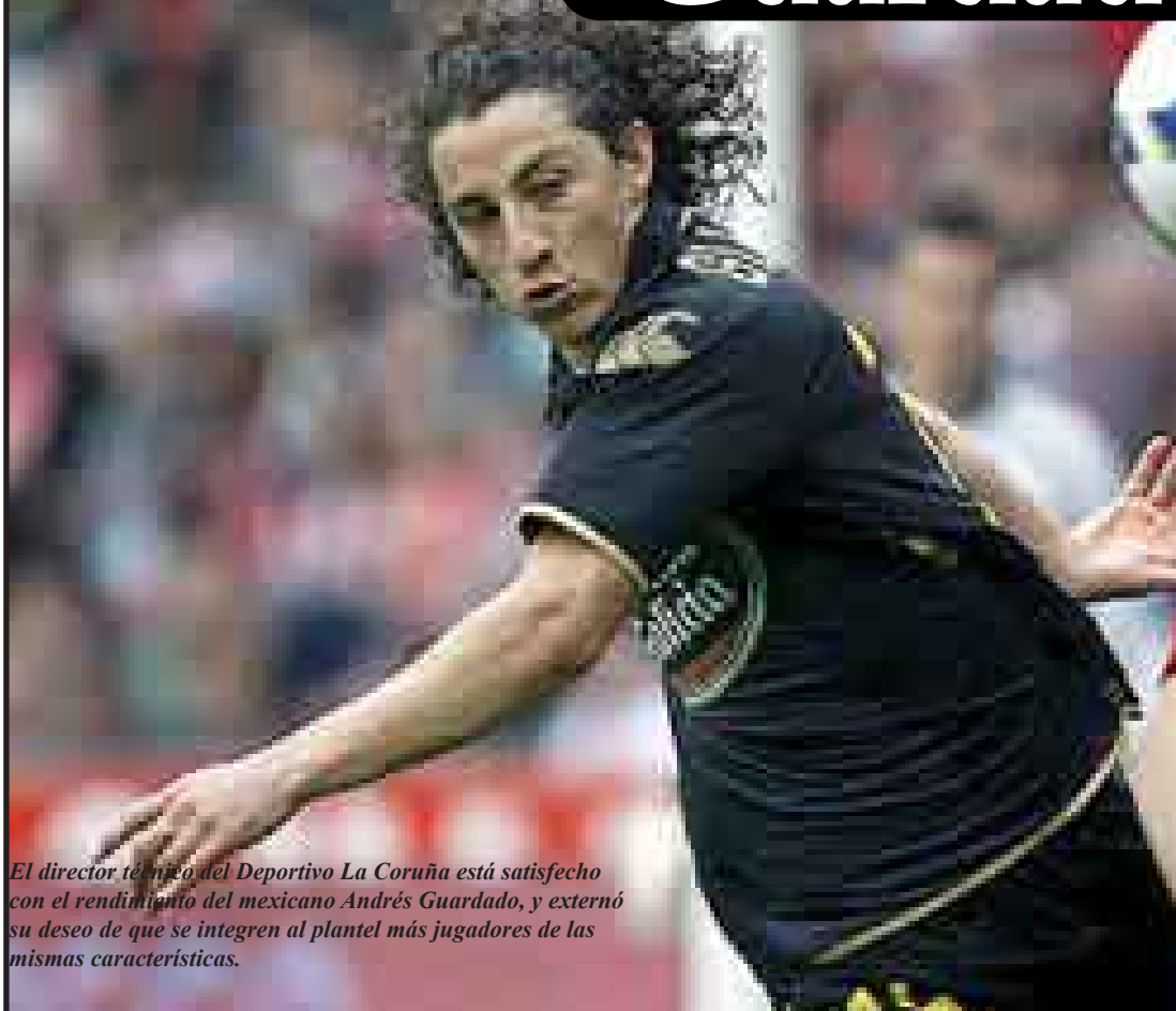
El director técnico del Deportivo La Coruña está satisfecho con el rendimiento del mexicano Andrés Guardado, y externó su deseo de que se integren al plantel más jugadores de las mismas características.

LA CORUÑA, 24 de febrero.- El director técnico de Deportivo La Coruña, Miguel Ángel Lotina, externó su deseo de que se pueda encontrar a más jugadores de las características del mediocampista mexicano Andrés Guardado, quien provocó ilusión entre los aficionados desde su llegada al club en 2007.