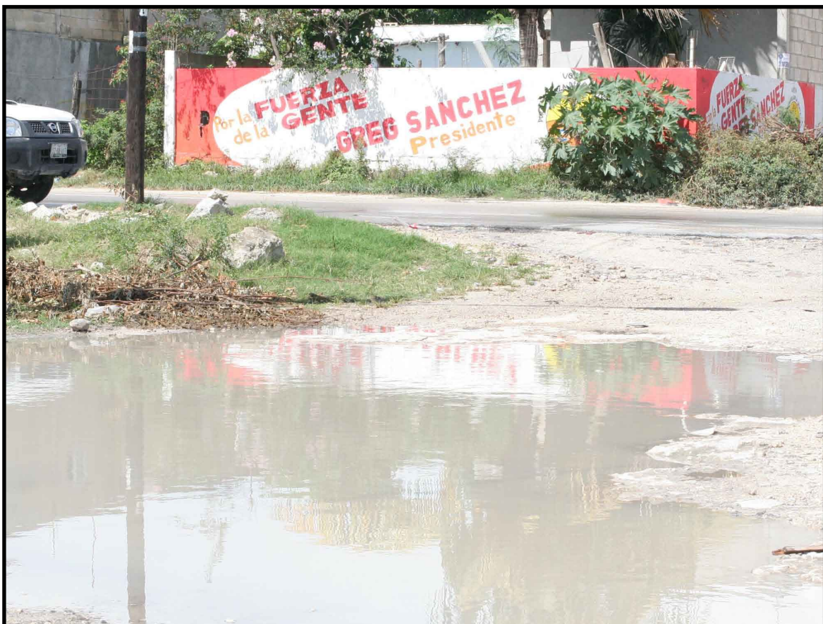
La realidad en las regiones dista mucho de lo que pregona el alcalde.