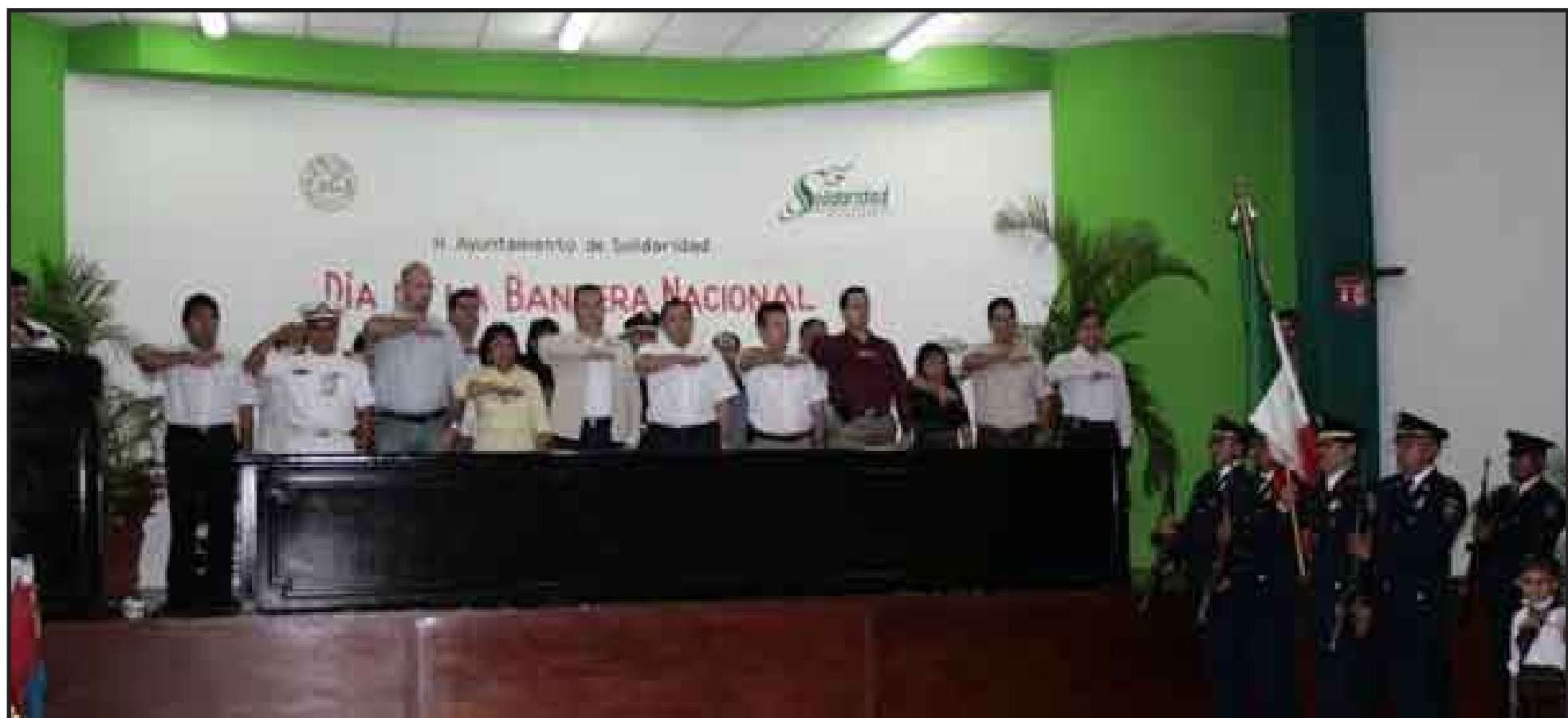
Román Quian Alcocer tomó protesta a escoltas de nueve escuelas de Solidaridad, con el fin de fomentar en los estudiantes el respeto a los símbolos patrios.

PLAYA DEL CARMEN. — En el marco del Día de la Bandera, el presidente municipal, Román Quian Alcocer, tomó protesta a las escoltas de nueve escuelas de Solidaridad, con el fin de fomentar en los estudiantes, el respeto a los símbolos patrios.