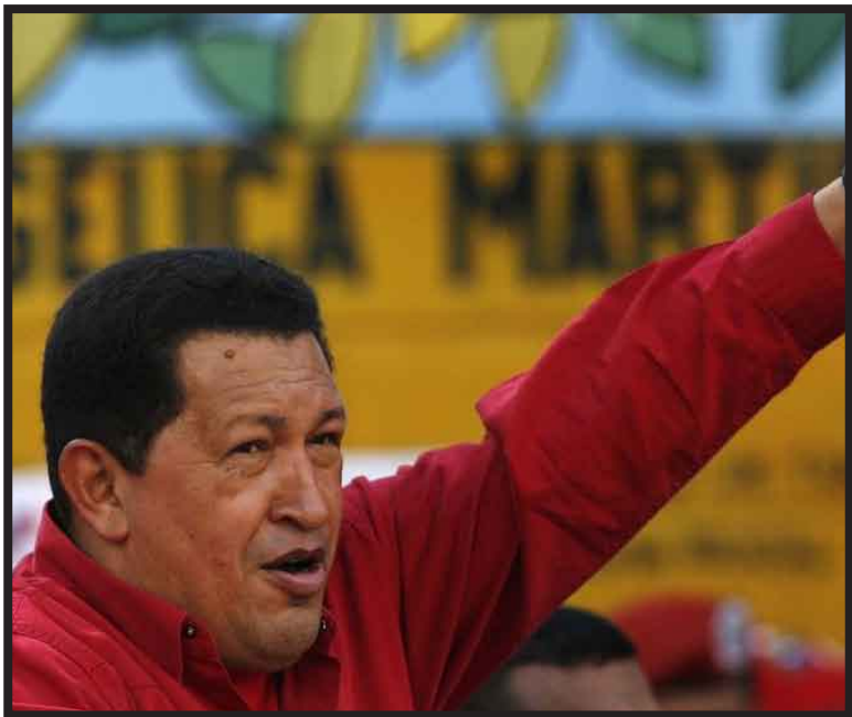
Hugo Chávez respaldaría una eventual decisión de los países centroamericanos sobre el reconocimiento del presidente hondureño, Porfirio Lobo, si se permite el retorno del ex mandatario Manuel Zelaya y se le restituyen sus derechos políticos.

CARACAS, 24 de febrero.-- El presidente Hugo Chávez afirmó que está dispuesto a respaldar una eventual decisión de los países centroamericanos sobre el reconocimiento del gobernante hondureño, Porfirio Lobo, si se permite el retorno a su país del ex mandatario Manuel Zelaya y se le restituyen sus derechos políticos. Chávez dijo ayer a la cadena CNN en Español que "estoy dispuesto a apoyar" la decisión del Sistema de Integración Centroamericana (SICA) sobre el nuevo gobierno hondureño si "Zelaya recupera sus derechos políticos, ingresa al Parlamento Centroamericano y vuelve a hacer vida política en su país". El mandatario venezolano indicó, en entrevista con la cadena