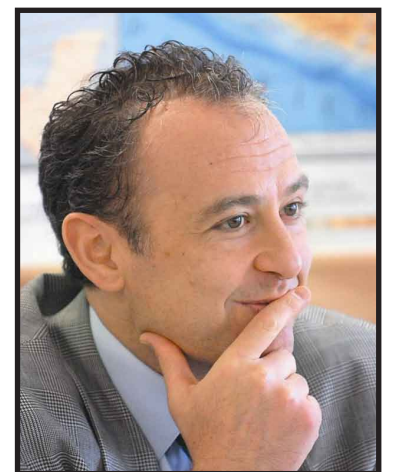
El embajador de México en Washington, Arturo Sarukhan, rechazó que, como parte de la lucha antidrogas, existan planes para que agentes estadounidenses operen en territorio mexicano 'incrustados' en fuerzas mexicanas.

¿PROBLEMAS DE ALCOHOLISMO O DEPENDENCIA A LAS DROGAS?