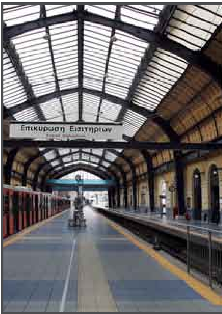
Los sindicatos de Grecia hicieron una demostración de fuerza con una huelga general, secundada por un 80 por ciento de los empleados del sector público y privado, en protesta por las medidas anticrisis anunciadas por el Gobierno socialista.

ATENAS, 24 de febrero.-- Los sindicatos de Grecia hicieron este miércoles una demostración de fuerza con una huelga general, secundada por un 80 por ciento de los empleados del sector público y privado, en protesta por las medidas anticrisis anunciadas por el Gobierno socialista. El paro laboral de más de un millón de empleados paralizó el país durante gran parte del día, una jornada marcada por grandes protestas y algunos incidentes violentos entre manifestantes y la policía antidisturbios. Unos 150 radicales encapuchados rompieron los cristales de algunas tiendas al paso de una de las manifestaciones y los antidisturbios lanzaron gases lacrimógenos para dispersarlos en el centro de Atenas. Todas las oficinas públicas, hospitales, universidades y gran parte del transporte público urbano no funcionaron hoy en Grecia, mientras que todos los servicios de trenes y aviones fueron suspendidos hasta las 06.00 hora local (04.00 GMT) de mañana. En los hospitales públicos, los médicos sólo atendieron los casos de máxima urgencia, mientras que las cadenas de televisión y las radios no emitieron informativos. Eso sí, en el sector turístico no hubo huelga, al tiempo que algunos supermercados y otras tiendas abrieron hoy sus puertas.