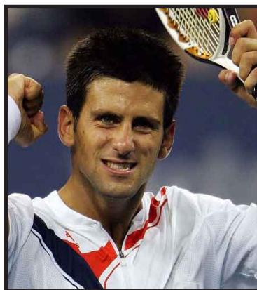
El serbio Novak Djokovic remontó el partido contra su compatriota Viktor Troicki para vencerlo 3-6, 6-4, 6-2 en el inicio de su defensa del título del torneo en los Emiratos Árabes Unidos.

va mucho más rápido y ni bien la sombra llegó a la cancha, sentí que controlaba mejor mi juego". El cuarto preclasificado ruso Nikolay Davydenko se retiró por una lesión de muñeca tras perder el primer set 6-3 ante el alemán Michael Berrer. Davydenko se había lastimado en la semifinal de Rotterdam hace dos semanas. El croata Marin Cilic se recuperó tras ir 6-3 abajo en el desempate para vencer al austriaco Stefan Koubek 6-2, 7-6 (6) y llevar su récord de esta temporada a 17-1, el mejor en la ATP. Cilic enfrentará a otro austriaco en cuartos de final, gracias a la victoria de Jurgen Melzer 6-3, 7-5 sobre el español Tommy Robredo.