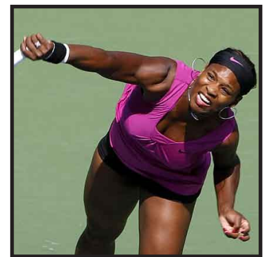
La tenista estadounidense, Serena Williams, primera en la clasificación femenina mundial, inauguró en Kenia una escuela secundaria que llevará su nombre.