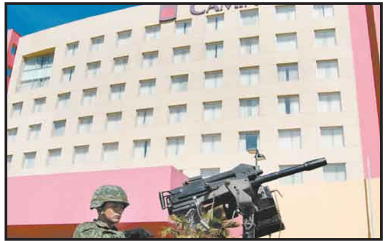
De acuerdo al diario The Washington Post, el gobierno de Estados Unidos planea integrar agentes de inteligencia para reforzar el combate a los cárteles del narcotráfico en la frontera.

El periódico destaca que este esquema de cooperación no requiere de aprobación del Congreso.