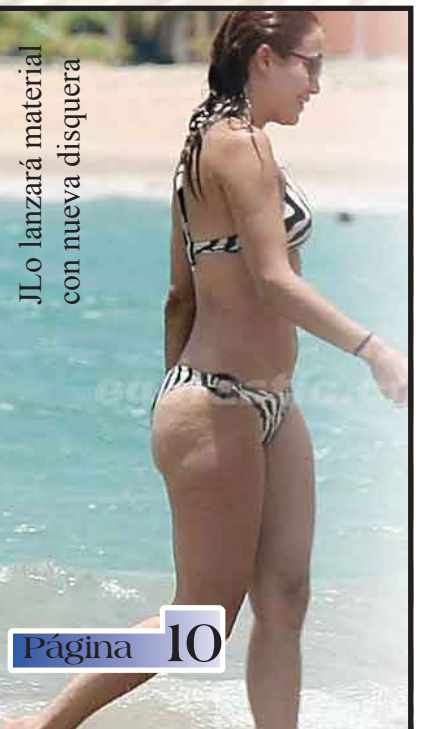
JLo lanzará material con nueva disquera