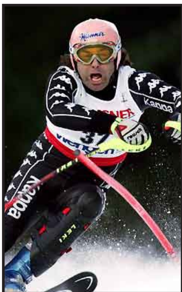
El mexicano Hubertus Von Hohenlohe, único representante nacional en los Juegos Olímpicos de Invierno, terminó en el lugar 78 del slalom gigante.

VANCOUVER, 23 de febrero.- El esquiador mexicano Hubertus von Hohenlohe finalizó este martes en el puesto 78 de la prueba de slalom gigante de esquí alpino, que se efectuó en el circuito de Whistler, dentro de los Juegos Olímpicos de Invierno Vancouver 2010. A sus 51 años de edad y en sus quintos Juegos Olímpicos de Invierno, Von Hohenlohe quedó en el antepenúltimo sitio de los que lograron concluir el trayecto, pues los 22 esquiadores restantes fueron descalificados o no lograron completar alguna de sus dos rondas. En esta ocasión, el veterano esquiador fue más rápido en su primer descenso, al completar el trayecto en un minuto, 34 segundos y 50 centésimas, mientras que en su segunda oportunidad registró 1:36.97 para tener un acumulado de 3:11.47 minutos.