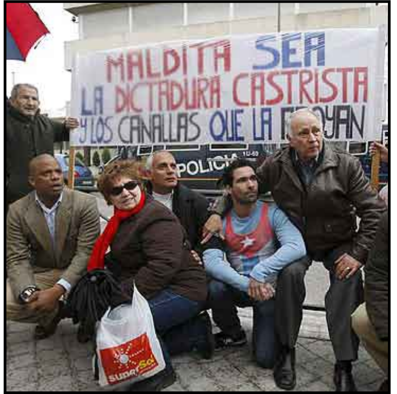
Un grupo de cubanos se manifestó en la Embajada de Cuba en Madrid por la muerte del disidente Orlando Zapata.

fue trasladado desde un centro médico para reclusos tras pasar 85 días en huelga de hambre. De acuerdo con fuentes opositoras, el fallecido exigía ser tratado como "prisionero de conciencia", condición que le reconoció Amnistía Internacional (AI). El presidente cubano, Raúl Castro, afirmó que su Gobierno está dispuesto a dialogar con Estados Unidos, pero en condiciones de igualdad, durante una visita que hizo al puerto de Mariel con su homólogo Luiz Inácio Lula da Silva.