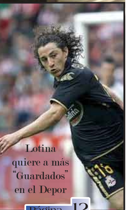
Lotina quiere a más "Guardados" en el Depor