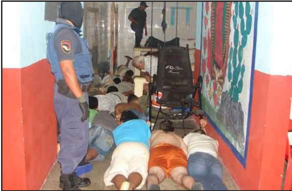
La revisión en horas de la madrugada fue celda por celda, con la intervención de elementos de la Dirección General de Seguridad Pública de Solidaridad, de la PGR y del Ministerio Público Federal.

Durante el operativo se revisó a cada uno de los presos, así como cel-