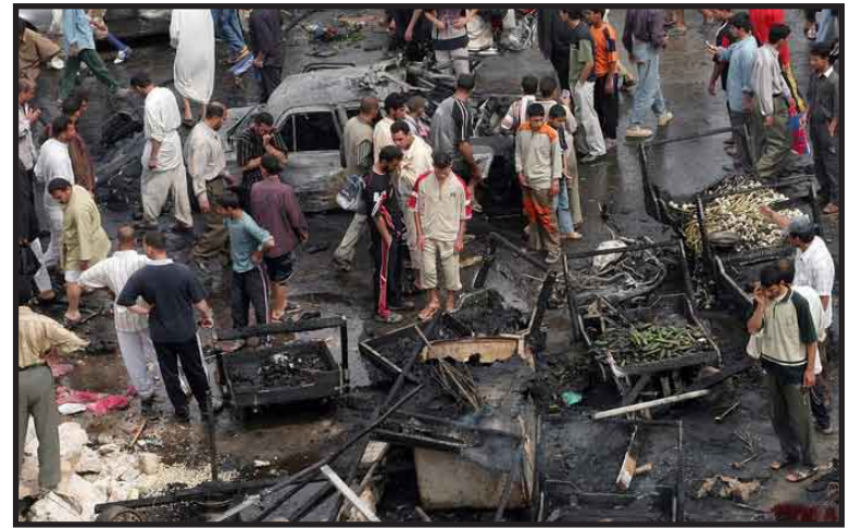
Una atacante suicida mató al menos a 54 personas e hirió a unas 117, al detonar un cinturón con explosivos en medio de una peregrinación de musulmanes chiíes en Bagdad.

Había peregrinos "en el suelo, cubiertos de sangre y gritando por ayuda", dijo. "Había banderas ensangrentadas en todas partes".