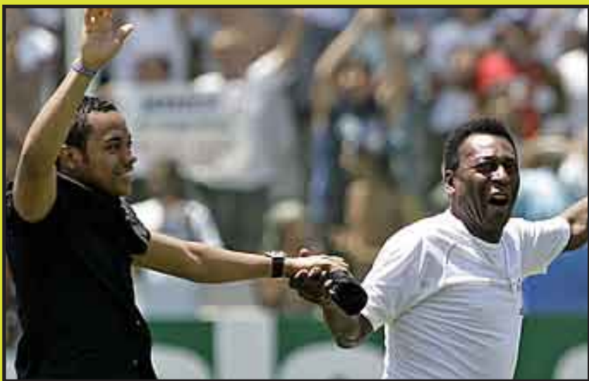
Acompañado de Pelé, el astro brasileño regresó al equipo que lo dio a conocer al mundo.

SAO PAULO, 1 de febrero.-- Robinho bajó de un helicóptero junto al astro brasileño Pelé el lunes en su presentación como nueva figura del Santos, que espera revivir sus mejores tiempos cuando se proclamó campeón con el habilidoso atacante en 2002 y 2004.