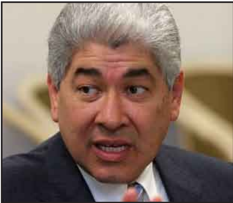
Francisco Ramírez Acuña pidió a los legisladores trabajar con el mayor esfuerzo y rapidez posible, antes de que las elecciones estatales de este 2010 contaminen la agenda nacional.

Ramírez Acuña refirió que hoy más que las posiciones partidistas tienen frente a ellos el juicio de los ciudadanos sobre el trabajo que desempeñen en este segundo periodo por lo que enfatizó que deberán ser responsables en atender lo que la gente han expresado en la calle.