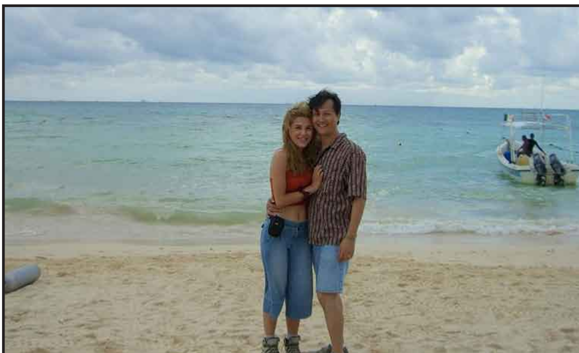
Este destino turístico está colocado en un sitio de privilegio para las parejas románticas, de acuerdo al sitio de Internet líder en la planeación de viajes, Away.com.

ticos seleccionados y propuestos para los lectores de Away.com son: Bermuda, Paris (Francia) Kauai (Hawaii); Nueva Orleans (Luisiana); Riviera Maya (México); Bali (Indonesia); Venecia (Italia), Vancouvert (Canadá); Fiji (Australia) y Miami (Florida).