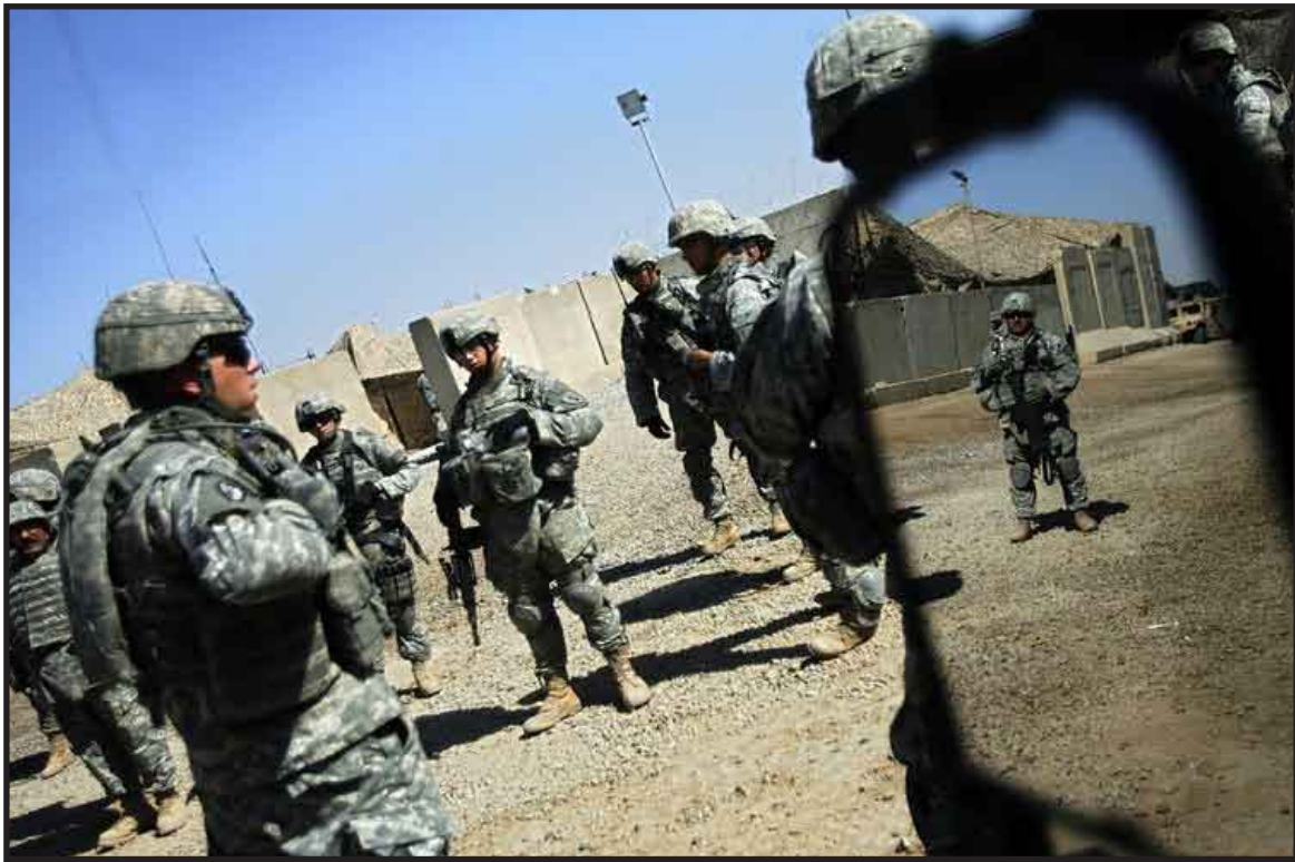
El presidente de Estados Unidos, Barack Obama, pidió al Congreso 159 mil 300 millones de dólares para operaciones militares en Irak, Afganistán y Pakistán.

La asistencia para el desarrollo se incrementará en un 18 por ciento a dos mil 900 millones de dólares, en tanto que los fondos para bancos multilaterales de desarrollo aumentarán a casi tres mil millones de dólares.