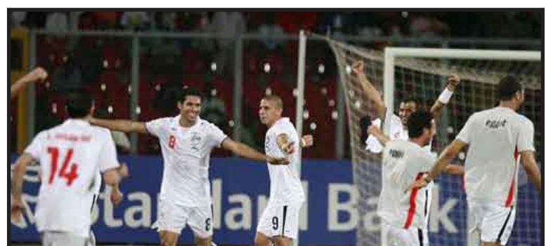
El presidente egipcio, Hosni Mubarak, recibió a la selección de fútbol para felicitarle por la victoria ante Ghana, en la final de la Copa de África de Naciones.

Durante el vuelo de vuelta de Angola, los jugadores, que llevaron la bandera de Egipto, cantaron e intercambiaron las felicitaciones por la copa, la séptima continental para los faraones y la tercera consecutiva.