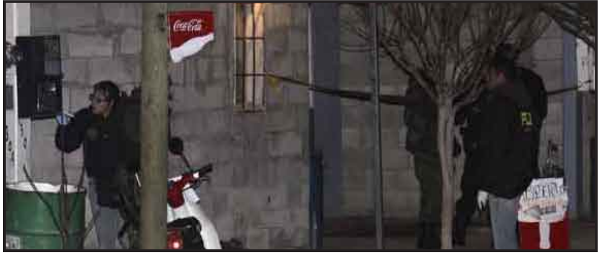
El número de fallecidos, por el ataque a un grupo de estudiantes, el pasado sábado en esta frontera, se elevó a 16.

Coincidimos, dijo, en la necesidad de aprovechar al máximo el Acuerdo de Asociación Económica para favorecer la recuperación de flujos comerciales y de inversión, que se habían afectado por la crisis económica internacional.