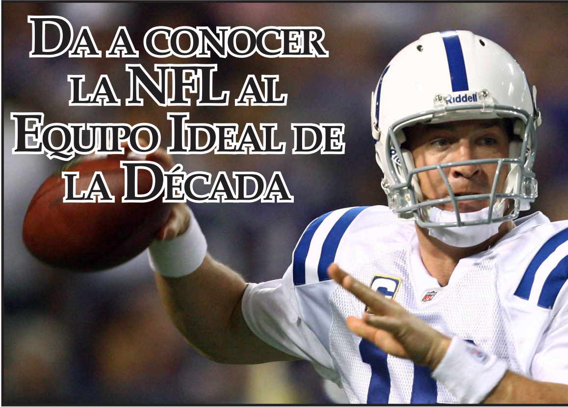
Peyton Manning fue elegido como miembro del Equipo Ideal de la Década de la Liga Nacional de Fútbol Americano (NFL).

MIAMI, Estados Unidos, Feb. 1, 2010.- La elección de los mariscales Peyton Manning y Tom Brady junto a los legendarios Willie Roaf, Larry Allen y Warren Sapp como nuevos miembros del Equipo Ideal de la Década de la Liga Nacional de Fútbol Americano (NFL). Antes que se iniciase el partido de Pro Bowl, donde se dieron cita los mejores de la temporada, la NFL dio a conocer la lista de los 53 seleccionados como las figuras destacadas