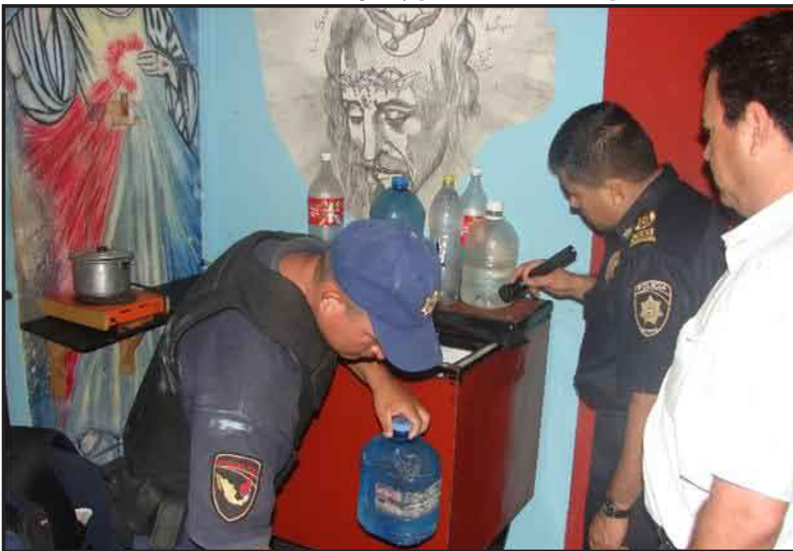
La revisión en horas de la madrugada fue celda por celda, con la intervención de elementos de la Dirección General de Seguridad Pública de Solidaridad, de la PGR y del Ministerio Público Federal.