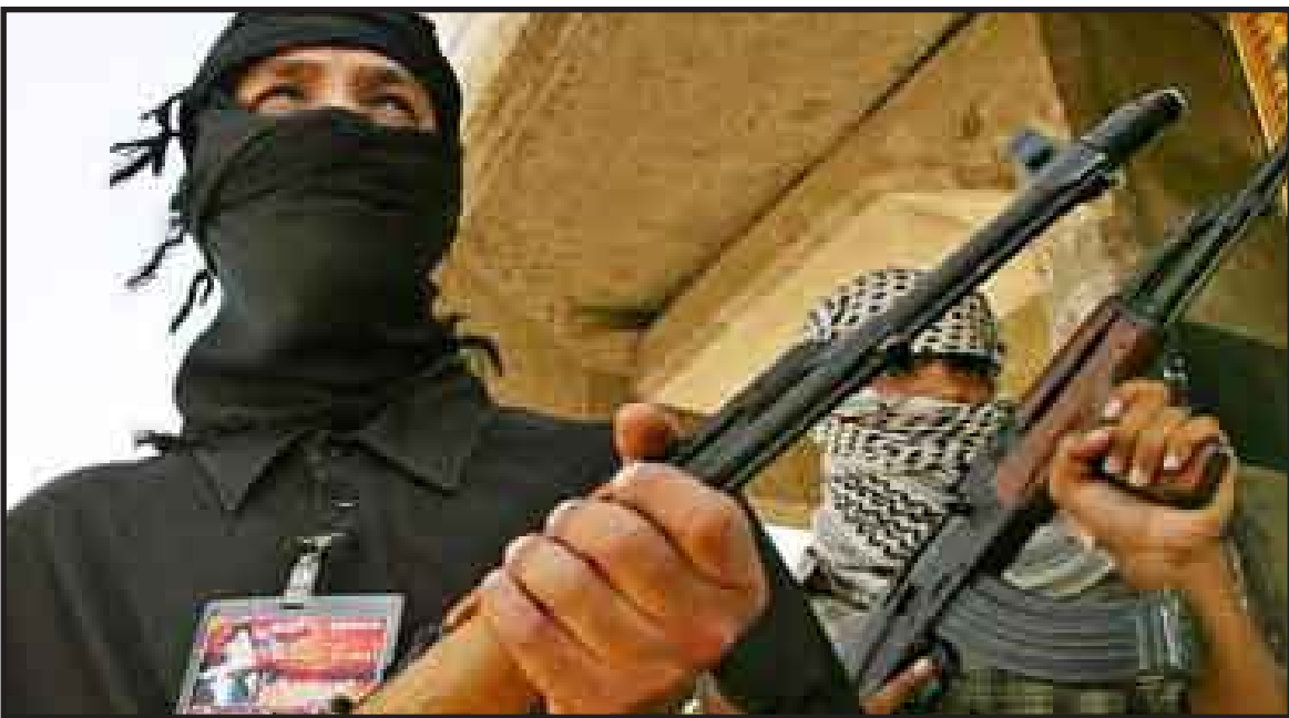
El grupo terrorista Al Qaeda en el Magreb Islámico (AQMI) prometió vengar la muerte de cientos de musulmanes a manos de cristianos en los enfrentamientos sectarios que tuvieron lugar hace dos semanas en el norte de Nigeria.