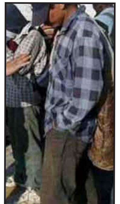
Autoridades estadounidenses continúan investigando una casa de seguridad en Los Angeles, en donde encontraron a 14 inmigrantes indocumentados aparentemente retenidos contra su voluntad.

Virginia Kice, vocera de ICE, indicó que los traficantes aparentemente estaban pidiendo más dinero a los familiares antes de dejarlos en libertad o antes de transportarlos a otras ciudades en el país.