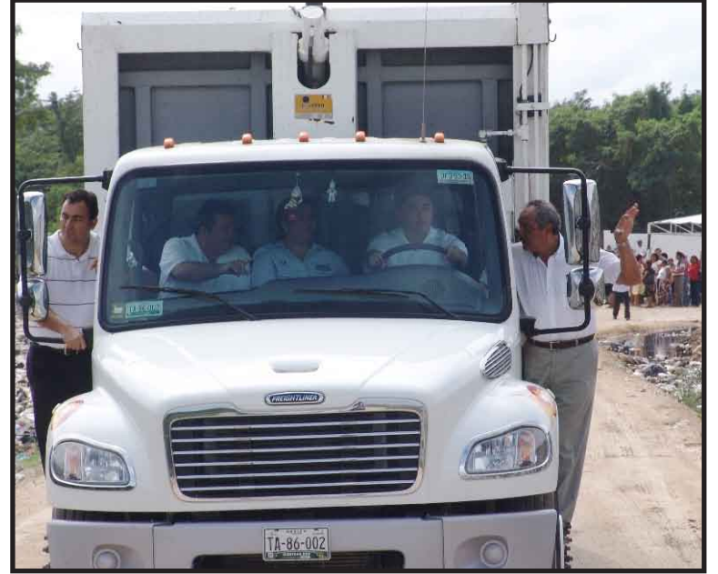
El nuevo relleno tendrá capacidad para recibir más de 380 toneladas diarias de desechos sólidos en la capital del estado.