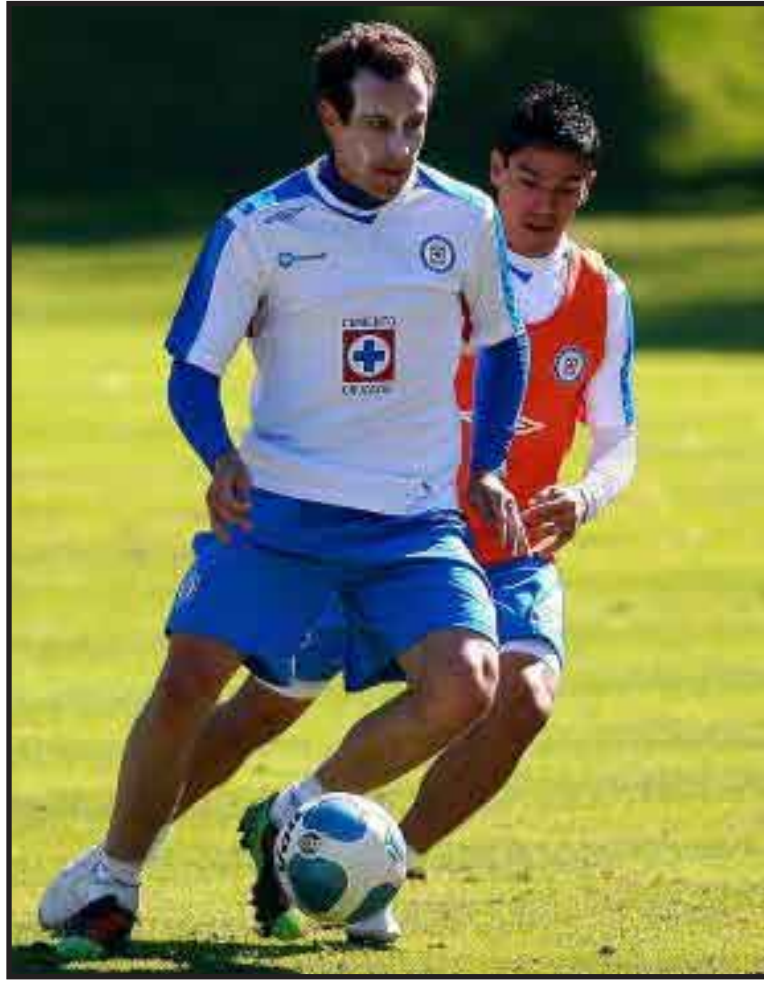
Pumas buscará sacudirse la hegemonía que Cruz Azul ha ejercido sobre ellos en sus últimos cotejos, cuando se enfrenten dentro de la segunda fecha del torneo

Tigres es 15to ente 18 equipos en la tabla de porcentajes que define al equipo que pierde la categoría. Sólo Atlas, Querétaro y Ciudad Juárez están abajo de ellos.