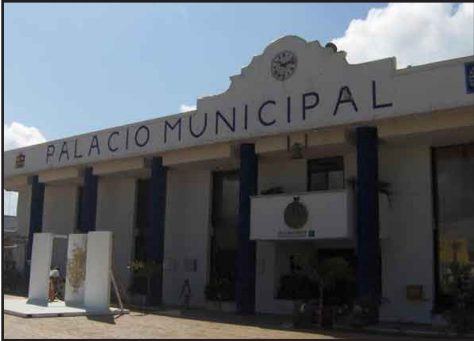
Se busca conocer los parámetros bajo los cuales laboran mujeres y hombres del Ayuntamiento isleño, con el fin de mejorar el ambiente de trabajo.

instalará un buzón de quejas para el personal que desee expresar alguna inconformidad de manera anónima, en relación al ambiente de trabajo en que se desarrolla o si sufre de algún tipo de hostigamiento".