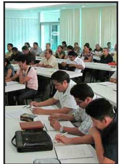
Con la participación de más de 60 representantes de igual número de empresas afiliadas a la Cámara Mexicana de la Industria de la Construcción, inició el curso "Reformas Fiscales 2010 e Impacto Financiero en las Empresas; y Preparación de la Declaración Anual 2009".

Aunque no existen reformas en el Impuesto Empresarial a Tasa Única, se analizará para efectos de comparar el impacto financiero entre el ISR y el IETU.