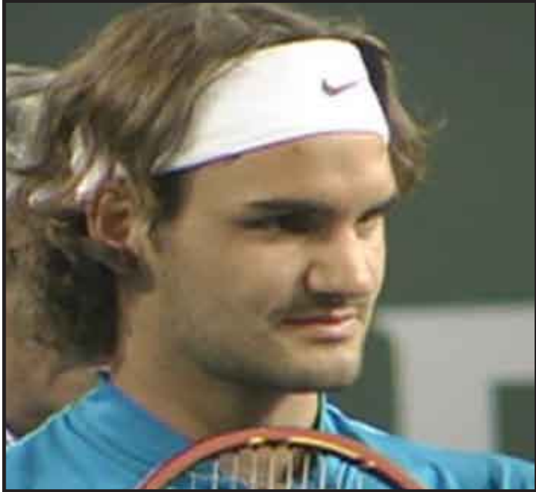
El primer cabeza de serie Roger Federer ganó el jueves su match de la segunda ronda en el Abierto de Australia, eliminando 6-2, 6-3, 6-2 al rumano Victor Hanescu.

MELBOURNE, 21 de enero.-- El primer cabeza de serie Roger