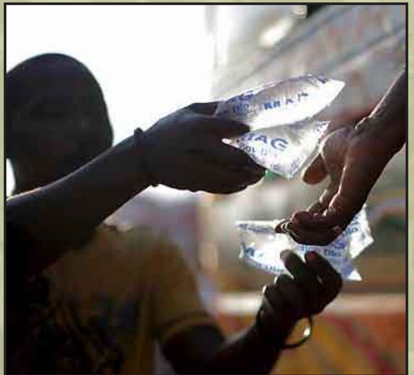
El Banco Mundial respalda el perdón de toda la deuda de Haití, que asciende a unos 890 millones de dólares, y estudia condonar su parte para ayudar al país a recuperarse.

Desde 2005, el Banco Mundial ha donado 363 millones de dólares a Haití y le ha dedicado otros 100 millones en respuesta al terremoto.