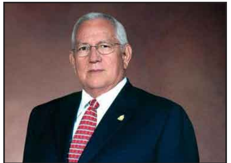
Roberto Micheletti abandonó el despacho presidencial sin renunciar al cargo para dar espacio al mandatario electo Porfirio Lobo, que asumirá el 27 de enero.

Dijo que “en el momento en que Lobo asuma, estaré en una misa. De allí me trasladaré a mi pueblo natal” de El Progreso, a unos 170 kilómetros al norte de la capital. “Retornaré si las circunstancias lo ameritan y la patria lo exija”, advirtió.