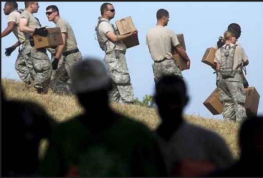
El presidente de Haití rechazó que su país esté bajo tutela de Estados Unidos y justificó el control que mantiene sobre el Palacio Presidencial y el aeropuerto a su misión de ayuda.

Préval también rechazó las versiones de algunos medios extranjeros de que cedió a Estados Unidos el control de Haití a través de un ‘acuerdo secreto’ que firmó con la secretaria de Estado estadounidense, Hillary Clinton, durante su visita del 16 de enero pasado.