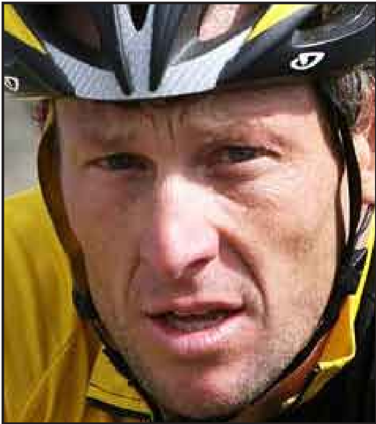
Lance Armstrong culminó el caluroso día en el puesto 30 y 26to en la clasificación general del Tour Down Under.

ADELAIDA, 21 de enero.-- El portugués Manuel Cardoso ganó este jueves la tercera etapa del Tour Down Under, mientras que Lance Armstrong culminó el caluroso día en el puesto 30 y 26to en