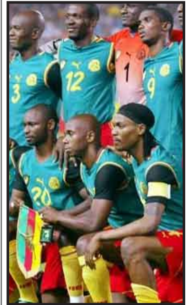
Camerún se clasificó a los cuartos de final de la Copa Africana, con un empate 2-2 contra Túnez y Zambia y con un triunfo 2-1 sobre Gabón.