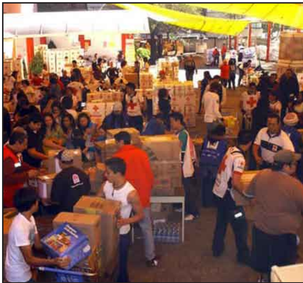
A menos de 48 horas de cerrar la colecta, la Cruz Roja Mexicana ha recibido dos mil 835 toneladas de ayuda humanitaria.

Arce dijo que en esa región también se han vuelto muy populares películas de bajo presupuesto donde se elogia a los jefes del narcotráfico.