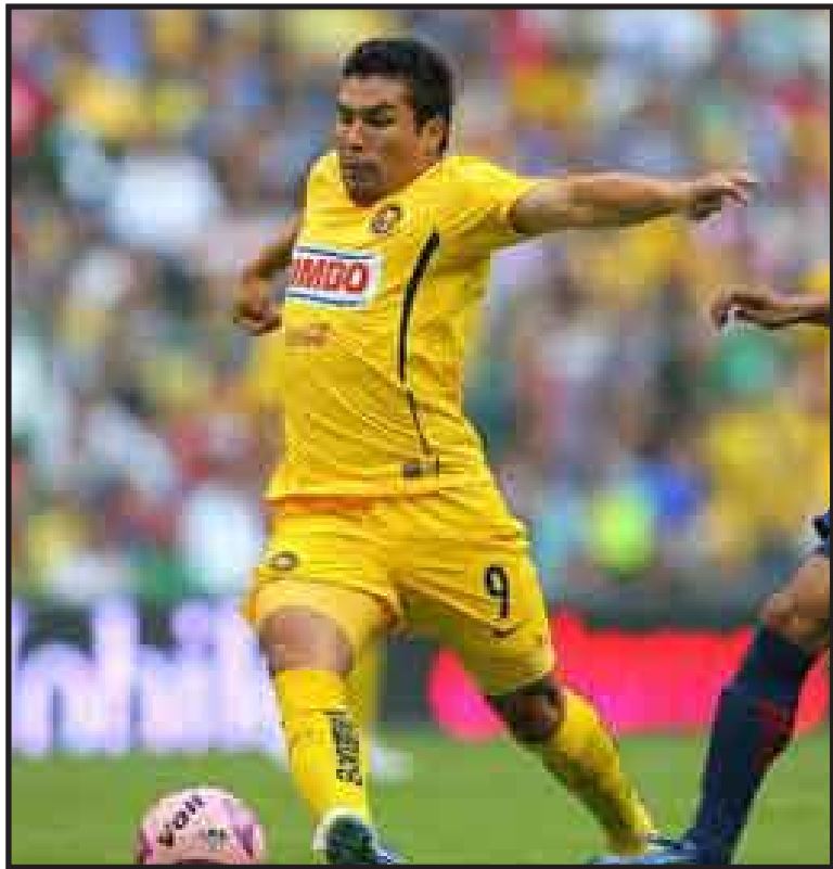
Según IHHS, las Águilas del América se ubican en el lugar 80 del ranking mundial, mientras que Chivas está en el sitio 107.

El ranking, fijado cada 31 de diciembre, tiene en cuenta los 50 mejores conjuntos de cada año y otorga 50 puntos al primero de la lista descendiendo hasta 1 punto al clasificado en quincuagésimo lugar.