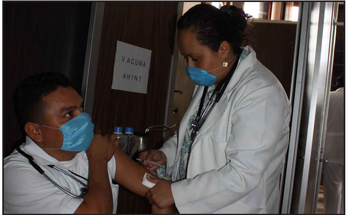
La Secretaría Estatal de Salud abrió la vacunación a los siguientes grupos vulnerables, para esta segunda etapa se cuenta con un total de 36 mil dosis para su aplicación inmediata en todos los centros de salud y hospitales de la Sesa.

El funcionario recordó también que hay que evitar la automedicación y que se debe acudir al médico al sentir los primeros síntomas, así como no asistir a las escuelas ni a centros laborales en caso de presentar algún síntoma de Influenza.