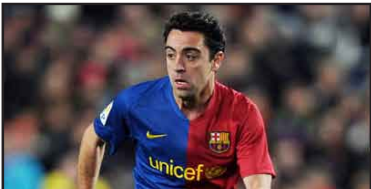
El mediocampista del Barcelona se impuso en la clasificación por un solo voto (164-163) a Lionel Messi.

Entre los 10 primeros clasificados figuran Steven Gerrard (Liverpool, 54 puntos), Cesc Fábregas (Arsenal, 45), Cristiano Ronaldo (Real Madrid, 41), Frank Lampard (Chelsea, 35), Andrea Pirlo (AC Milan, 26) y Juan Sebastian Verón (Estudiantes La Plata, 13). Xavi Hernández, que ya recibió este mismo premio en 2008, recogerá el galardón en Londres el próximo 1 de febrero. Según la IFFHS, el premio lo ha conseguido gracias a "su manera inteligente de jugar".