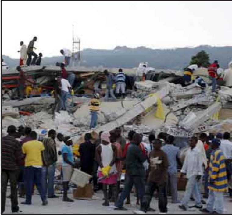
El presidente René Préval reclamó la ayuda urgente de la comunidad internacional para afrontar la "inimaginable" catástrofe sufrida por su país, con el terremoto que ha podido causar miles de muertos.

Préval subrayó que no ha dormido desde que ocurrió el terremoto y que las calles de la capital estuvieron llenas de gente durante la noche por el temor a dormir en sus hogares en caso de que ocurrieran nuevos temblores.