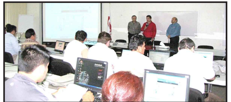
La Cámara Mexicana de la Industria de la Construcción inició el programa de capacitación 2010 con los cursos "Bitácora Electrónica de Obra Pública (BEOP)"; "Reformas Fiscales 2010 e Impacto Financiero en las Empresas y Preparación de la Declaración Anual 2009"; "Concurso de la Obra Pública".