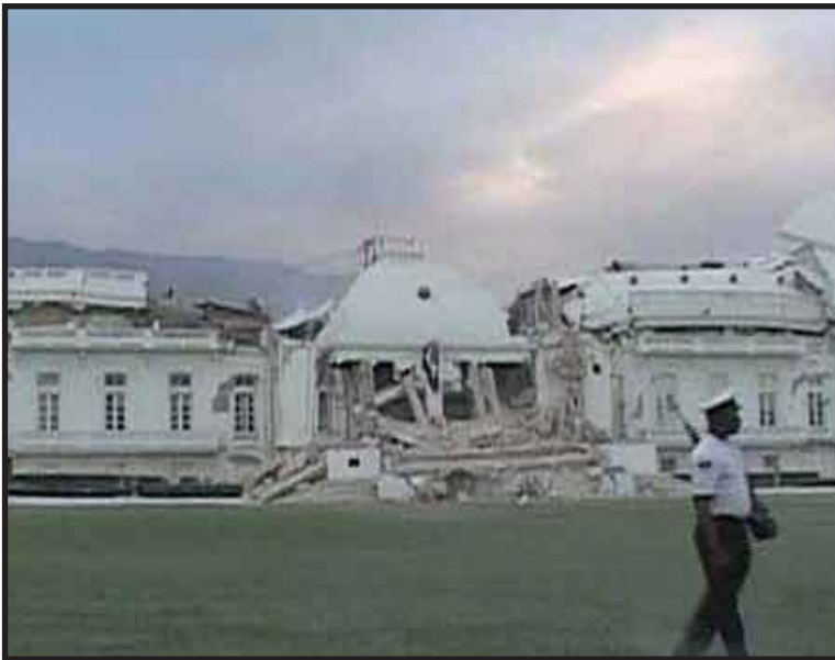
Imagen que muestra el palacio presidencial de Haití tras el terremoto.

MADRID, 13 de enero.-- La comunidad internacional se ha volcado en el envío de ayuda para asistir a Haití en las tareas de rescate y atención a los damnificados tras el devastador terremoto que azotó ayer el país caribeño y que se teme