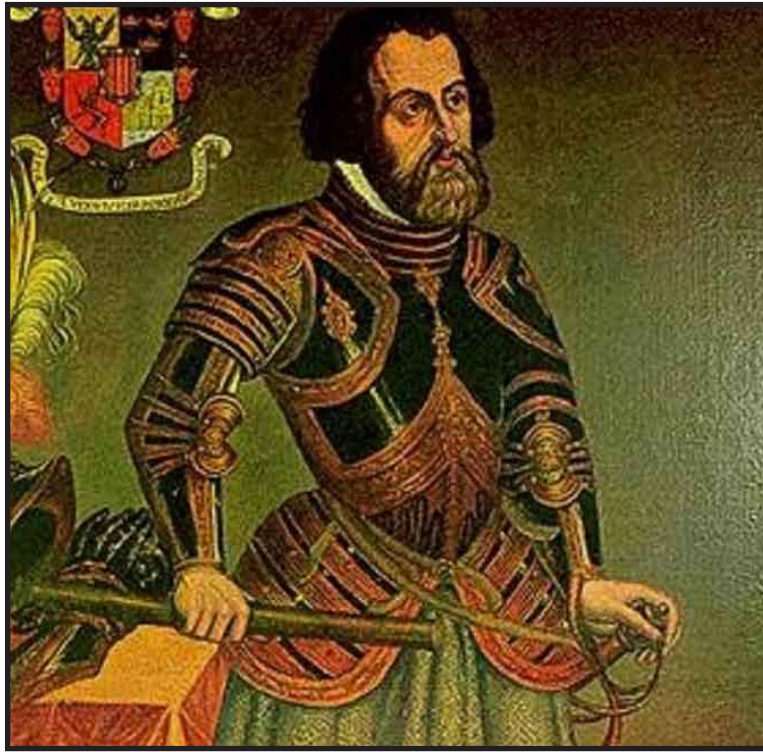
Este viernes ciudadanos inconformes realizarán una marcha para protestar por los cobros excesivos de que son víctimas por parte de la empresa.

A su regreso a Tenochtitlan encontró a los españoles sitiados por los mexicas a causa de la matanza del Templo Mayor. Huyó con sus ejércitos de la ciudad el 30 de junio de 1520 (la Noche Triste). En Tlaxcala ordenó la construcción de 13 bergantines con los que sitió la ciudad durante 75 días, al final de los cuales tomó prisionero a Cuauhtémoc, obteniendo la ren-