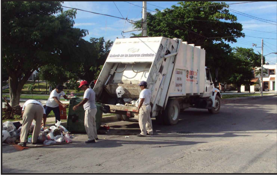
Después de una semana, por fin pasó el camión recolector en una de las céntricas supermanzanas de la ciudad.

CANCUN.- Vecinos de supermanzanas céntricas de Cancún han manifestado