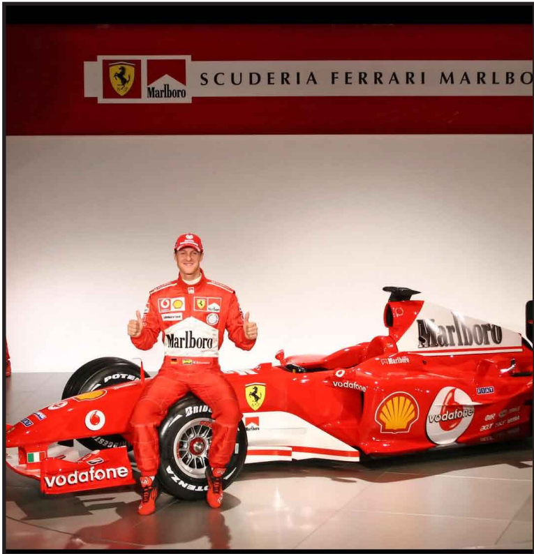
La escudería Ferrari utilizará el regreso de Michael Schumacher a la Fórmula Uno, con el equipo Mercedes, como fuente de motivación esta temporada.

Ferrari viene de una de sus peores campañas en años. El equipo terminó cuarto en el campeonato de constructores y sus pilotos Kimi Raikkonen, Felipe Massa y Giancarlo Fisichella culminaron sexto, 11ro y 15to, respectivamente.