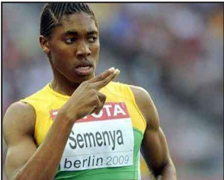
El entrenador de la atleta aseguró que la campeona mundial de los 800 metros puede competir internacionalmente, a pesar de la pesquisa que sigue abierta sobre su género.

Horas antes de la final de los 800 metros en el mundial de Berlín en agosto, la IAAF anunció que había ordenado pruebas de género debido a la musculatura y las drásticas mejoras en los tiempos de Semenya. Desde entonces su futuro como corredora ha estado en duda.