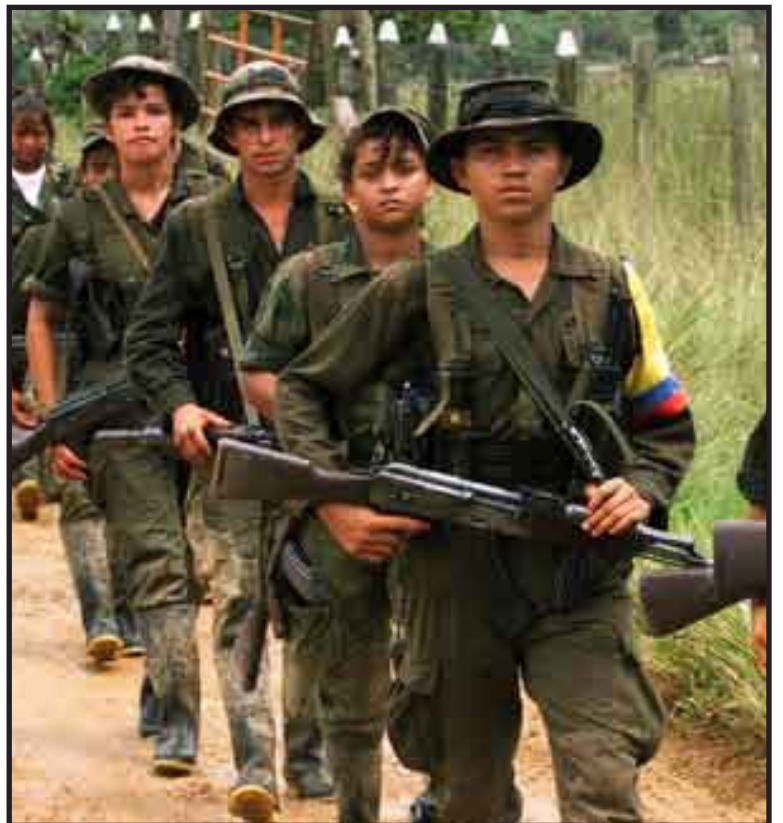
Familiares de militares colombianos que permanecen en poder de las Fuerzas Armadas Revolucionarias de Colombia (FARC) pidieron evitar que se dilate más el proceso para la liberación de los rehenes.

La revista Semana aseguró en su más reciente edición, que la negativa insurgente a aceptar a Brasil como garante, frenó la liberación de dos de los militares en poder de las FARC.