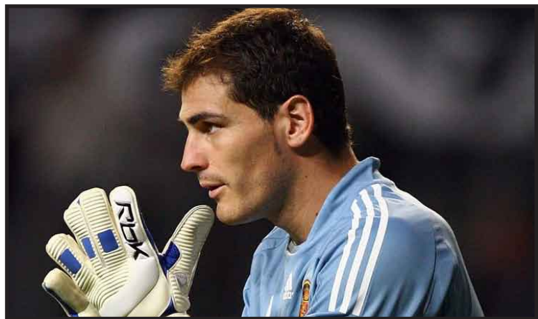
Iker Casillas, titular del Real Madrid y de la Selección española, fue elegido por la Federación Internacional de Historia y Estadística del Fútbol (IFFHS) Mejor Portero del mundo en 2009.