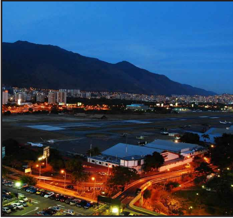
La medida forma parte de las medidas del gobierno para hacer frente a la crisis energética, derivada del descenso en el nivel del agua de la presa del Guri, que genera gran parte de la electricidad del país.

en el estado suroriental de Bolívar, alimenta las centrales hidroeléctricas del Guri, Caruachi y Macagua que generan 73% de la electricidad del país.