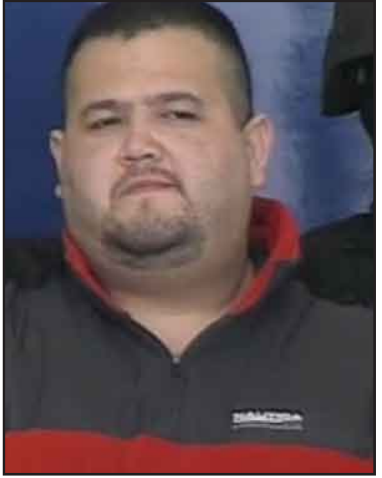
La Policía Federal detuvo en La Paz a Teodoro García Simental, alias "El Teo", "K-1" o "El tres letras", quien fue sicario del cártel de los Arellano Félix y había desatado una ola de violencia en Tijuana.

Una de las aeronaves aterrizó en la colonia Fidepaz y en ella se subieron unas maletas negras.