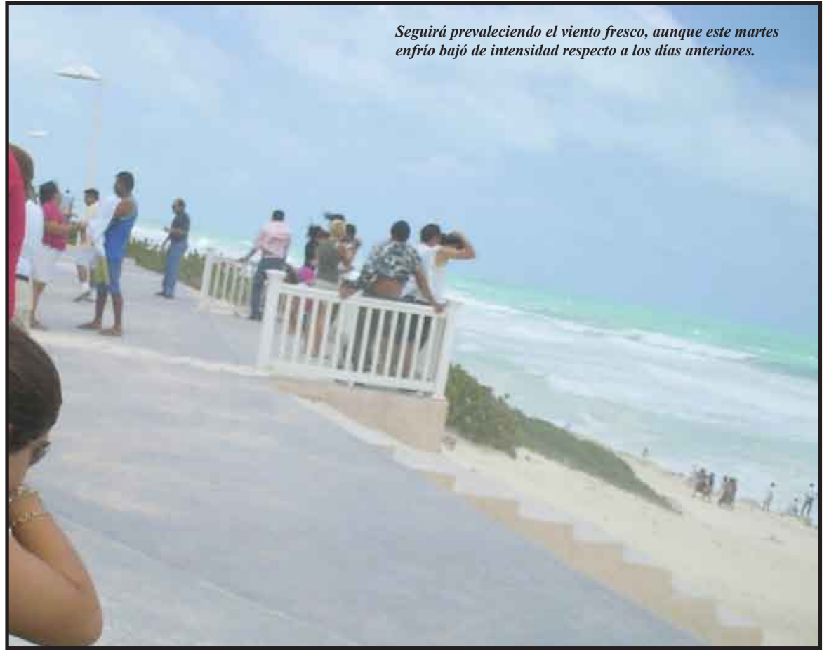
Seguirá prevaleciendo el viento fresco, aunque este martes enfrió bajó de intensidad respecto a los días anteriores.

Para finalizar mencionó que por el momento no existe ningún sistema ciclónico, recomendándose tomar las precauciones para la navegación marítima a lo largo de las costas del estado de Quintana Roo, y Canal de Yucatán por los efectos de viento y marea.