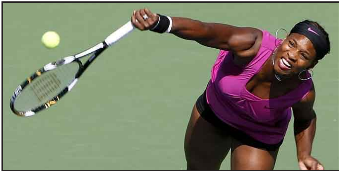
Serena Williams abrió su temporada con una victoria de 6-1, 6-2 sobre la española María José Martínez Sánchez, para pasar a cuartos de final del torneo internacional de Sydney.

Williams está usando el certamen en Sydney como su principal preparación para el Abierto de Australia. El primer torneo de Grand Slam del año comienza el lunes en Melbourne. La estadounidense estuvo libre en la primera ronda y necesitó apenas una hora y 12 minutos en la cancha ante Martínez Sánchez.