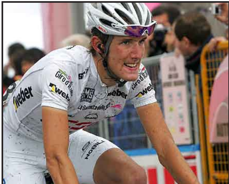
El luxemburgués Andy Schleck, segundo del pasado Tour de Francia, aseguró que el español Alberto Contador, "no es imbatible".

guró que el ganador de la ronda gala, el español Alberto Contador, "no es imbatible".