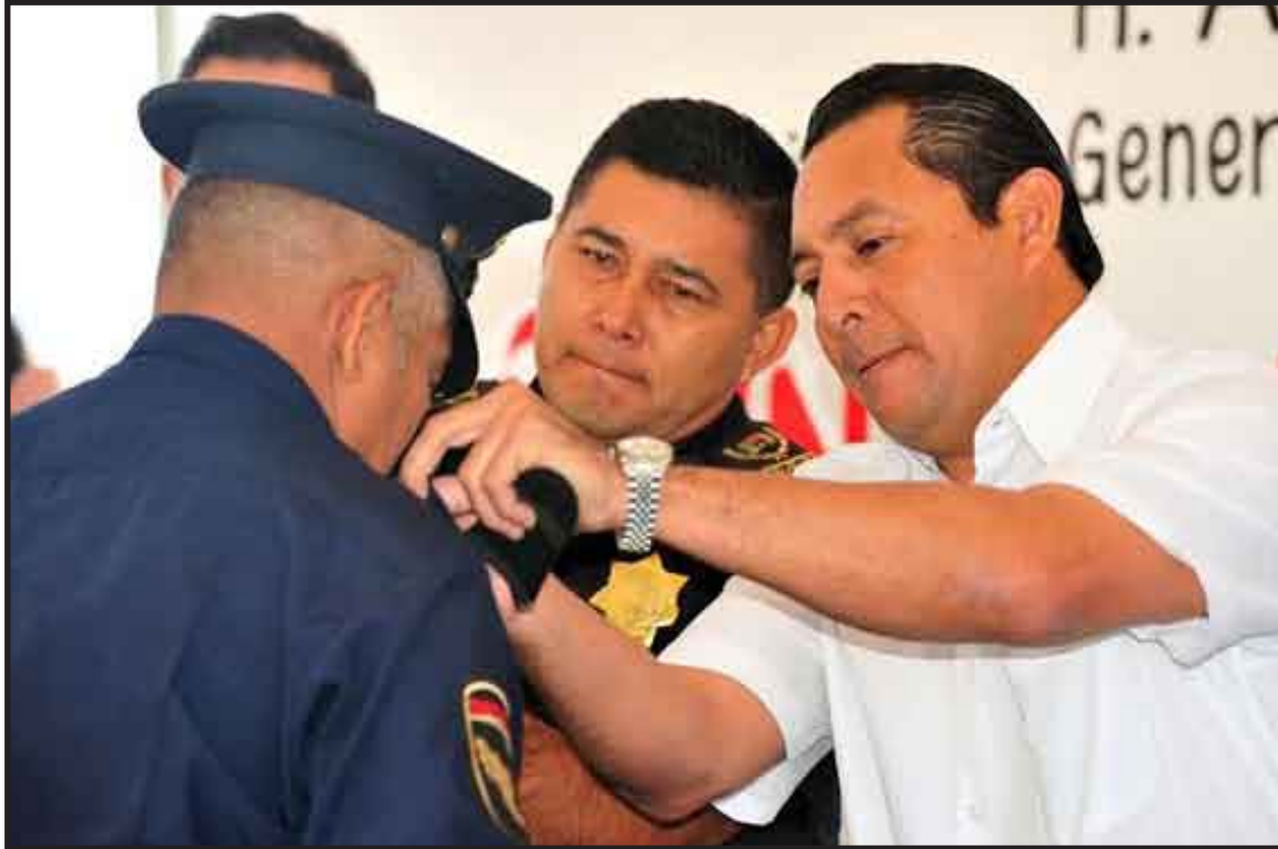
Román Quian Alcocer entregó 29 ascensos y estímulos económicos a personal con 10 y 15 años de antigüedad, de la Dirección General de Seguridad Pública, Tránsito y Bomberos.

Durante el evento, el presidente municipal entregó estos incentivos, ya que los policías