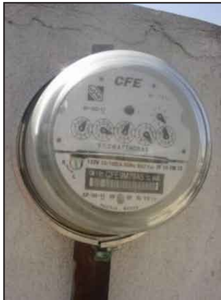
Este viernes ciudadanos inconformes realizarán una marcha para protestar por los cobros excesivos de que son víctimas por parte de la empresa.

6.- Evitar que se pierdan empleos y dar competitividad a las empresas para que se creen nuevas fuentes de trabajo.