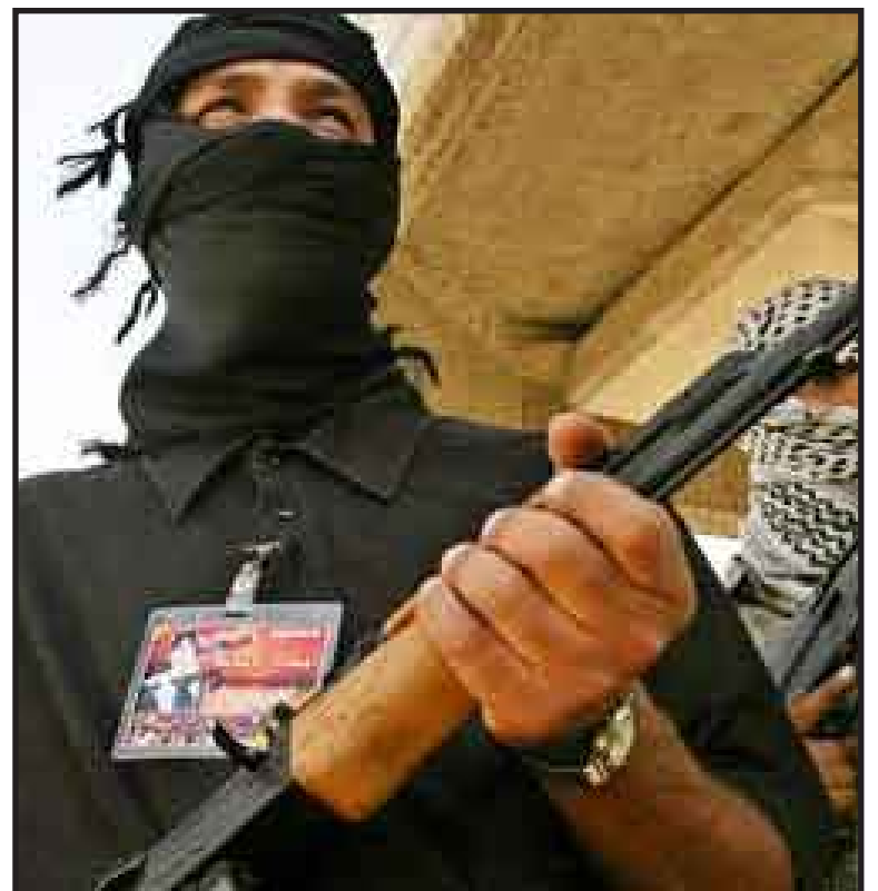
Las fuerzas de seguridad yemeníes hoy a cuatro supuestos militantes del grupo terrorista Al Qaeda en una operación en el sur del país.

Ayer, el jefe del Mando Conjunto Central del Ejército de Estados Unidos, general David Petraeus, dijo en una entrevista a la cadena CNN que su país dará más de 150 millones de dólares de ayuda a Yemen, pero que no enviará tropas para combatir el terrorismo en el país árabe.