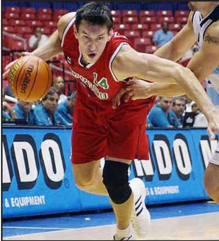
Después de seis años, el basquetbolista mexicano regresará a los Mavericks de Dallas, su primer equipo en la NBA.

nidad de Meoqui, en Chihuahua, ha jugado en 533 juegos a lo largo de su carrera profesional para cuatro equipos; Dallas, Denver, Golden State y Nueva Jersey.