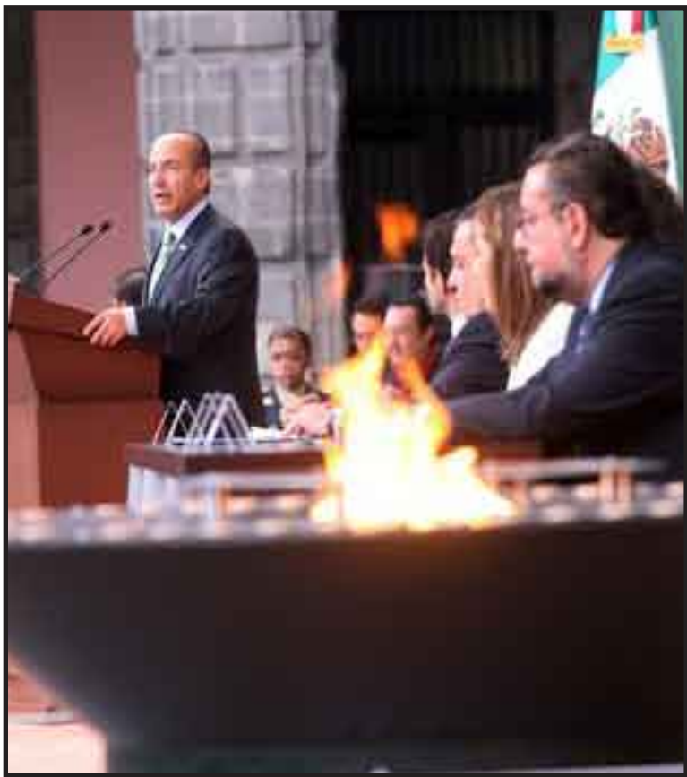
El pasado seis de septiembre de 2009, el presidente Felipe Calderón Hinojosa encabezó la ceremonia de encendido del Fuego del Bicentenario en el Palacio Nacional.

CHETUMAL.-- Por reprogramación hecha en la ciudad de México por la Comisión Nacional de los Festejos del Bicentenario de la Independencia Nacional y Centenario de la Revolución Mexicana, la llegada del Fuego del Centenario a la ciudad de Chetumal, que estaba programada para el 12 de enero de 2010, se pospuso para el próximo cuatro de febrero.