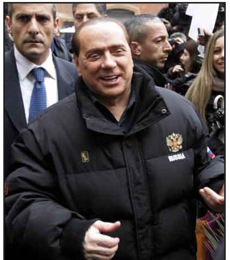
Luego de la agresión que sufrió, el primer ministro italiano Silvio Berlusconi regresó a su ocupada agenda política.

La popularidad de Berlusconi aumentó tras el ataque en Milán, según las encuestas. Las imágenes de su cara ensangrentada aumentaron el sentimiento de simpatía hacia el mandatario, al igual que las fotos que le mostraban con la cara vendada, saliendo del hospital.