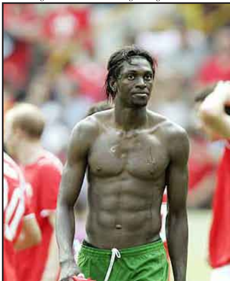
Dos personas fueron detenidas en relación con el atentado contra la Selección de Togo.

El autobús que transportaba a los jugadores de la Selección de Togo, que iba escoltado por la Policía angoleña, fue ametrallado por componentes de la guerrilla separatista del FLEC, que se responsabilizó de la acción.