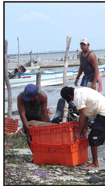
La tasa de desempleo aumentó en 2009 en 12 de los 14 países estudiados en América Latina.

En Colombia la tasa de desempleo aumentó entre 2008 y 2009 de 11.5 a 12.3%, mientras que en este mismo período aumentó en Argentina de 8.1 a 8.8% y Panamá de 5.6 a 6.6%, de acuerdo al documento que no proporciona datos sobre Bolivia.