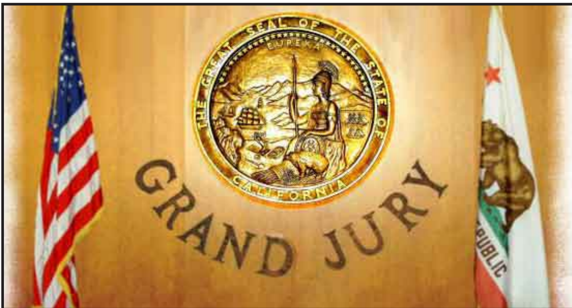
Inició en la Corte Federal de San Francisco un juicio federal en el que dos parejas del mismo sexo buscarán desafiar el contenido de la Proposición 8 que prohíbe los matrimonios entre personas del mismo sexo.

LOS ÁNGELES, 11 de enero.- Un juicio federal en el que dos parejas del mismo sexo buscarán desafiar el contenido de la Proposición 8 que prohíbe los matrimonios entre personas del