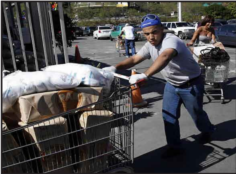
Filas de compradores se observaban en algunos comercios de Caracas.

Filas de compradores se observaban en algunos comercios de la capital, mientras gerentes de supermercados y locales de electrónica del este capitalino dijeron a Efe que, de momento, descartaban ajustar sus precios como consecuencia de la devaluación.