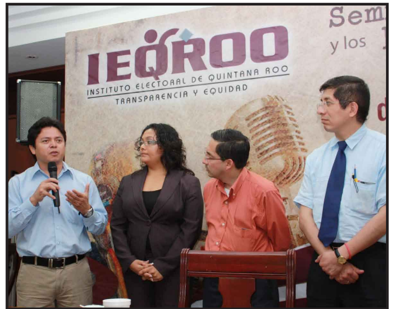
Funcionarios electorales, representantes de los partidos políticos, estudiantes y público en general, disertaron sobre la importancia de la relación sistema político-medios de comunicación.

Se concluyó que las reformas en materia electoral tienen como fin propiciar un escenario justo para los actores políticos, así como las autoridades electorales, y que a diferencia de otros países, los mexicanos han tomado cartas en el asunto en la materia, y no como en países como Francia, en el que está totalmente prohibido la publicidad de políticos en los medios de comunicación.