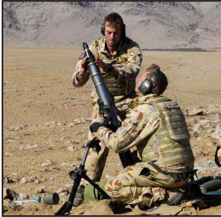
Barack Obama anunció el envío de otros 30 mil soldados al país asiático, aunque el despliegue será de duración limitada.

Obama planea dar una nueva imagen de esta guerra que ya dura ocho años y que, debido al creciente número de estadounidenses muertos en combate, tiene consternada a la opinión pública, afectada además por el desempleo y la caída del ingreso de los hogares. Obama deberá convencer a los escépticos, quienes temen un empantanamiento en Afganistán del tipo ocurrido en Vietnam, de que un plan para llevar a 100.000 el número de efectivos puede conducir a una estabilidad y al retorno pronto a casa de las tropas enviadas a aquel país tras los ataques del 11 de setiembre de 2001.