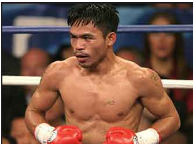
Manny Pacquiao presentó su candidatura para las elecciones de 2010, el segundo intento del ídolo boxístico para un escaño en el Congreso de las Filipinas.