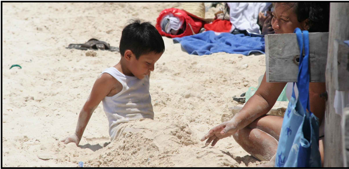
Se espera caluroso el día con la entrada de aire marítimo tropical.

CHETUMAL.-- Continúa la entrada de aire marítimo tropical con poco contenido de humedad, procedente del Golfo de México y Mar Caribe hacia la Península de Yucatán, lo que provocará tiempo caluroso para Quintana Roo.