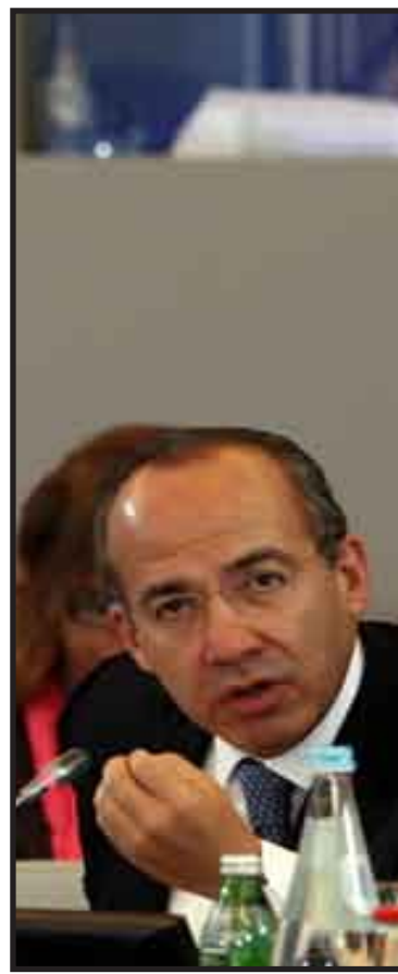
Felipe Calderón durante su intervención en la XIX Cumbre Iberoamericana llevada a cabo en Estéril, Portugal, que finalizó con una apuesta por la innovación y la tecnología.

En su balance de la cumbre, Iglesias explicó que asuntos que no estaban en la agenda formal ocuparon parte de las discusiones y citó entre ellos las perspectivas de la comunidad de cara a la Cumbre sobre Cambio Climático que se celebrará en Copenhague.