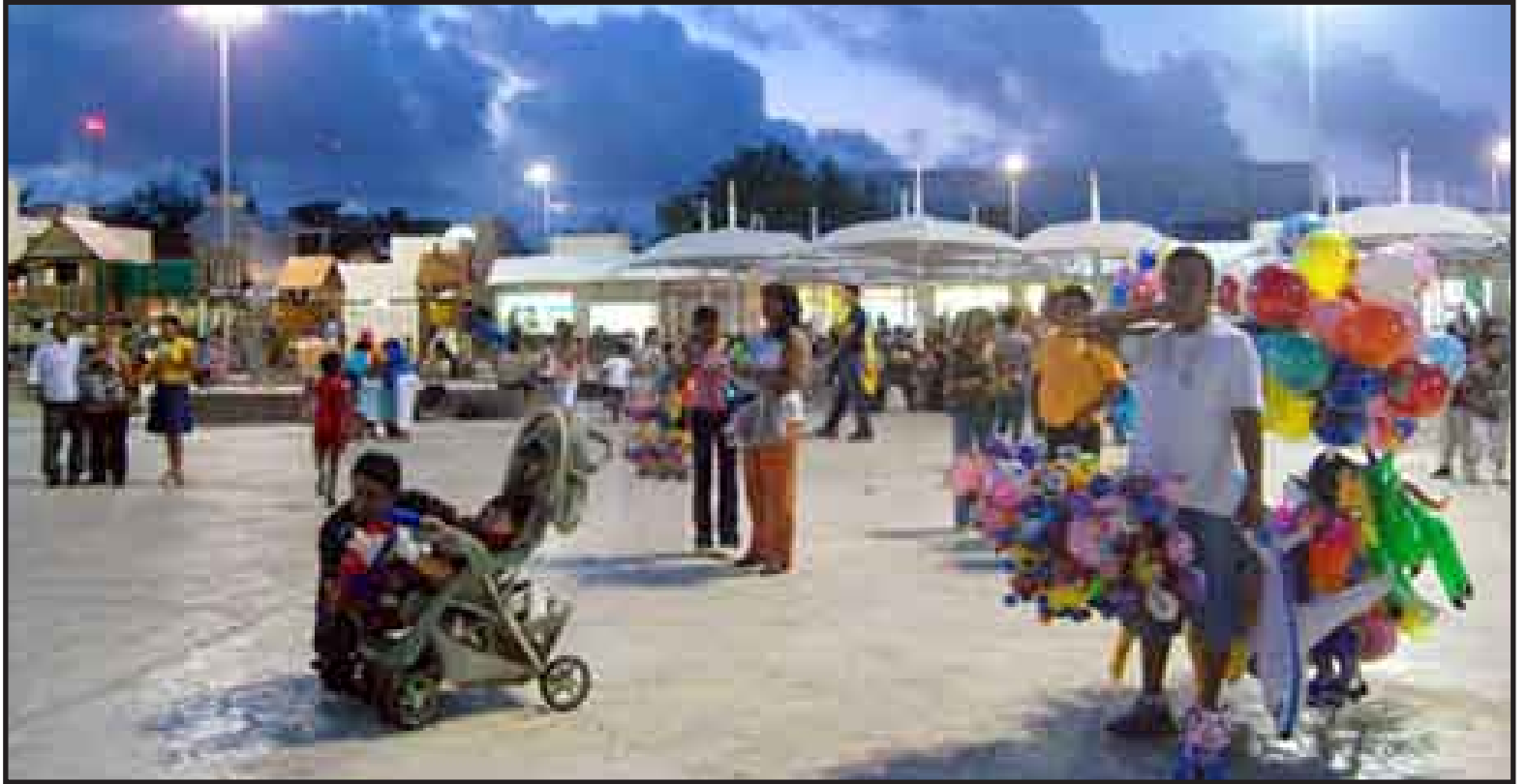
Los ambulantes irregulares de Las Palapas operan con impunidad, pues cuentan con la protección de regidores, pero quienes están en regla no pueden manifestar su inconformidad porque están amenazados con ser desalojados y quedarse sin su fuente de trabajo.

atender el problema, pero la limpia del Parque de Las Palapas será para el siguiente año, mientras tanto no se podrá hacer nada.