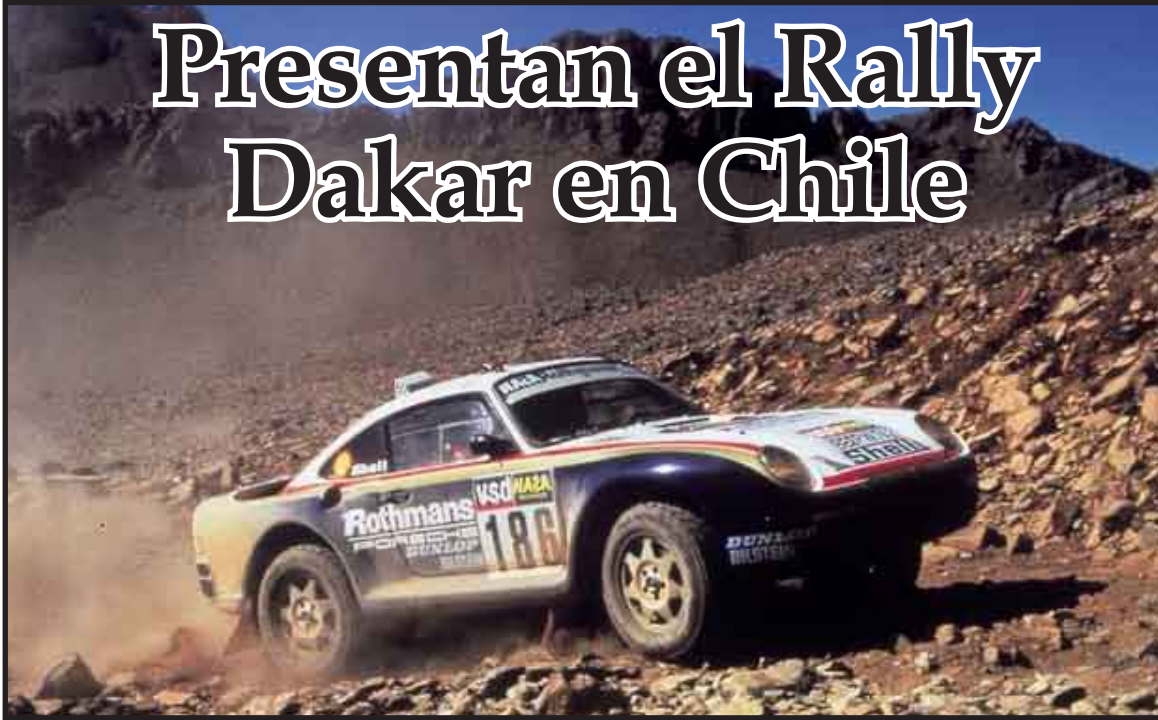
El rally Dakar Argentina-Chile 2010 se presentó de forma oficial en Santiago, con el paso por el desierto de Atacama como principal atractivo.