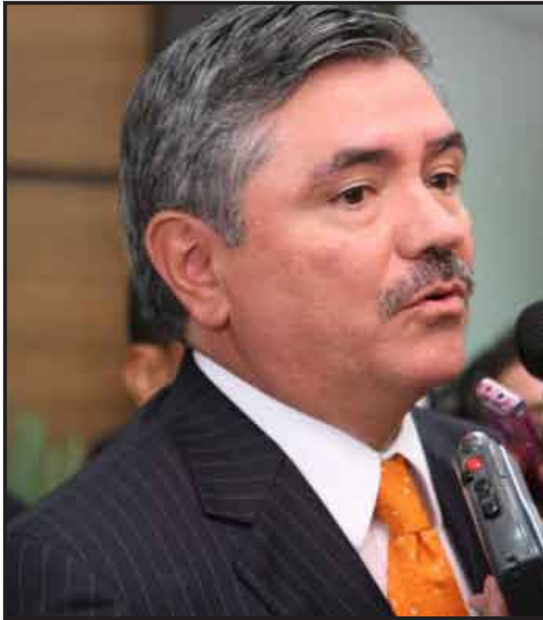
El consejero presidente del IFE, Leonardo Valdés Zurita, opinó que tres elecciones consecutivas de periodos de tres años, para un total de nueve años de gestión podría ser una alternativa viable.

MEXICO, 1 de diciembre.- El consejero presidente del Instituto Federal Electoral (IFE), Leonardo Valdés Zurita, apoyó la propuesta del Ejecutivo de que se concrete una reforma legal permita la reelección de legisladores y presidentes municipales, pues el organismo está listo para realizar elecciones con estas modificaciones.