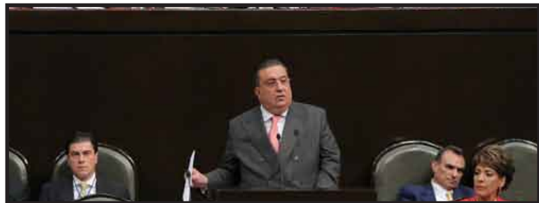
El responsable de la política interior señaló que es necesaria una reforma política que abra vías a la participación ciudadana, como el referéndum y plebiscito, la reelección consecutiva de alcaldes y legisladores.

Dijo a los diputados que el presente es tiempo del acuerdo, no para luchas mezquinas, sólo por poder o reconocimiento.