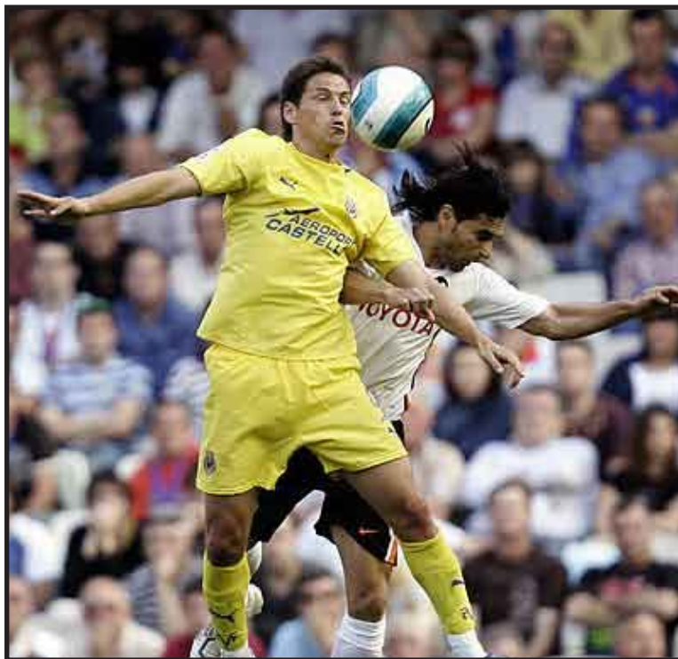
El delantero mexicano cumplirá su sueño de jugar en la Premier League.

LONDRES, 17 de septiembre.-- El club londinense West Ham