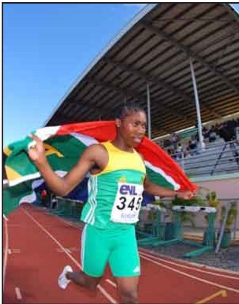
La federación de atletismo de Sudáfrica pidió que una comisión investigue la forma en que se manejó el caso de la corredora Caster Semenya.

La federación internacional de atletismo no ha confirmado ni negado los informes de prensa de que la campeona mundial de los 800 metros tiene características masculinas y femeninas.