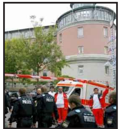
Diez alumnos de un centro escolar en la localidad de Ansbach, en el sur de Alemania, resultaron este jueves heridos, tres de ellos de gravedad, después de que un compañero de 18 años lanzara dos bombas incendiarias.

El agresor rompió sobre las 08.45 horas locales (06.45 GMT) con una hacha la puerta principal del edificio para seguidamente introducirse en el mismo y culminar su ataque con las bombas incendiarias.