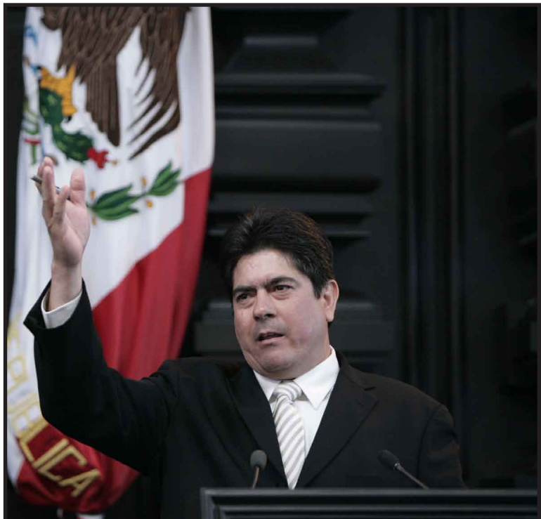
El senador Tomás Torres Mercado propuso analizar dualidad y repetición de procesos y funciones; procesos, funciones y áreas imprescindibles, entre otros puntos.