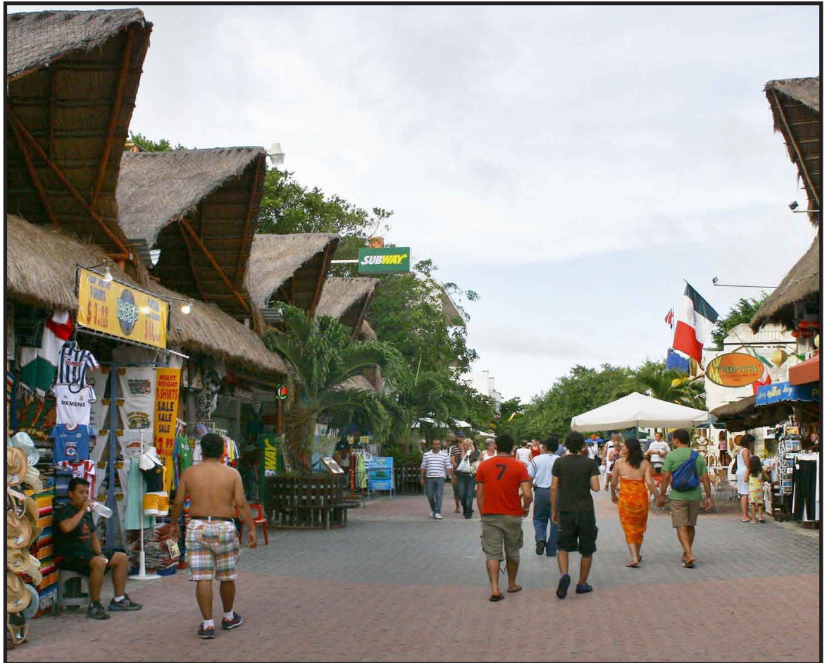
Será el próximo 27 de septiembre cuando se celebre a todo lo grande la Semana Internacional de Turismo en su trigésima edición, en donde los ciudadanos tendrán la oportunidad de disfrutar de una diversidad de eventos tanto culturales como gastronómicos, con el clásico toque de la Riviera Maya.

Por lo que será el próximo 27 de septiembre cuando se celebre a todo lo grande la Semana Internacional de Turismo en su trigésima edición, en donde los ciudadanos tendrán la oportunidad de disfrutar de una diversidad de eventos tanto culturales como gastronómicos, con el clásico toque de la Riviera Maya.