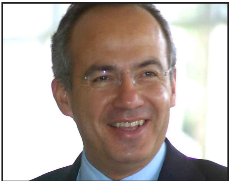
Felipe Calderón defendió el paquete económico enviado al Congreso y sostuvo que no se puede titubear más, "hay que demostrar nuestra solidaridad con los mexicanos".

Incluso aseguró que en el paquete enviado no se ignoran las circunstancias ni la crisis económica, al contrario por ello mismo se propone obtener mayores recursos para el sector más pobre del país y así beneficiar no a cinco sino a seis y medio millones de familias.