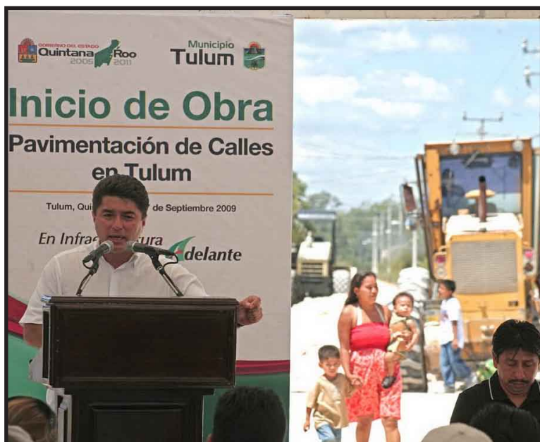
El gobernador del estado encabezó una productiva gira de trabajo en Tulum, donde puso en marcha obras de infraestructura de comunicaciones y transportes, de salud y turísticas en beneficio de la población y el turismo.

Al dirigir su mensaje a la población en las diferentes oportunidades a lo largo de su recorrido, González Canto destacó la transformación que se dará en el corto plazo en este joven municipio, con la construcción del aeropuerto internacional de Tulum, lo que será un detonador para el desarrollo de la zona.