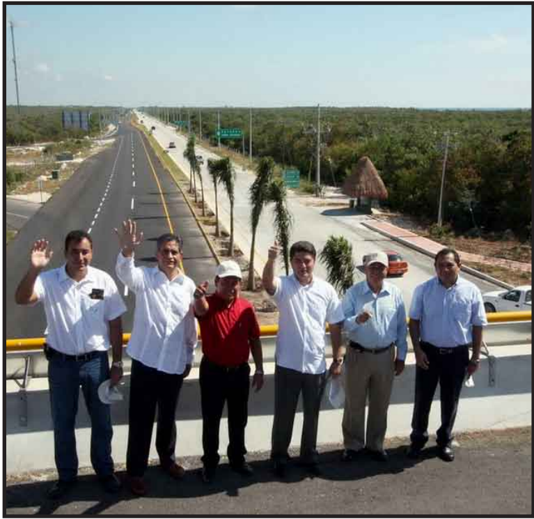
Los pasos a desnivel fueron inaugurados a la altura del parque temático Xel-Ha, en donde se llevó a cabo el acto protocolario, en el que se informó que la Secretaría de Comunicaciones y Transporte está destinando una inversión de casi 50 millones de pesos.