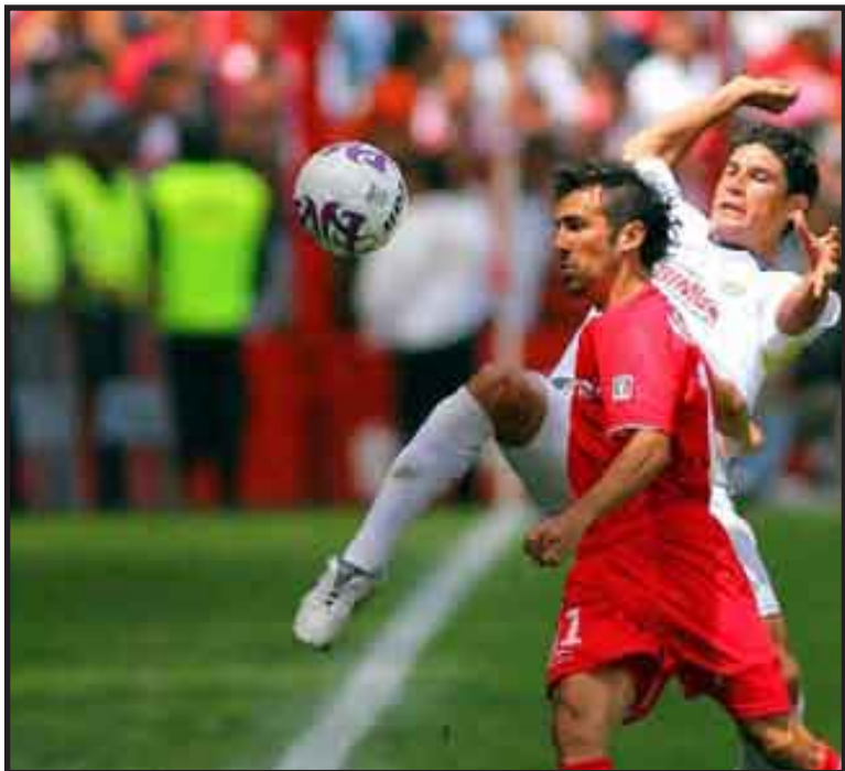
Toluca, con seis victorias y dos derrotas, muestra la tercera mejor ofensiva, con un porcentaje de dos goles por partido.

El domingo, además del Toluca-Atlas, el sublíder América visitará a los Gallos Blancos de Querétaro, ocupantes del último lugar, y los Pumas de la UNAM al Puebla, en una revancha de la semifinal del pasado torneo Clausura-2009.