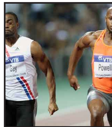
Ambos velocistas se reencontrarán el próximo 25 de septiembre en Daegu, Corea del Sur, para dirimir quien es el segundo hombre más rápido del mundo.

La rusa Yelena Isinbayeva, plusmarquista mundial, será otra de las atracciones de la reunión surcoreana, al igual que la estadounidense Allyson Felix, triple campeona universal del doble hectómetro.