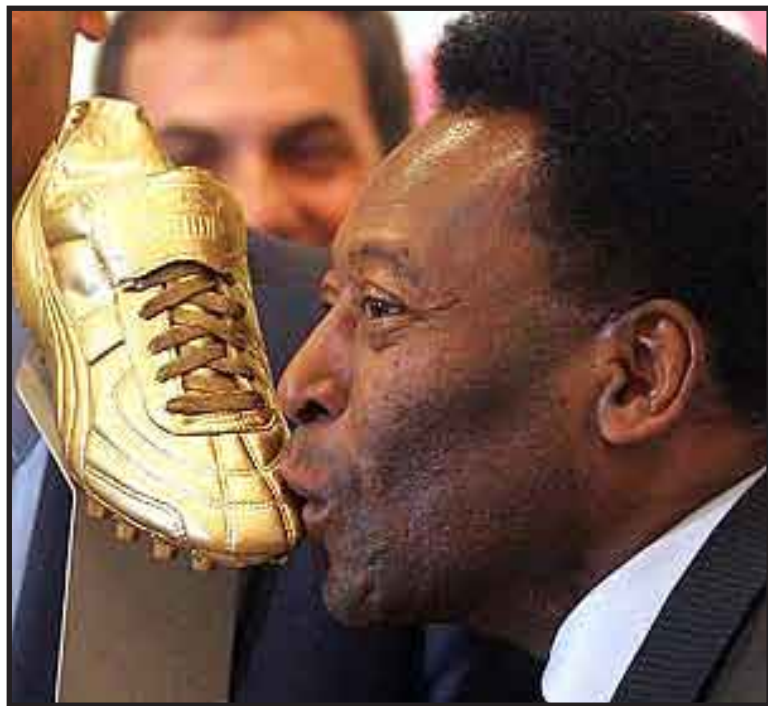
Pelé aseguró que Diego Maradona "no pateaba bien con la derecha y no hacía gol de cabeza", así como añadió que el único gol importante que el argentino marcó de esta forma "fue con la mano".

Además admitió que como aficionado al fútbol su deseo es que la albiceleste esté en el Mundial de Sudáfrica'10: "Es difícil imaginar un Mundial sin Argentina y no es bueno para el fútbol. Creo que podemos tener una sorpresa pero yo que amo el fútbol pero yo que no", dijo Pelé.