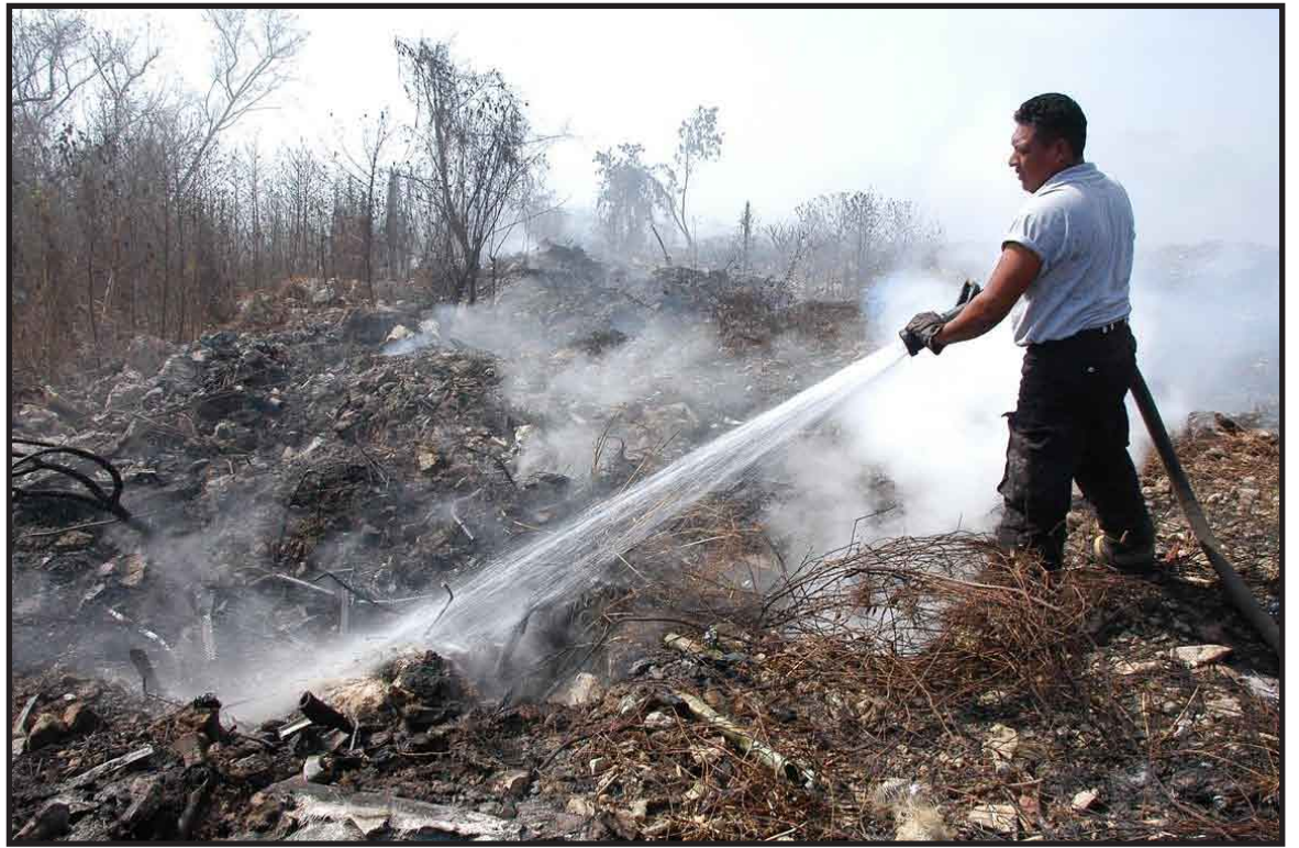
De un total de nueve incendios que se generaron la semana pasada en los municipios de Isla Mujeres y Benito Juárez, quedaron por extinguir dos que ya han sido controlados.

sean sorprendidas encendiendo fuego de manera intencional, serán castigadas conforme a la ley.