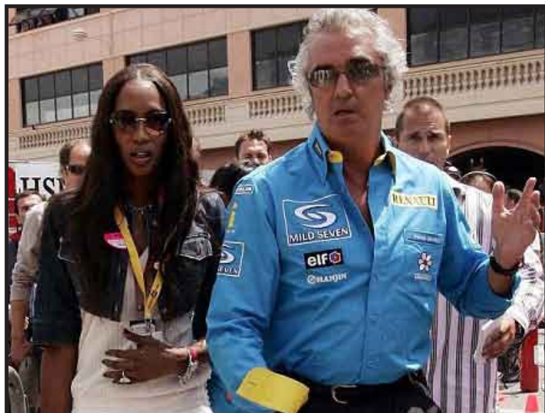
Flavio Briatore dijo que renunció a su cargo como director de Renault para salvar al equipo en el escándalo del choque de Nelson Piquet Jr.

LONDRES, 17 de septiembre.-- Flavio Briatore dijo que renunció a su cargo como director de Renault para salvar al equipo en el escándalo del choque de Nelson Piquet Jr., aunque la escudería todavía puede ser expulsada de la Fórmula Uno.