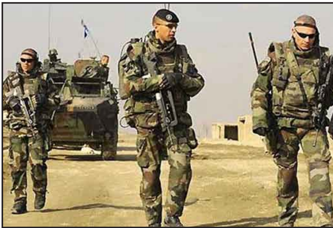
Funcionarios de la ONU dijeron que la entidad estaba buscando acordar una cumbre sobre Afganistán a comienzos de 2010 para abordar las cuestiones políticas y económicas del atribulado país.

totalidad de las responsabilidades en materia de seguridad y de la administración del país.