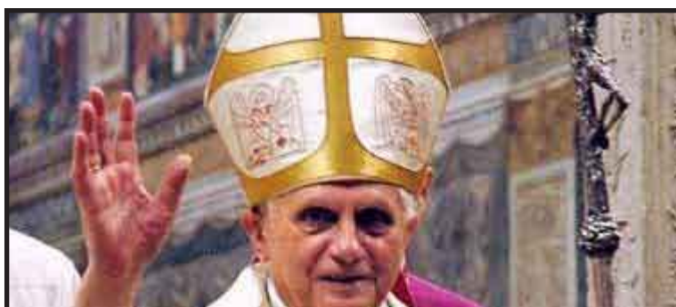
El papa Benedicto XVI evocó los hechos que dieron inicio a la Segunda Guerra Mundial y pidió que el recuerdo de ese conflicto sirva para que no se repitan "tales barbaridades".

Y agregó: "Que la memoria de esos acontecimientos nos empuje a rezar por las víctimas y por aquellos que todavía llevan las heridas en el cuerpo y en el corazón".