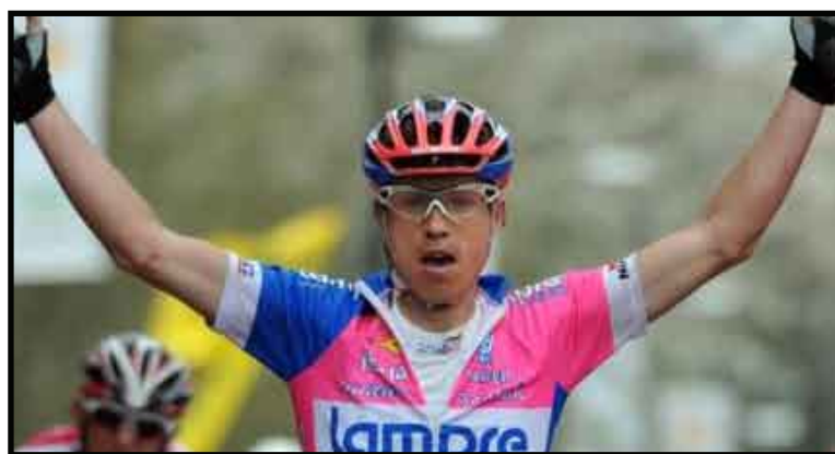
El italiano superó por 33 segundos a su más cercano competidor, para convertirse en el primer ganador en etapas de montaña.

Mañana se disputará la novena etapa, también de alta montaña, entre Alcoy y el alto de Xorret del Catí, catalogado de primera categoría, en cuya cúspide estará la línea de meta después 189 kilómetros.