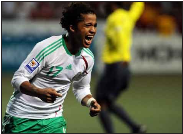
Los dos principales diarios costarricenses destacaron la actuación de Giovanni dos Santos, quien fue pieza clave en el triunfo de la selección mexicana en el estadio Ricardo Saprissa.

SAN JOSÉ, 6 de septiembre.-- La prensa deportiva de Costa Rica aseguró este domingo que el Mundial se aleja para una selección costarricense de "caricatura" y con un "coladero" en la defensa, después de caer en casa por 0-3 ante México; además, los dos principales diarios costarricenses destacaron la actuación de Giovanni dos Santos.