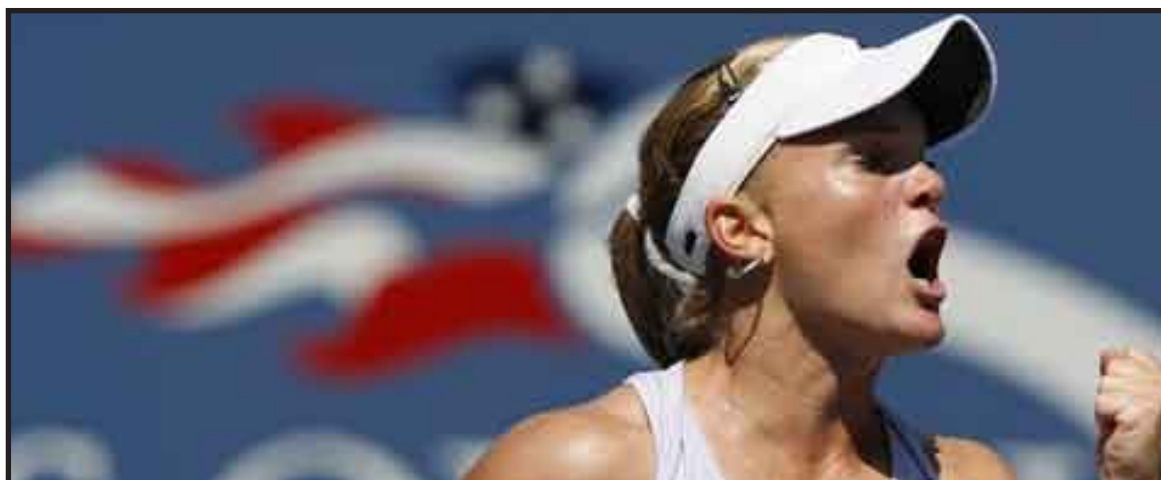
Como si fuese un cuento de hadas, la chica estadounidense de 17 años se ha convertido en la sensación del último Grand Slam de la temporada, tras clasificarse a los octavos de final con un triunfo 3-6, 6-4, 7-5 sobre Maria Sharapova.

Oudin no es la única mujer que está teniendo un torneo de ensueño, ya que la argentina Gisela Dulko se metió entre las 16 mejores al vencer 6-3, 6-4 a la kazaja Yaroslava Shvedova, emulando su mejor actuación en los Grand Slams.