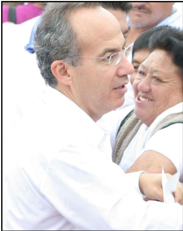
Al encabezar en Palacio Nacional la ceremonia del encendido del Fuego Bicentenario, Felipe Calderón afirmó que la gloria nacional no sólo está en su historia, sino fundamentalmente en su futuro.