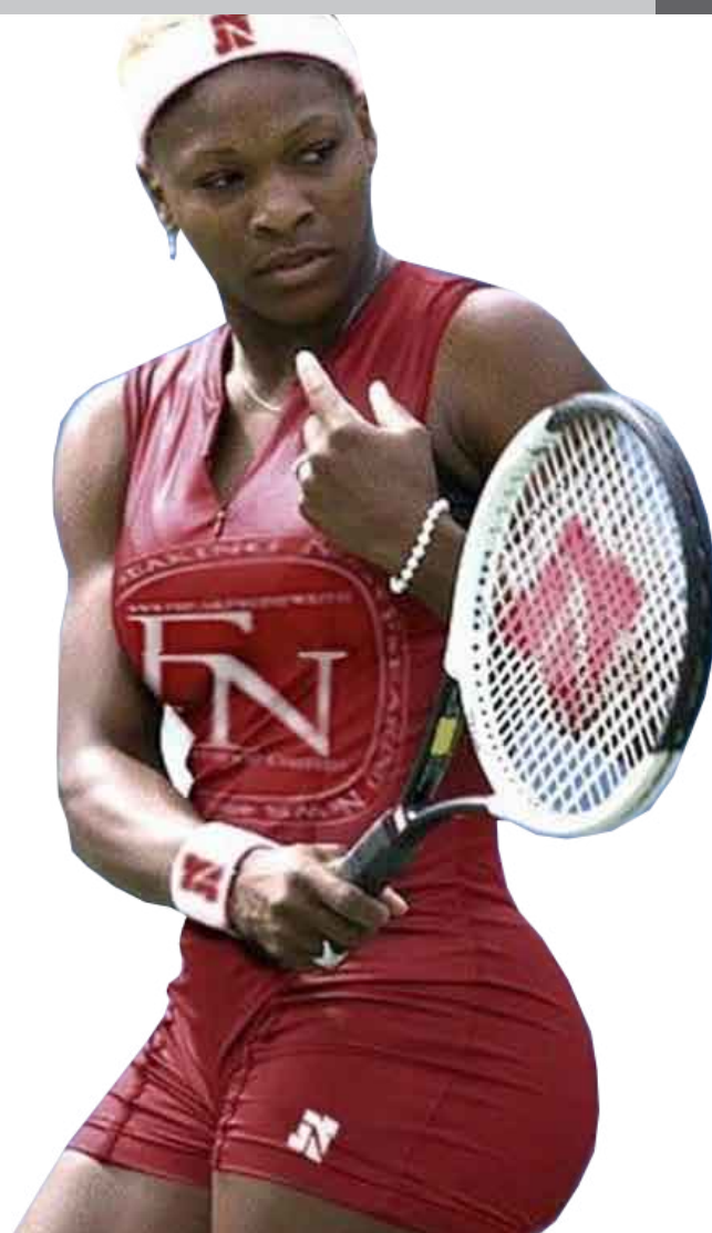
La estadounidense Serena Williams, segunda favorita y vigente campeona, arrolló a la eslovaca Daniela Hantuchova (6-2 y 6-1) y se convirtió en la primera clasificada a los cuartos de final del Abierto de Estados Unidos.

El cuadro femenino se ha allanado para la campeona. Las rusas Dinara Safina y Elena Dementieva, las serbias Ana Ivanovic y Jelena Jankovic, son algunas de las significativas aspirantes que han caído antes de cumplirse la primera semana de competición.