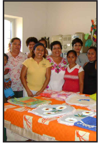
Las participantes e instructora con los manteles elaborados en el Centro Comunitario de la Región 237, gracias a la colaboración de las delegaciones de la Secretaría de Desarrollo Social y del Instituto de Capacitación para el Trabajo (ICAT).