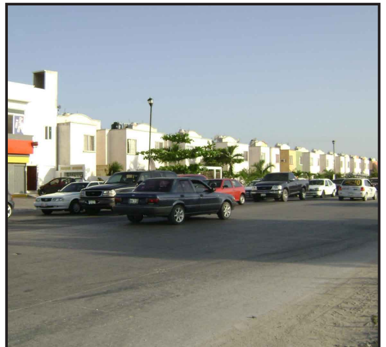
Pese a la inconformidad que manifestaban un grupo de vecinos del fraccionamiento Misión de las Flores para que no se construyera un cárcamo en un terreno que sería habilitado como parque, CAPA sigue adelante con el proyecto.

En el año 2008 se invirtieron 25 millones de pesos en el tratamiento del vital líquido y en lo que va del 2009 se han ingresado 15 millones de pesos por ese concepto.