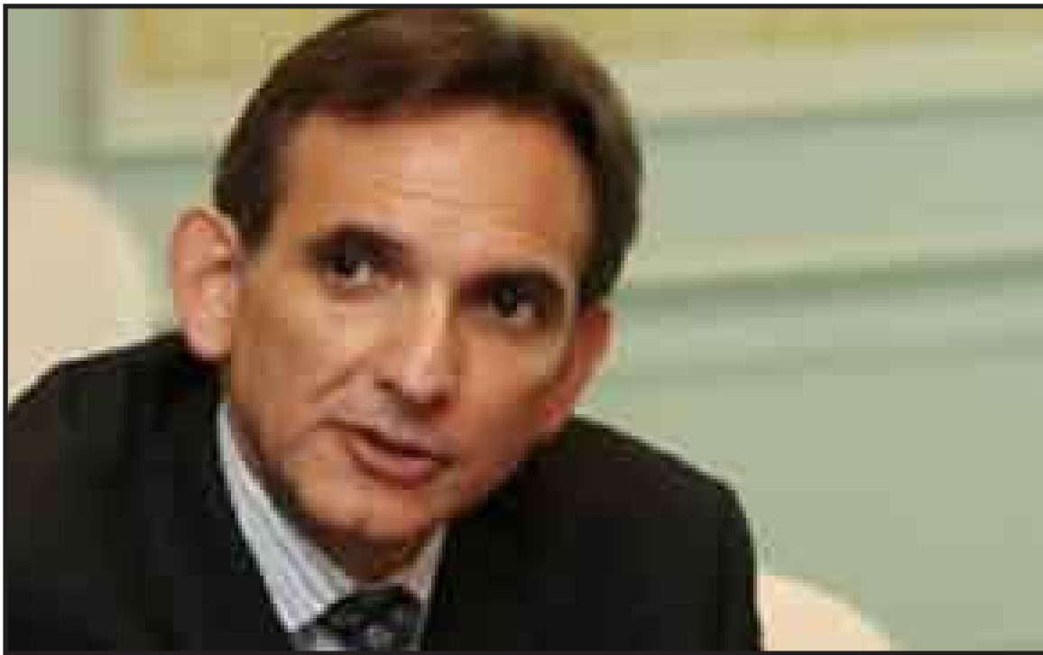
El embajador de Estados Unidos en México se pronunció por continuar en la lucha contra el crimen organizado y el control de pandemias.

países tienen que confrontar, dijo, son interrelacionados, pero Estados Unidos y México como socios, tienen la fortaleza para vencerlos.