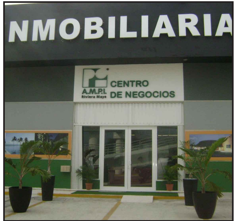
El centro, que fue dado a conocer en sus inicios como el Reality International Center (RIC), para posteriormente encontrar una gran sinergia con la AMPIRM, conformando lo que ahora será el lugar donde convergen administradores, valuadores, desarrolladores, vendedores y todos aquellos que de diversas formas inciden en la actividad inmobiliaria.