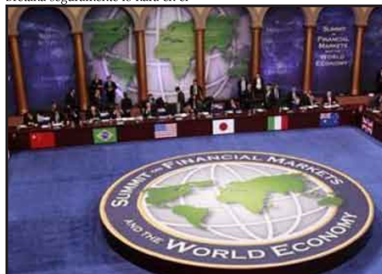
Los ministros y los gobernadores de sus respectivos bancos centrales intentarán coordinar una eventual estrategia de retirada de fondos extraordinarios. Analizarán además nuevas reformas financieras.

trimestre, mientras que Gran Bretaña seguramente lo hará en el tercer trimestre.