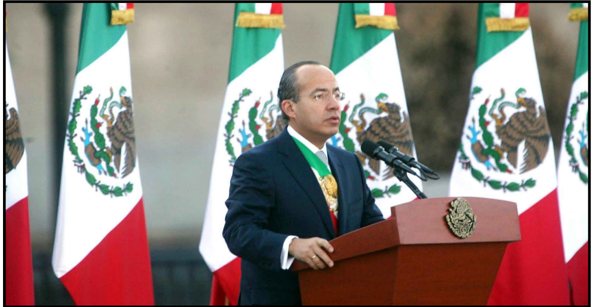
Felipe Calderón llamó a partidos políticos a analizar todas las opciones para mejorar los ingresos del gobierno, dado que "la situación es verdaderamente preocupante".