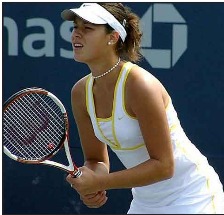
La tenista serbia tomó la decisión tras ser eliminada en la primera ronda del Abierto de los Estados Unidos ante una rival teóricamente inferior.

enas puedo esperar para desconectarme del tenis un poco. Creo que me ayudará a volver al sendero del éxito", concluyó.