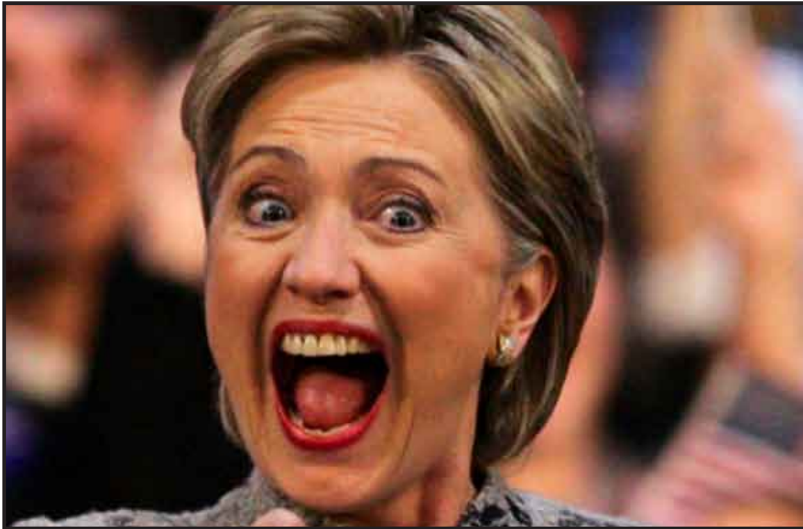
Hillary Clinton anunció la supresión de una amplia gama de ayudas al gobierno de Honduras, una decisión derivada del golpe de Estado que tuvo lugar el 28 de junio.

“La secretaria de Estado Hillary Clinton, quien se reunió con el presidente depuesto Manuel Zelaya, actuó conforme a la legislación de Estados Unidos reconociendo la necesidad de fuertes medidas, a la luz de la resistencia del régimen de facto de adoptar el Acuerdo de San José”, y de negarse a “restaurar las reglas democráticas y constitucionales en Honduras”, especifica el comunicado que