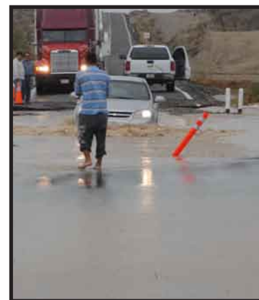
Continúa la alerta naranja en 14 municipios del sur de Sonora, ante las afectaciones que podrían generar las lluvias.

Precisó que las actividades escolares se reanudarán hasta nuevo aviso en los municipios de Guaymas, Empalme, Cajeme, Bâcum, Navojoa, Huatabampo, Benito Juárez y Alamos, entre otros municipios.