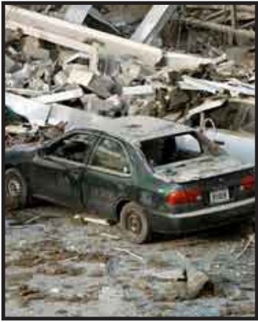
Las bombas fueron el más reciente de una serie de ataques contra chiíes y grupos minoritarios en la capital y el norte de Irak.

El aumento de la violencia se produce luego de que el 30 de junio las fuerzas estadounidenses se retiraron de zonas urbanas, lo que generó preocupación acerca de la capacidad de los efectivos iraquíes para proteger a la población.