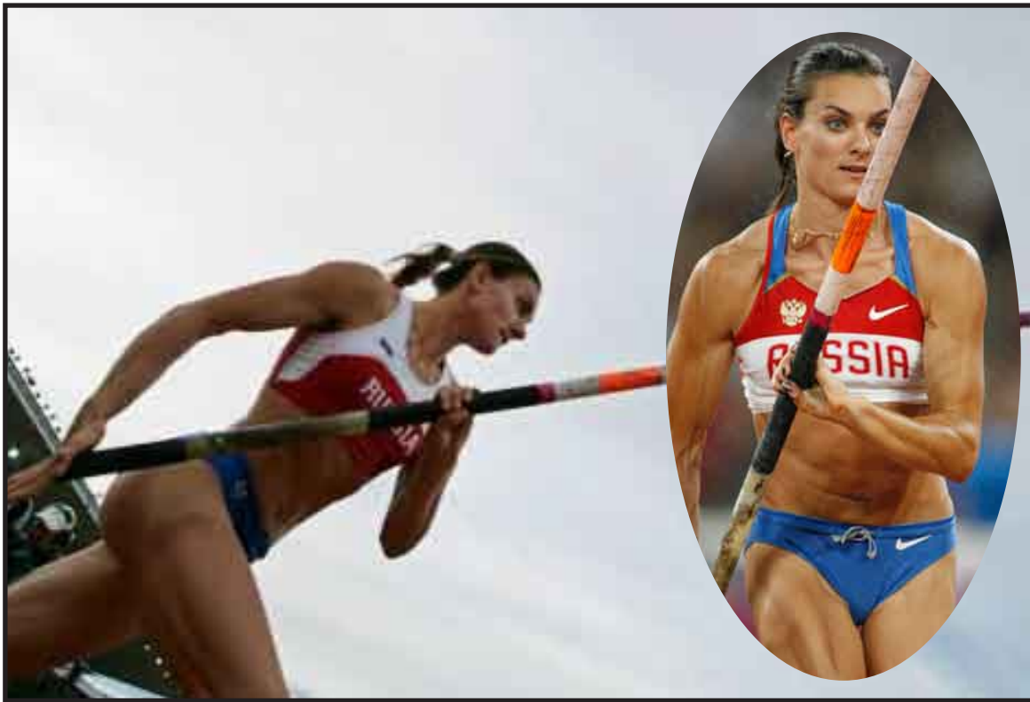
La rusa Yelena Isinbayeva se dispone a colgarse su tercera medalla de oro consecutiva.

El programa del lunes contiene otras cuatro finales: la masculina de martillo y las femeninas de triple salto, 3.000 m. obstáculos y 100 metros. Esta última cerrará la jornada a las 21.35 con una nueva batalla entre las velocistas de Estados Unidos, encabezadas por la campeona nacional Carmelita Jeter, y las jamaicanas con la campeona del mundo Shelly-Ann Fraser.