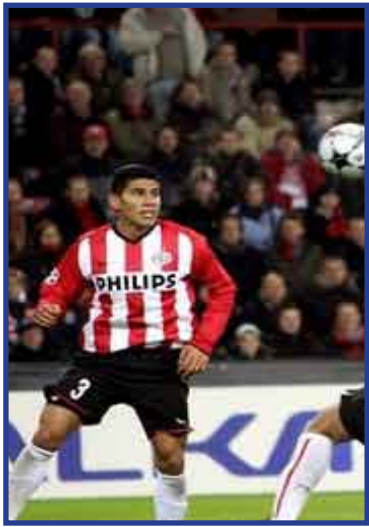
Los dos mexicanos del equipo holandés tuvieron participación en el encuentro en el que el PSV venció a su acérrimo rival, Ajax.

EINDHOVEN, 16 de agosto.-- El PSV Eindhoven logró su primera victoria de la temporada 2009-2010 de la Eredivisie de Holanda al imponerse 4-3 a su acérrimo rival, el Ajax de Holanda, en partido celebrado en el Philips Stadium, y que correspondió a la tercera jornada.