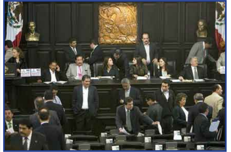
Senadores del PRD consideran irresponsable gastar 3 mil millones de pesos en la Cédula de Identidad Ciudadana, en medio de la crisis económica que enfrenta el país.

El también presidente de la Comisión de Estudios Legislativos, dijo que si bien la Ley General de Población establece que el Registro Nacional de Ciudadanos y la Cédula de Identidad Ciudadana son servicios de interés público que presta el Estado, a través de la Secretaría de Gobernación, esta disposición nunca se ha aplicado.