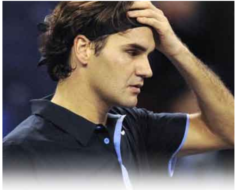
Para llegar a la final, el tenista suizo tendría que enfrentarse a Juan Martín del Potro, Andy Murray y Andy Roddick.

CINCINNATI, 16 de agosto.-- El español Rafael Nadal, que mañana perderá su número dos mundial en favor del escocés Andy Murray, figura en "zona baja" del cuadro principal del Masters 1000 de Cincinnati, que se inicia mañana, y tendrá en su camino hacia la final al serbio Novak Djokovic y al francés Jo-Wilfried Tsonga.