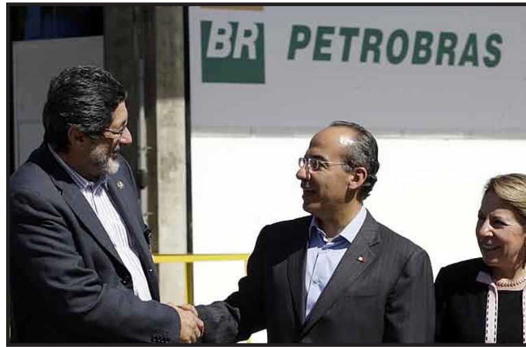
Felipe Calderón visitó las instalaciones de Petrobras, empresa petrolera estatal de Brasil, en donde informó que México busca una asociación estratégica de Pemex y su homóloga en esta nación sudamericana.