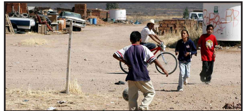
El Consejo Consultivo del Unicef pidió a las autoridades y legisladores afectar lo menos posible los presupuestos destinados a programas y acciones que tienen incidencia en el bienestar de niños y adolescentes, tales como salud, educación y alimentación.

“La crisis económica es un tema que preocupa y que queremos poner en el centro de la agenda, sobre todo ahora que se va a discutir el presupuesto para el próximo año, y a sabiendas de que los problemas que el mismo gobierno ha reconocido existen para sus financiamientos”, agregó.