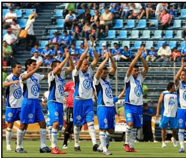
Puebla sumó cinco puntos en el Grupo Dos, mientras que Potros del Atlante sigue con cero unidades en el sector Tres.