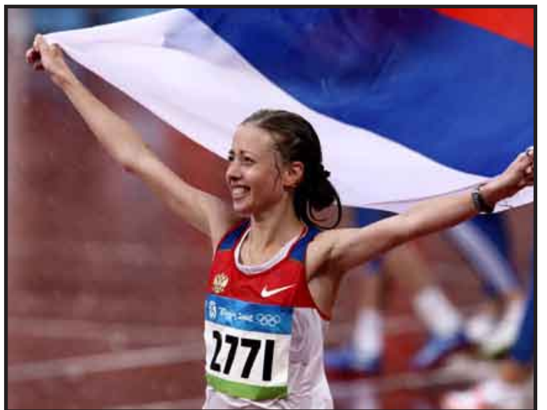
La rusa Olga Kaniskina se adjudicó la medalla de oro en los 20 kilómetros de caminata, en el Mundial de Atletismo.

La irlandesa Olive Loughnane terminó en segunda posición, mientras que la china Hong Liu se hizo con la medalla de plata.