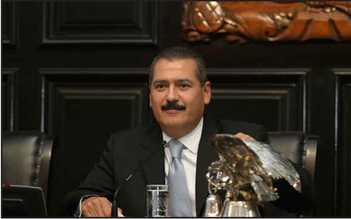
El senador Manlio Fabio Beltrones pidió replanteamiento en los esquemas de distribución de recursos y competencias fiscales para evitar su quiebra.

MEXICO, 16 de agosto.- La grave crisis por la que atraviesan las finanzas públicas en los tres niveles de gobierno, especialmente el municipal y de las entidades federativas, exige el replanteamiento en los esquemas de distribución de recursos y competencias fiscales para evitar su quiebra y "sin guardaditos", expresó el senador Manlio Fabio Beltrones Rivera.