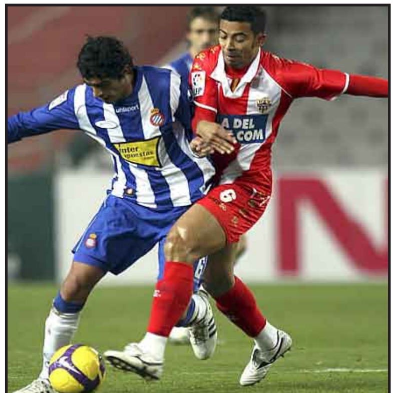
El Almería, que dirige Hugo Sánchez, perdió el juego por la disputa del Trofeo Festa d'Elx 2009, contra el Elche, de la Segunda División de España, por 2-1.

El Almería, mantuvo cierto dominio sobre su rival, sin embargo, no logró concretar sus llegadas, pues en dos ocasiones estrelló el esférico en los postes del arco del Elche.