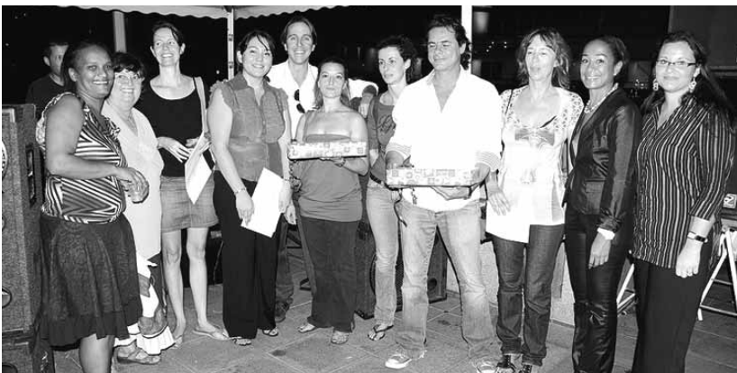
Les lauréats du premier concours de vitrines de Noël organisé par le Cttsb

Afin d'animer le centre ville de Gustavia et la zone commerciale de Saint Jean lors des fêtes de fin d'année, le Comité territorial du tourisme a lancé début décembre un concours de vitrines de Noël auquel ont participé 25 boutiques à Gustavia et 10 à Saint Jean. Initialement prévue le 30 décembre, mais retardée en raison du mauvais temps