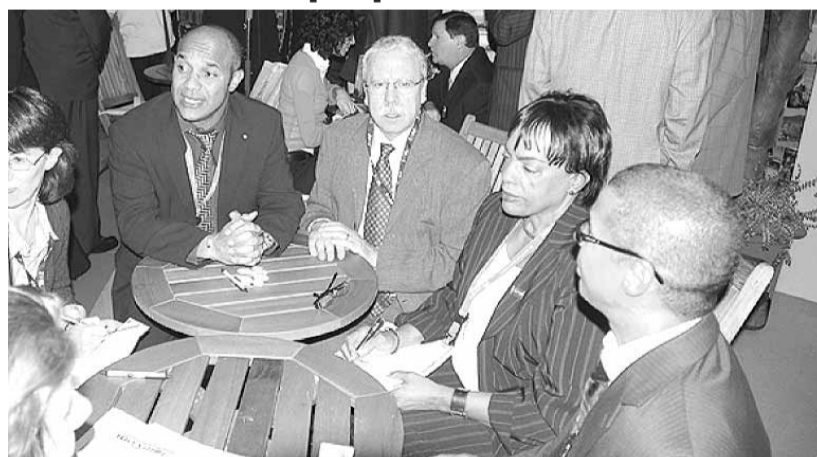
L'alliance Saint-Martin / Sint Maarten / Anguilla au Top Résa 2007 à Deauville.

Si pour l'île de Saint-Martin, avoir un stand au salon Top Résa n'était pas une nouveauté, en revanche, pour la COM de Saint-Martin, être présente à ce salon, était bien une première. Pour la COM et aussi pour l'Office de tourisme dans sa nouvelle configuration d'association satellite à la Collectivité d'outre-mer. «Cela n'a pas manqué de susciter une curiosité certaine de la part des tours opérateurs, agents de voyages et autres visiteurs venus sur ce