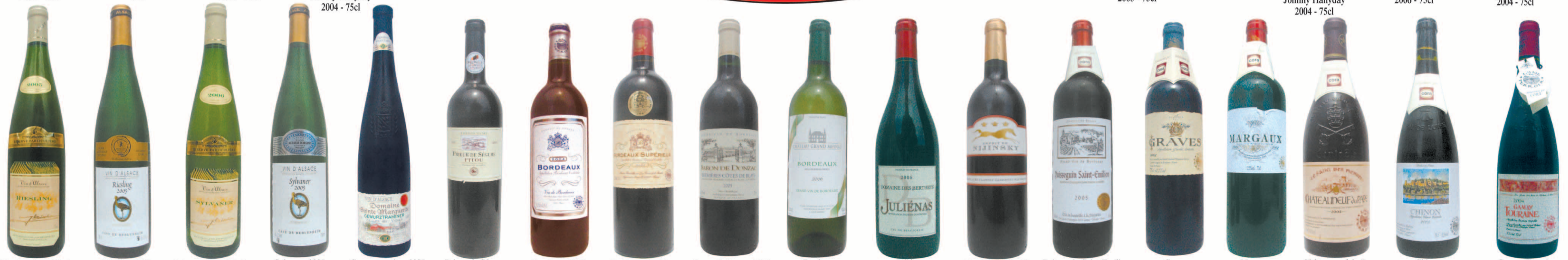
Riesling Jean Biecher Vin d'Alsace 2005 - 75cl Riesling 2005 Cave de Beblenheim Vin d'Alsace - 75cl Sylvaner Jean Biecher Vin d'Alsace 2006 - 75cl Sylvaner 2005 Cave de Beblenheim Vin d'Alsace - 75cl Gewurztraminer 2005 Domaine Ste Marguerite Vin d'Alsace - 75cl Prieur de Ségure Fitou 2005 - 75cl Bordeaux 2004 Ame du Terroir 75cl Bordeaux Supérieur Ame du Terroir 75cl 2004 Baron de Donzac 2005 Premières Côte de Blaye 75cl Bordeaux Château Grand Meynau 2006 - 75cl Juliéna Domaine des Berthets 2005 - 75cl Esprit de Nijinski Cabernet Sauvignon 75cl Puissequin Saint Emilion Ame du Terroir 2005 - 75cl Graves Ame du Terroir 2004 - 75cl Margaux Ame du Terroir 2004 - 75cl Châteauneuf du Pape Ame du Terroir 2004 - 75cl Chinon Ame du Terroir 2005 - 75cl Gamay Touraine Ame du Terroir 2004 - 75cl