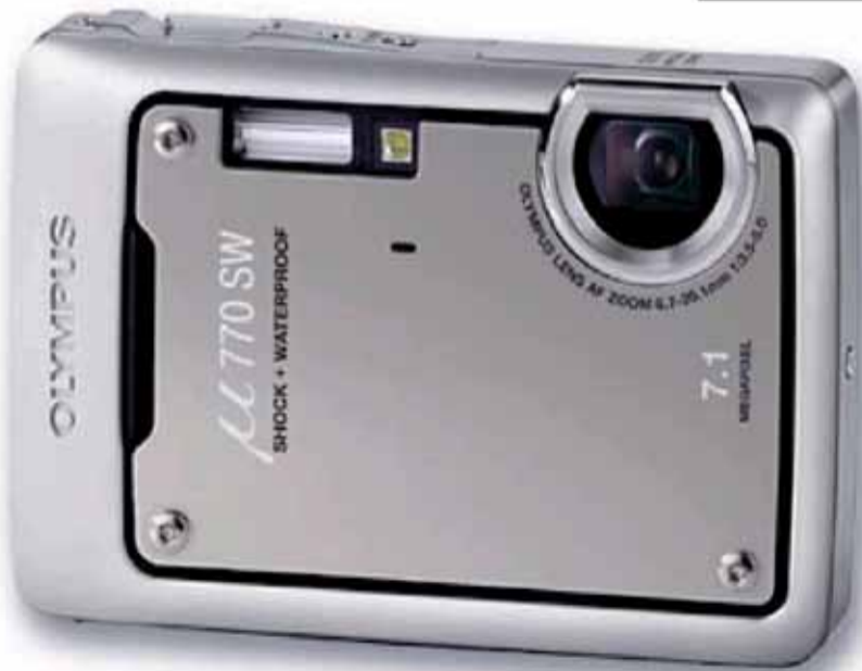
STYLUS 770 (mju 770)