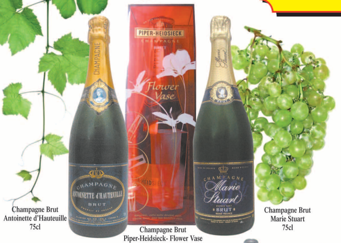
Champagne Brut Antoinette d'Hauteville 75cl Champagne Brut Marie Stuart 75cl Champagne Brut Piper-Heidsieck- Flower Vase 75cl