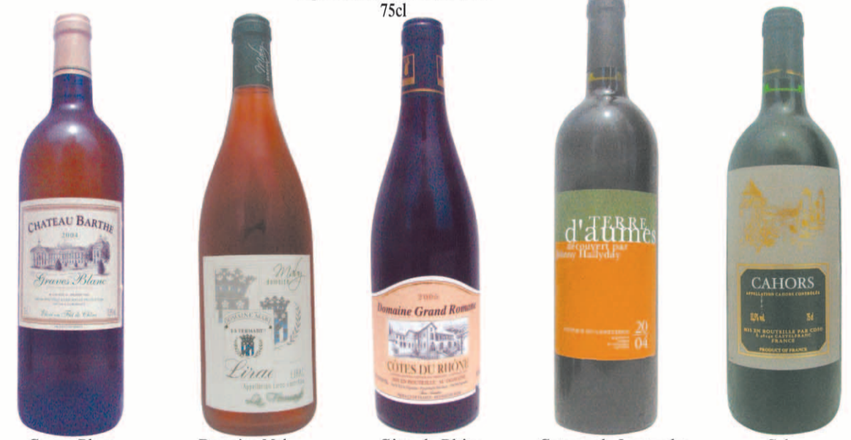
Graves Blanc Château Barthe 2004 - 75cl Domaine Maby Lirac - Rosé 75cl Côtes du Rhône Domaine Grand Romane 2005 - 75cl Coteaux du Languedoc Terre d'Aumes Johnny Hallyday 2004 - 75cl Cahors 75cl

5 BOUTEILLES DE VIN identiques achetées la 6 ème OFFERTE