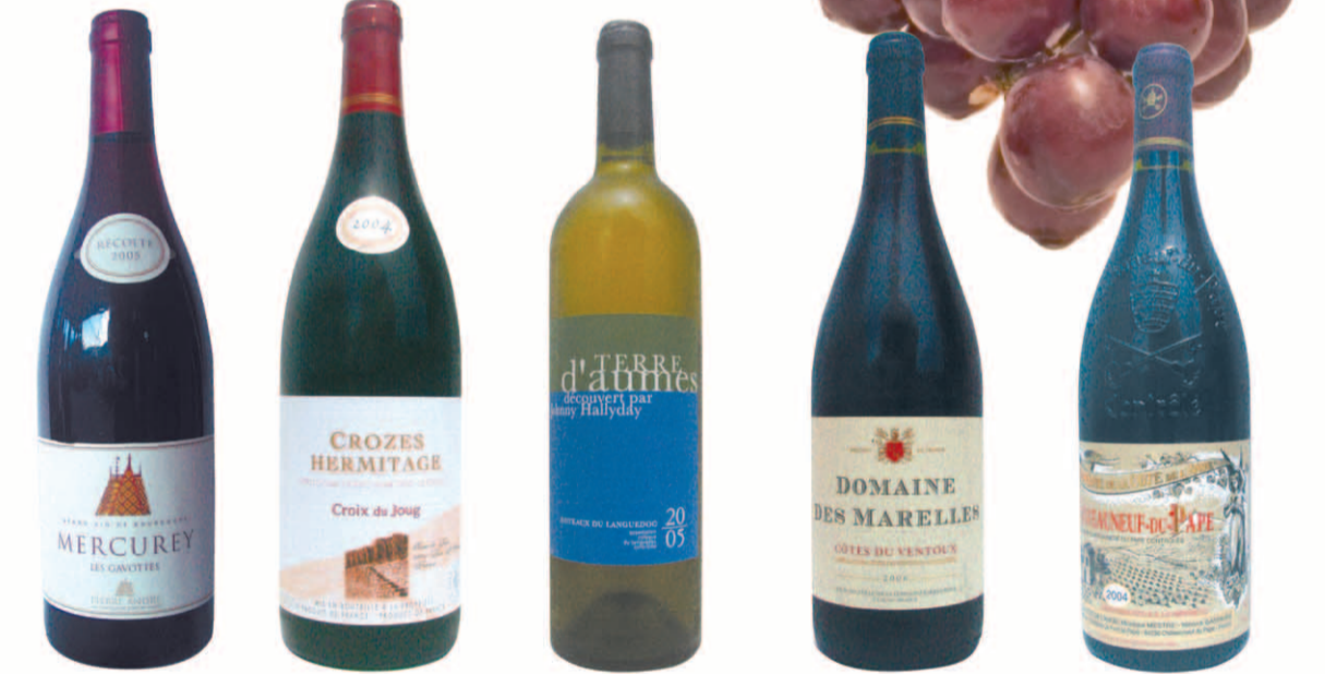
Bourgogne Mercurey 2005 - 75cl Crozes Hermitage 2004 - 75cl Coteaux du Languedoc Terre d'Aumes Johnny Hallyday 2004 - 75cl Côtes du Ventoux Domaine des Marelles 2006 - 75cl Châteauneuf du Pape Domaine de la côte de l'Ange 2004 - 75cl

5 BOUTEILLES DE VIN identiques achetées la 6 ème OFFERTE