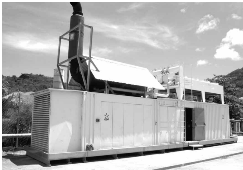
Le nouveau moteur Caterpillar de 1,3 MW installé à la centrale EDF devrait permettre de passer la pointe 2007. Mais après?

Fin 2007, EDF s'attend à ce que ce pic culmine à pratiquement 20 MW, atteignant en cela la capacité de production maximum en régime normal dont disposait l'usine avant l'arrivée du nouveau moteur qui permet aujourd'hui à la centrale de délivrer -si tout va bien- 21,3 MW. Si tout va bien. Car pour reprendre l'image de Pascal Rother, en charge de l'exploitation de l'usine «si un moteur tombe en panne, on n'a plus rien sous le pied». Dans ce scénario catastrophe, EDF compte d'abord sur la