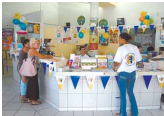
Tout sourire pour la troisième édition de la Fête de la Poste.

Sous le slogan «Souriez, vous êtes à La Poste», La Poste fêtait jeudi 20 septembre la troisième édition de la Fête de la Poste. A cette occasion, le bureau de Gustavia se parait de ballons et fanions jaunes et bleus. Deux stands étaient spécialement dressés pour l'occasion. Sur le premier, étaient mises en vente les deux séries de timbres émis pour cette journée de fête : le carnet Sourires «Vaches», un carnet de 10 timbres autocollants illustrés de 5 visuels humoristiques et un carnet «fête de la Poste» de 5 timbres autocollants. C'était également l'occasion pour La Poste de remettre en avant la série d'enveloppes pré-timbrées du concours de peinture 2007, ainsi que celle de la