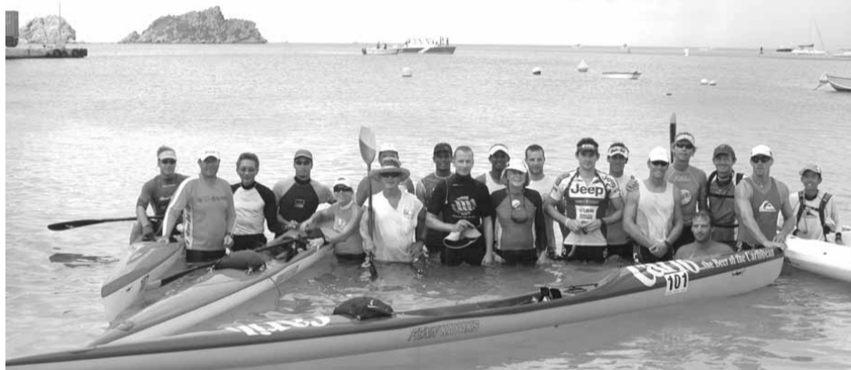
Photo de famille à la plage de Public avant le départ