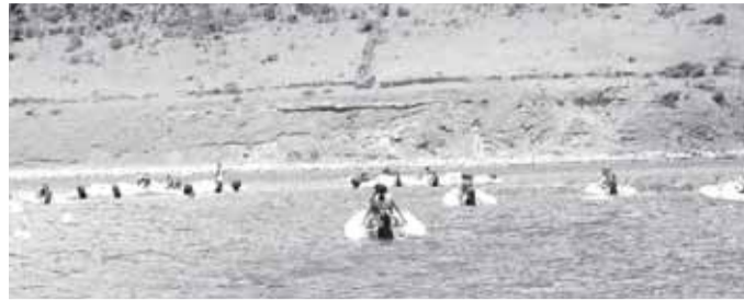
La Réserve a installé au Rocher Créole des bouées dites écologiques, avec un ballon intermédiaire remontant la chaîne pour éviter qu'elle ne traîne sur les fonds

La Réserve naturelle de Saint-Martin vient de signer une charte qui entrera en vigueur le 1er octobre avec l'ensemble des clubs de plongée français et hollandais fréquentent régulièrement ses spots de plongées sous-marines. Avec environ 200 000 personnes par an sur le site du Rocher Créole, aussi bien en activité de découverte en surface (snorkeling) comme en plongée sous-marine, la Réserve naturelle a jugé important de mettre en place une véritable réglementation des activités pratiquées sur place, d'où la signature de cette charte, validée désormais par les sept clubs de plongée français et trois clubs du côté hollandais de l'île. La charte, dont le texte est similaire à ce qui se pratique dans les autres réserves naturelles de France, a été visiblement bien acceptée par les différents clubs. «Il était vraiment