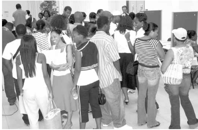
300 demandeurs d'emploi se sont retrouvés à la CCI jeudi dernier

Le "job dating", qui consiste pour un employeur et un demandeur d'emploi à se rencontrer pendant sept petites minutes, a bien fonctionné, jeudi dernier, à la CCI. Organisée par l'ANPE, la deuxième édition de cet événement, réservé au monde de l'hôtellerie et de la restauration, a mobilisé vingt-cinq employeurs, contre seulement douze l'année dernière, et trois cents demandeurs d'emploi, pour deux cents en 2005. Durement touchée par la fermeture de plusieurs hôtels, dont le Nettlé Bay Beach Club et le Mont Vernon (dont la réouverture est sérieusement mise en doute aujourd'hui, malgré des propos rassurants de la direction), l'industrie hôtelière, et tout particulièrement l'AHSM, avait envoyé ses