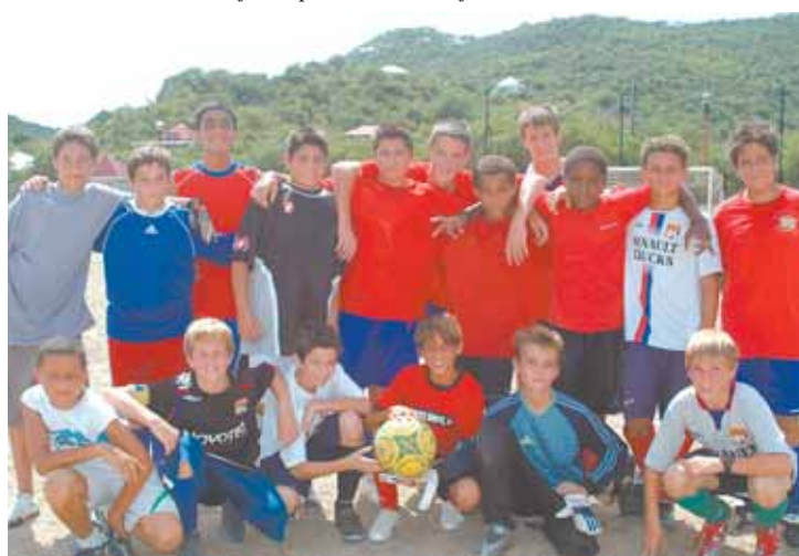
Les jeunes de l'école de l'Ajoe ont aussi participé