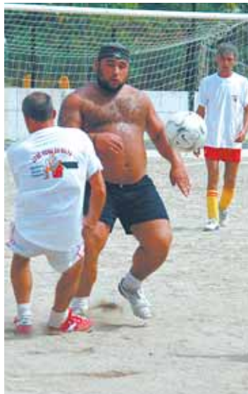
Football ou rugby ?