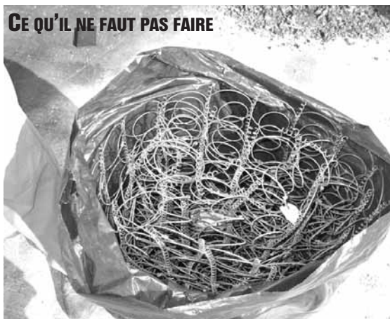
CE QU'IL NE FAUT PAS FAIRE Ce sac déposé à proximité de la benne à ordures ménagères au service de propreté et couvert par un autre plastique noir aurait pu causer de sérieux dégâts et en tout cas bloquer le four de l'incinérateur s'il n'avait été trouvé à temps. Il semble donc bon de rappeler que les ferrailles font l'objet d'un dépôt particulier, puisqu'elles ne sont pas incinérées, mais compactées puis expédiées vers une filière de recyclage.