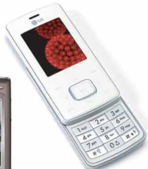
LG CHOCOLATE BLANC

ST-BARTH ELECTRONIQUE Les Galeries du Commerce à St-Jean, Tél: 05 90 27 50 50