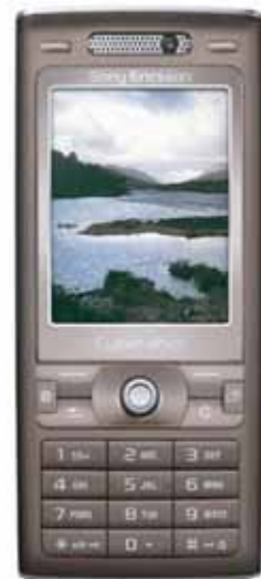
SONY ERICSSON K800i