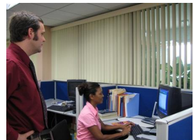
Formation dans les locaux de CARICOM au Guyana

Depuis 2005, dLOC a formé sur leur lieu de travail plus de 375 personnes au cours de 25 sessions de formation. A l'occasion d'une formation organisée lors de la conférence de l'Association des Bibliothèques Universitaires, de Recherche et Institutionnelles de la Caraïbe (ACURIL), 100 personnes ont assisté à un atelier et plus de 600 autres ont pu consulter un poster sur dLOC. Le manuel de numérisation, trilingue, les vidéos disponibles en ligne et d'autres documents sur différents supports fournissent à nos partenaires tous les outils nécessaires à la création de programmes locaux de numérisation. D'autres programmes de formation sont en cours de développement.