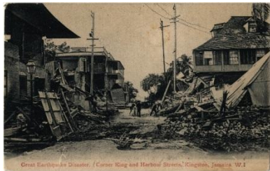
Great earthquake disaster: Corner King and Harbour streets. Kingston, Jamaica. W. I., [1907?]