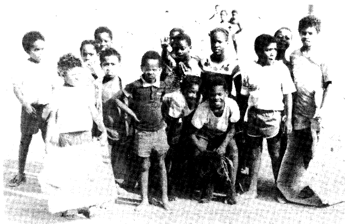
...enkele kinderen van Hebron...

vang-centra geldt dat dus juist niet. Derhalve biedt de entree rond tien uur een goed beeld van de gemiddelde drukte die een kinderkuis met zich meebrengt met vijftig hongerige, speelgrage, zeurende, joelende en alles-willen-weten kinderen.