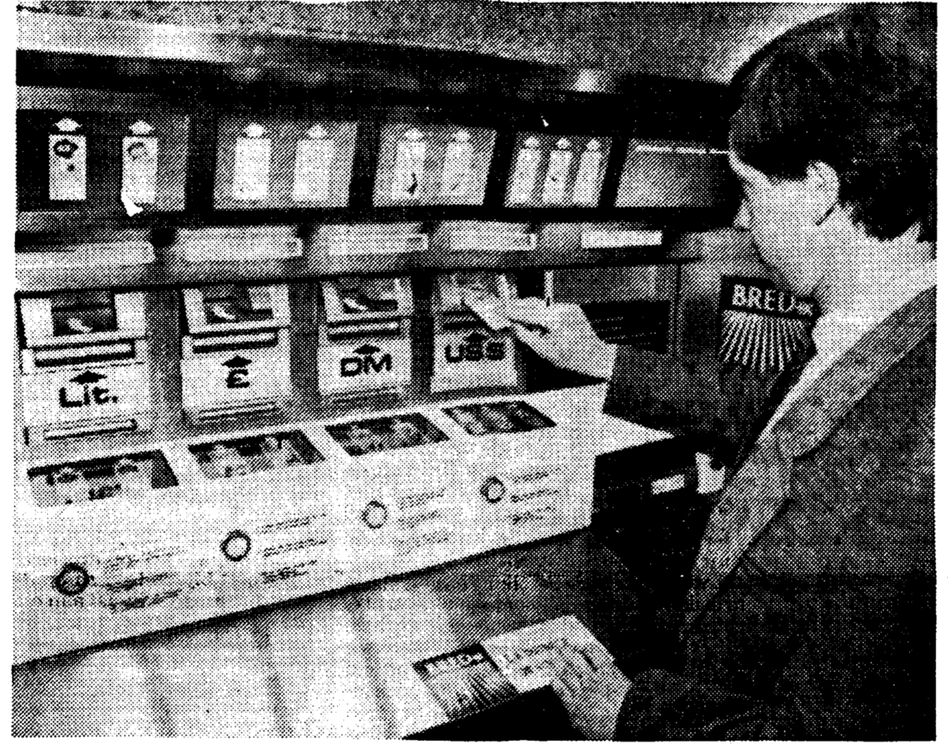
PARIS — Amsterdam had enige tijd geleden de primeur van een rijdend geldwisselkantoor. Parijs bleef niet achter. Daar werd de eerste automatische geldwisselaar in gebruik genomen, die vierentwintig uur per dag geopend is. In ruil voor enkele internationale valuta verstrekt de automaat Franse francs in biljetten van honderd of tweehonderd. De wisselaar staat op de Avenue Champs Elysees.