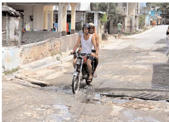
Varios accidentes ha provocado este bache en la calle 10 de Octubre (Guarro), ciudad de Holguín.