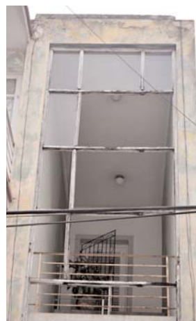
Cristales a punto de caerse, en el edificio de la calle Aguilera entre Mártires y Maceo, ciudad de Holguín.