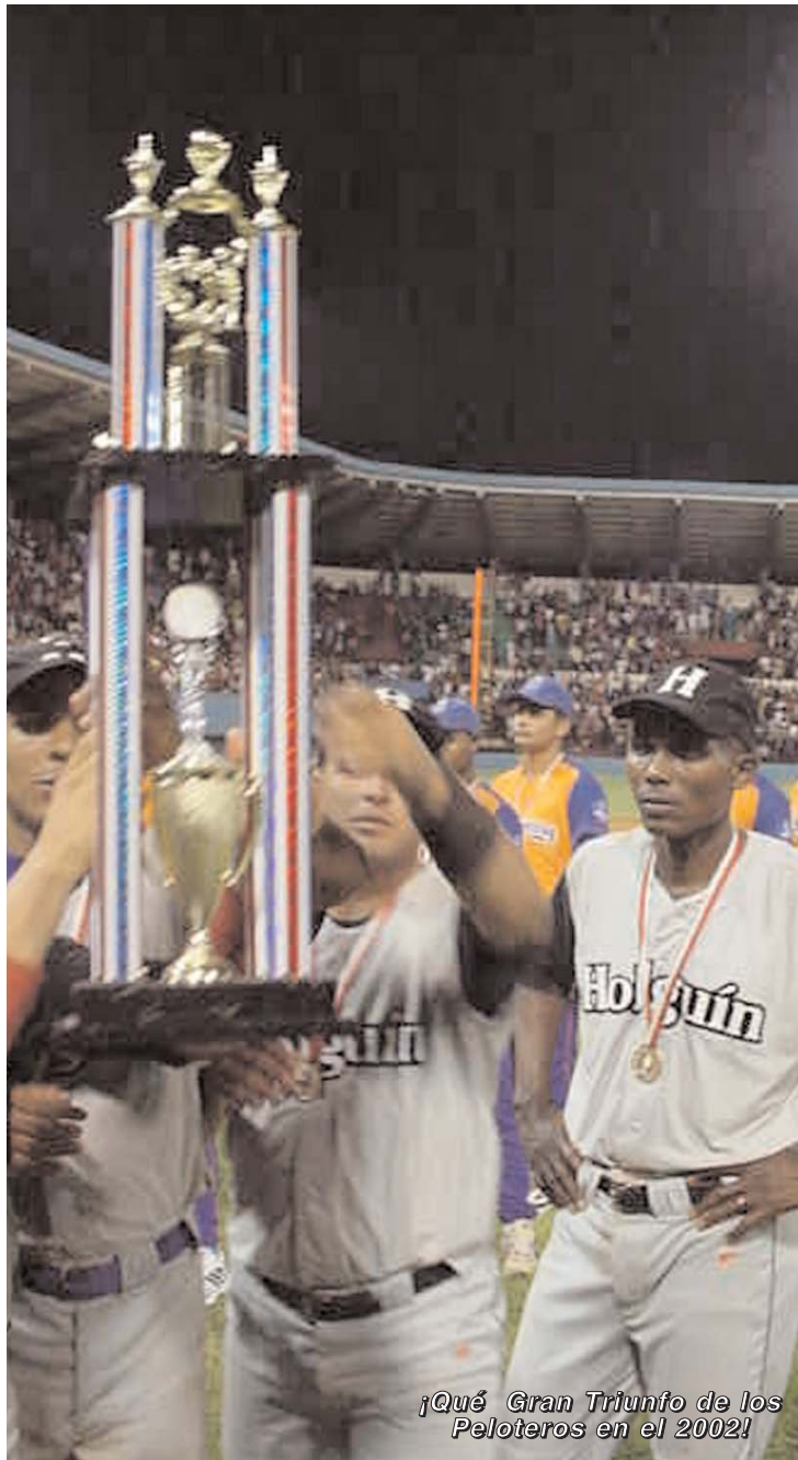
¡Qué Gran Triunfo de los Peloteros en el 2002!

Luego el fútbol mejoró para, seguidamente, descender en sus campeonatos del país, al contrario del plantel de pelota, que poco a poco escaló posiciones y ya en la XLVIII Serie volvió a clasificarse para los play offs y en la campaña actual aún lucha por repetir ese logro, no obstante las dificultades que muestra esta disciplina en la base, igual que el boxeo, cuyos resultados más recientes son muy malos.