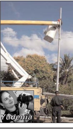
Obreros de la Empresa Eléctrica trabajan sin descanso en el alumbrado público de la Avenida de los Libertadores.