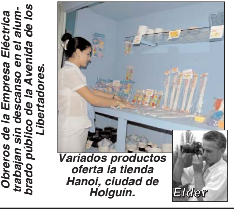
Variados productos oferta la tienda Hanoi, ciudad de Holguín.