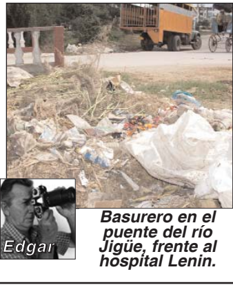
Basurero en el puente del río Jigüe, frente al hospital Lenin.