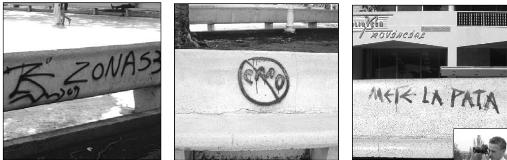
Estos grafitis empañan la belleza del parque Calixto García y mucho más su historia. Muestran una pobre vigilancia y sentido de pertenencia.