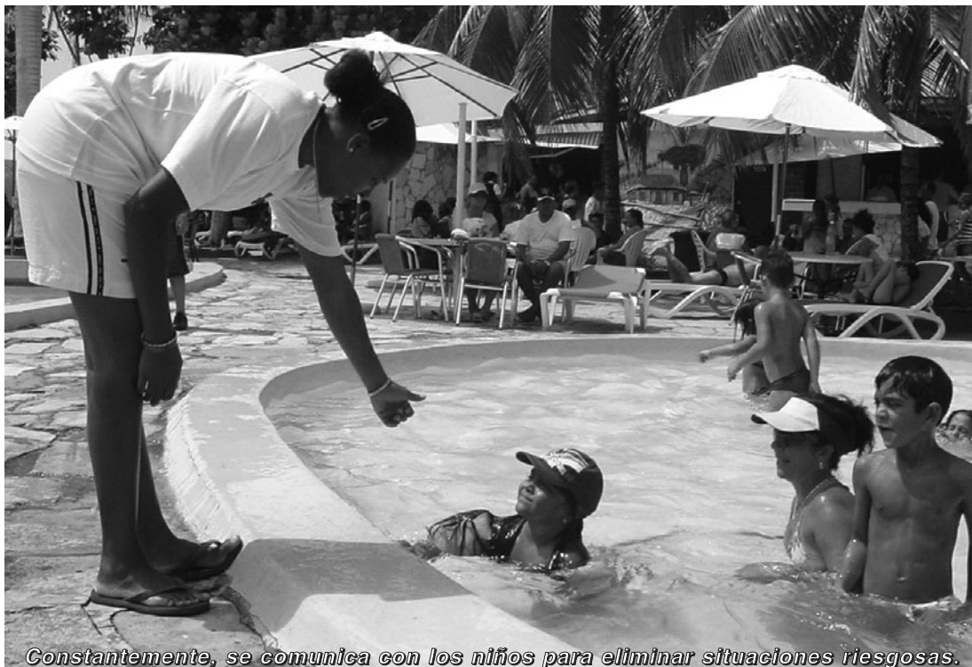
Constantemente, se comunica con los niños para eliminar situaciones riesgosas.

Enseñó los conocimientos de "la bola mojada" a las nuevas generaciones. Incursionó en el buceo y bajó bien profundo en zonas del litoral holguinero. Entonces llegó a la Escuela de Salvavidas Jean Henri Dunant, en La Habana. Empezaría a reconocer el peligro y evitar trágicos sucesos. Hasta ese momento, las referencias se resumían a la serie televisiva