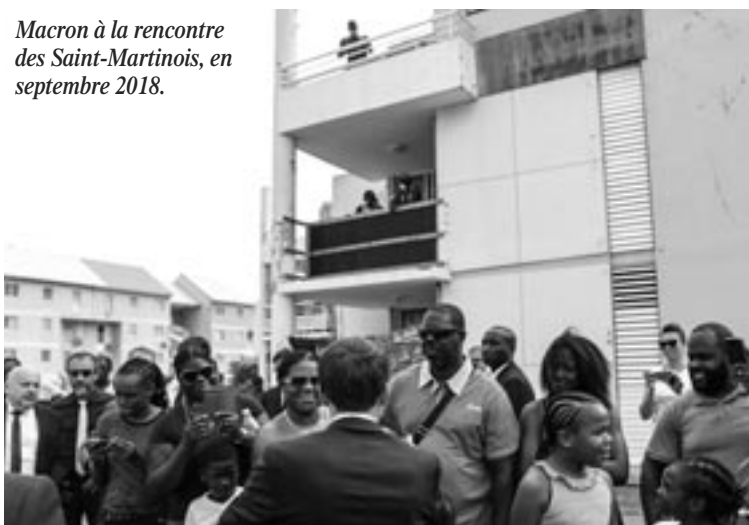
Macron à la rencontre des Saint-Martinois, en septembre 2018.

En Guyane, les habitants peinent à se sentir concernés. Là aussi, des annonces avaient été faites par le gouvernement après la crise sociale au printemps 2017. Les deux seules réunions publiques des Antilles, à ce jour, ont été organisées en Martinique. A Saint-Pierre-et-Miquelon, les élus incitent les habitants à s'exprimer dans le cahier de doléances et à prendre des initiatives, sans grand succès à