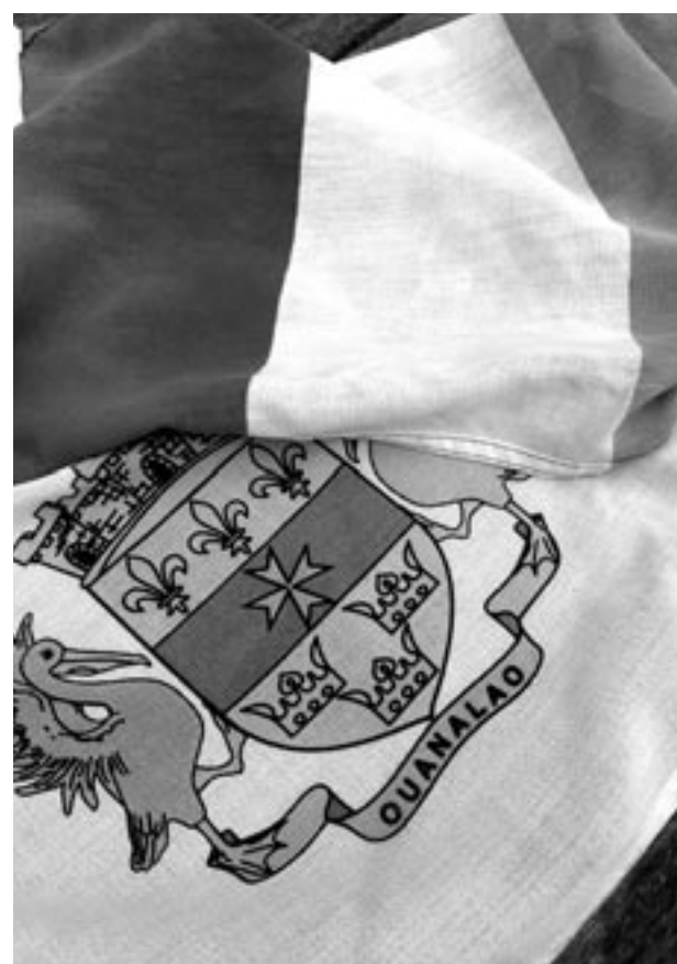
Justice, sécurité, santé, éducation : l'Etat gère des domaines très importants à Saint-Barth, même si la Collectivité assume de nombreuses compétences.

Les questions sur la citoyenneté et la représentation de Saint-Barth au niveau national sont aussi capitales. La députée des îles du Nord Claire Javois Guion Firmin, avec tous les dossiers saint-martinois, a tendance à oublier Saint-Barthélemy dans son action politique à l'Assemblée nationale. Et avec la réforme des institutions voulues par Emmanuel Macron, on ignore si le siège de sénateur de Saint-Barthé-