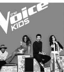
The voice kids, TF1

TF1 17.10 4 mariages pour 1 lune de miel 18.15 Bienvenue chez nous 19.20 Demain nous appartient, série 20.00 Le journal 20.35 Le 20 h le mag. 20.45 My Million, jeu