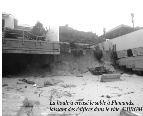
La houle a creusé le sable à Flamands, laissant des édifices dans le vide.

été touchée par la hausse du niveau de la mer, tout comme Gustavia, où une submersion de 1,2 mètre a été observée par le BRGM.