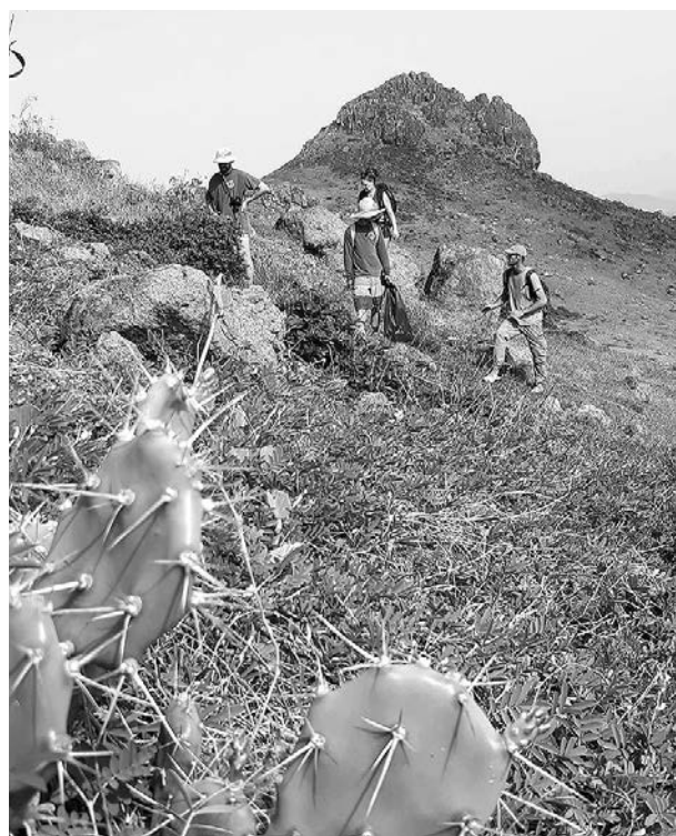
Mission inventaire faune et flore à Fourchue, sous la houlette de l'ATE.

A l'autre bout de l'île, du côté de Petit-Cul-de-Sac, une autre équipe « INE » est au travail pour créer un sentier qui reliera la plage aux piscines naturelles. Le cheminement sera aménagé, et surtout, une convention sera signée entre les propriétaires des terrains concernés, la Collectivité et