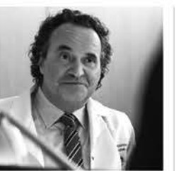
Nina, France 2

TF1 17.10 4 mariages pour 1 lune de miel 18.15 Bienvenue chez nous 19.20 Demain nous appartient, série 20.00 Le journal 20.35 Le 20 h le mag. 20.45 Loto, jeu