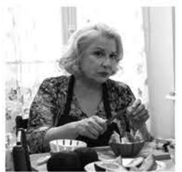
Retour chez ma mère, TF1

TF1 17.25 Sept à huit life, mag. 18.25 Sept à huit, mag. 19.45 Les apprentis du goût 19.50 Saga hippique 20.00 Le journal 20.35 TF1 rendez-vous sport 20.40 Habitués demain