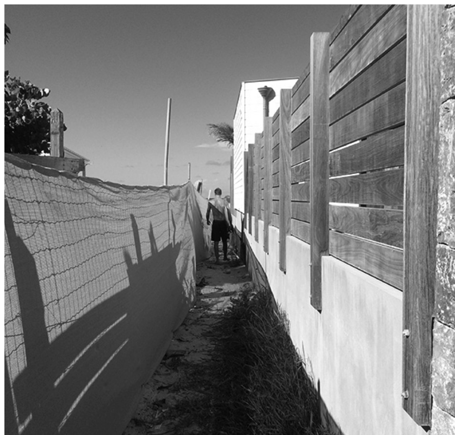
Le chemin actuel, seul accès à la plage de l'Anse des Cayes, ne laisse passer ni véhicule d'urgence ni camion plein de sargasses.

Une partie de terrain appartenant au Manapany est aussi nécessaire pour garantir un accès de trois mètres jusqu'au sable. L'établissement l'a cédée à la Collectivité à titre gratuit.