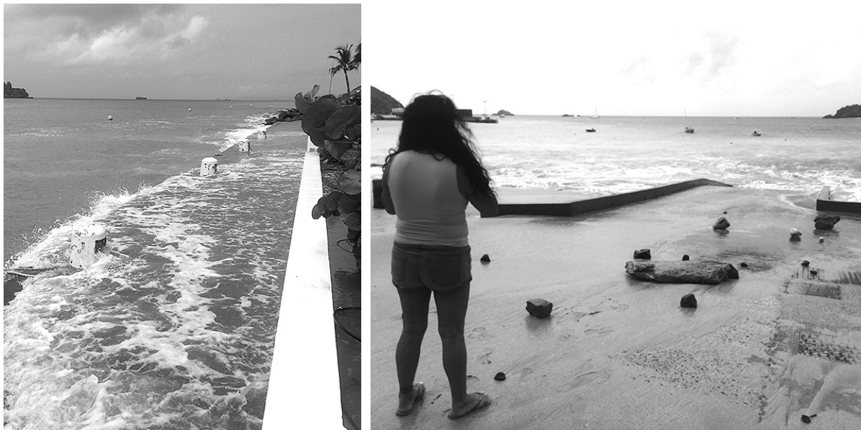
Mer agitée en particulier dans la rade de Gustavia, à Public et à Corossol.

Samedi et dimanche, une puissante houle provoquée par l'ouragan Leslie, situé à plus de 1.500 kilomètres des Antilles, a déferlé sur nos côtes. La production d'eau a été stoppée et le matériel de la Sidem endommagé.