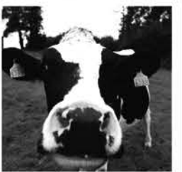
L'amour est dans le pré, M6

TF1 18.15 Bienvenue chez nous 19.20 Demain nous appartient, série 20.00 Le journal 20.35 Le 20 h le mag, mag. 20.45 Loto, jeu 20.50 C'est Canteloup