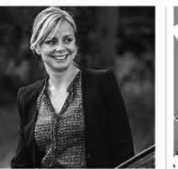
Les héritiers, Arte

TF1 17.10 4 mariages pour 1 lune de miel 18.15 Bienvenue chez nous 19.20 Demain nous appartient, série 20.00 Le journal 20.35 Le 20 h le mag.