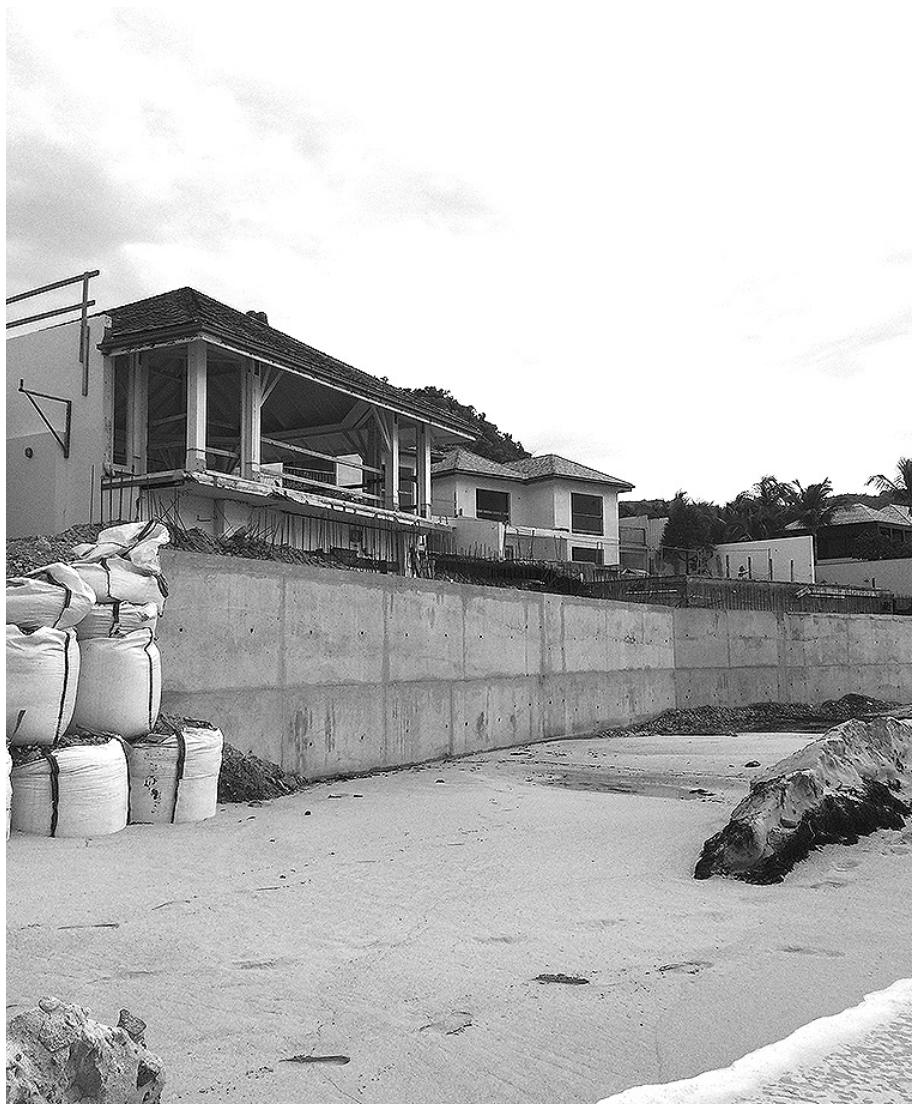
Les bâtiments meurtris par l'ouragan Irma désormais protégés par des murs.