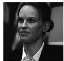
Logan Lucky, Canal+

TF1 19.05 50' inside, mag. 19.50 Les apprentis du goût 20.00 Le journal 20.35 Habitués demain 20.37 Loto, jeu 20.45 Merci ! 20.50 Quotidien express