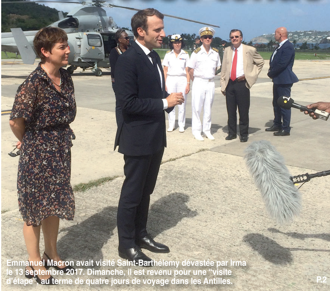
Emmanuel Macron avait visité Saint-Barthélemy dévastée par Irma le 13 septembre 2017. Dimanche, il est revenu pour une "visite d'étape", au terme de quatre jours de voyage dans les Antilles.