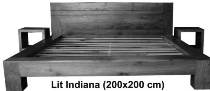
Lit Indiana (200x200 cm)