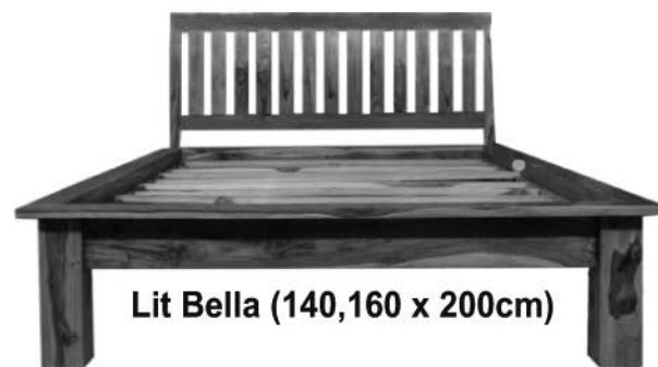
Lit Bella (140,160 x 200cm)