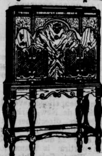
Modèle C-84 8 lampes Superheterodyne 2 Hauts parleurs.