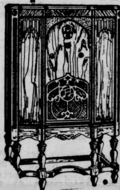
Modèle C-83 Radio - 8 lampes; Superheterodyne