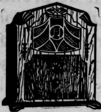
Modèle C-84 8 lampes-Superheterodyne