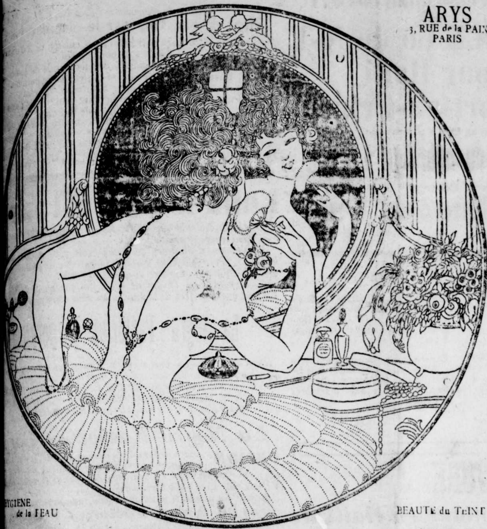
BEAUTE du TEINT

Or 8 00 le millier Ed ESTEVE & Co PORT-AU-PRINCE