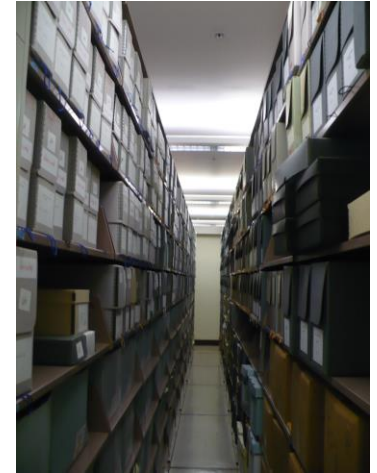
Anaqueles en UF.