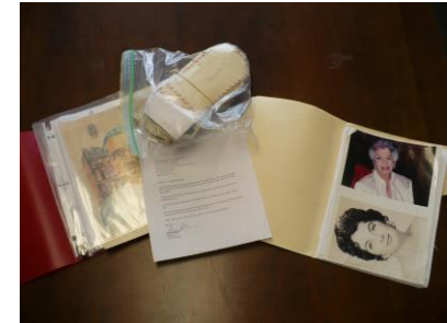
UF UNIVERSITY of FLORIDA