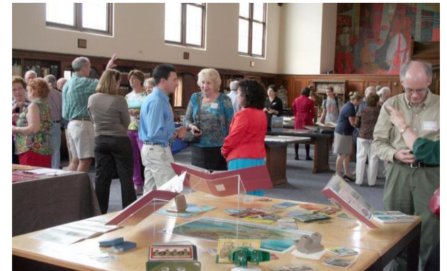
Evento "Gracias a ti!" 5 de octubre del 2012. Universidad de Florida.