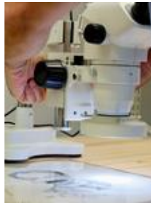
CUBAN HERITAGE COLLECTION UNIVERSITY OF MIAMI LIBRARIES