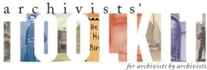
Archivists' Toolkit (Universidad de Florida)